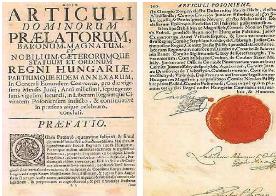
Slika 1: Pragmatička sankcija

mjesto dolazi njegov mlađi brat Karlo, okrunjen kao Karlo VI. Josip je tijekom vladavine pokušao je ojačati carsku vlast, također nastavio je provođenje politike svog oca prema jadranskim lukama te je razmišljao o poticanju razvoja Trsta, no zbog prerane smrti ništa nije u potpunosti realizirano. 19