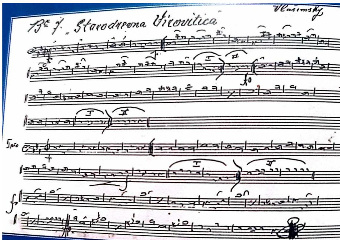
Slika 6. Iz pjesmarice Društva za promicanje glazbe „Flurgelhorn 2 B“ (1920.godina)