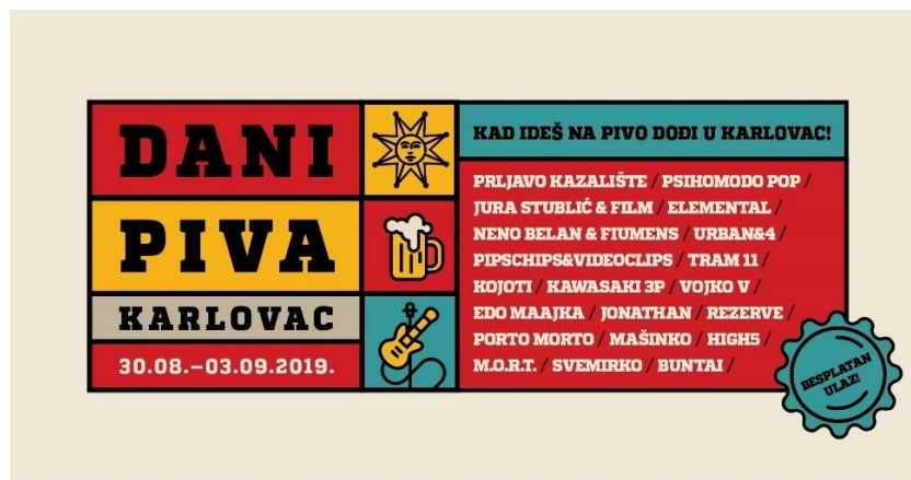
Slika 4., Prikaz programa Dana piva