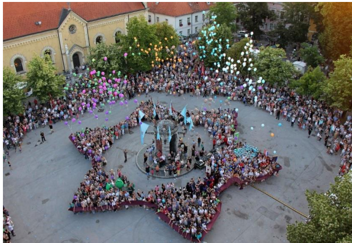
Slika 5., Karlovačka zvijezda