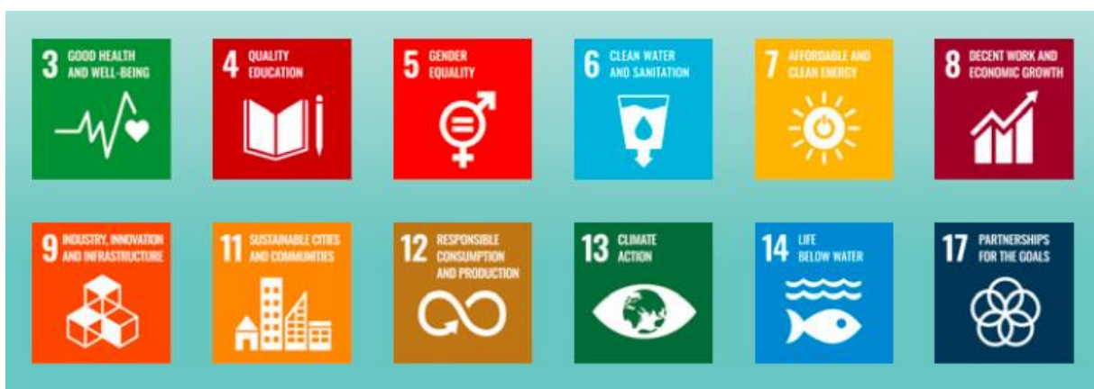
Slika 11. ključni pokazatelji uspješnosti