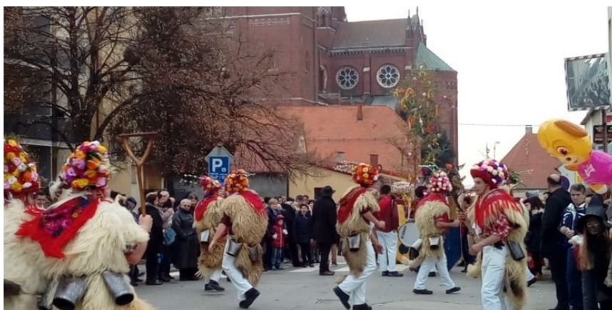
Slika 20. Đakovački bušari

Godine 1994. u Đakovu je osnovan karneval koji nosi ime Đakovački bušari. Naziv buše označuje maskirane ophodnike u pokladama kod Hrvata u hrvatskom i u mađarskom dijelu Baranje te u istočnijem dijelu Slavonije, napose oko Đakova. Zbog značenja i zbog pojedinosti koje na to upućuju predlaže se mogućnost povezanosti naziva buše, bušari s uši bušina (naziv za treći tjedan, nedjelju, pred završne poklade pravoslavnih) i uši bušiti (ušiti, bušiti) u značenju: mrsiti (ne održavati nemrs, post) 20 . Glavni događaj je velika pokladna povorka koja se odigrava na ulicama centra grada. Ispred zgrade Gradskog poglavarstva održava se ceremonijal preuzimanja vlasti, osniva se Bušarska republika, a gradonačelnik predaje ključeve grada Bušarima. Na kraju sve završava plesom pod maskama u velikom pokladnom šatoru. Đakovački su bušari po broju sudionika najveći karneval istočne Hrvatske i član su Saveza hrvatskih karnevalskih gradova.