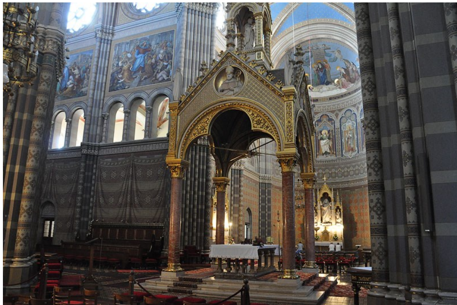
Slika 10. Glavni oltar u katedrali Svetog Petra