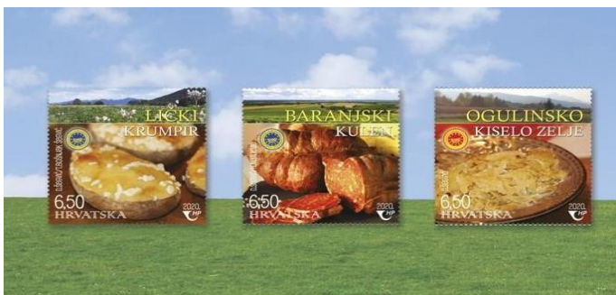
Slika 6. Prikaz zaštićenih hrvatskih autohtonih proizvoda