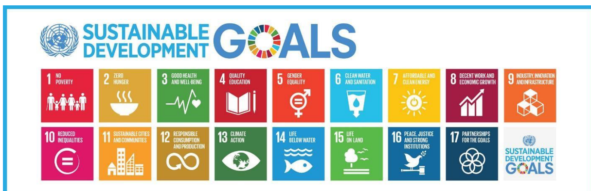
Slika 3. Prikaz 17 ciljeva održivog razvoja