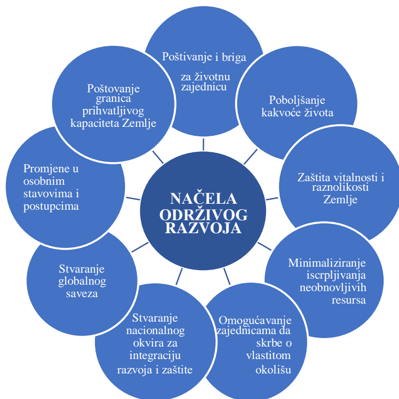
Slika 1. Načela održivog razvoja