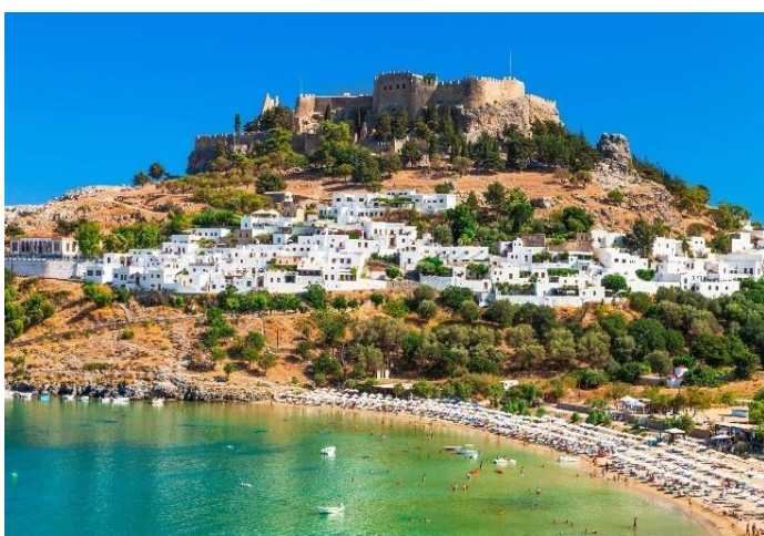
Slika 7. Prikaz otoka Rodosa u Grčkoj