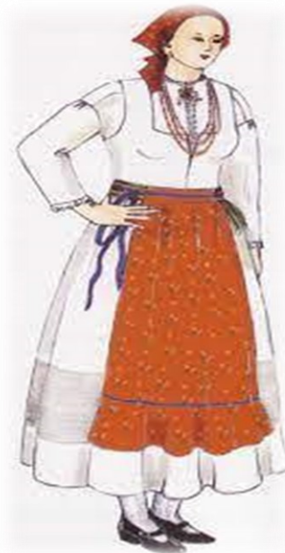
Slika 6. Delnička narodna nošnja