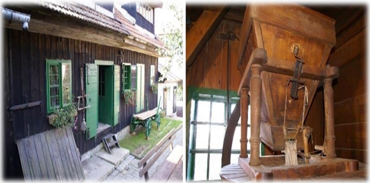
Slika 4. Mlin obitelji Popović u Delnicama