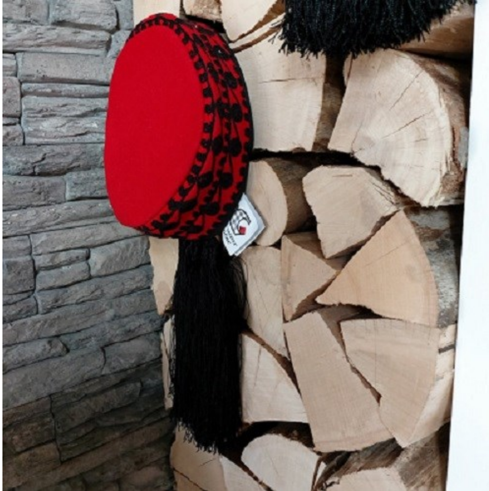
Slika 8. Lička kapa