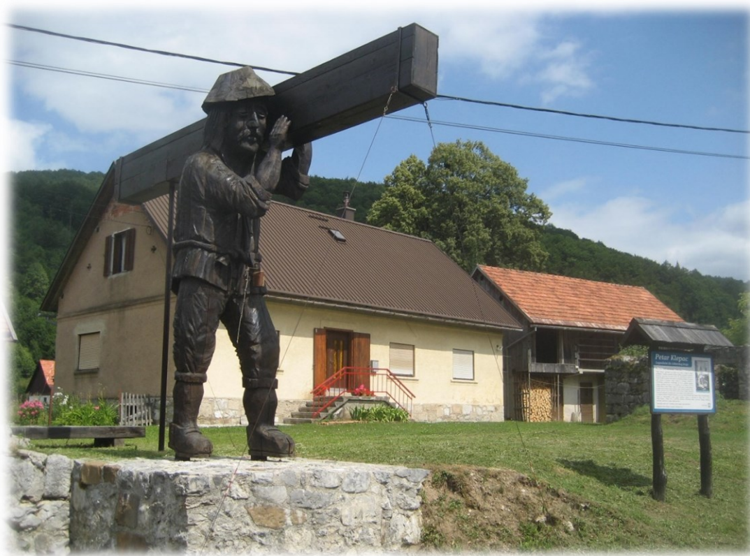
Slika 7. Spomenik Petru Klepcu u Malom Lugu

Postao je simbol snage, div-junak kojem su ljudi predajom dali najbolje vrline goranskog čovjeka poput hrabrosti, upornosti, plemenitosti, pameti i razvijenog smisla za humor. Legende o Petru Klepcu se prepričavaju i usmenom predajom prenose s koljena na koljeno. Jedna legenda govori kako je potpuno sam otjerao turske pljačkaše i zbog toga junaštva ga je austrijski car proglasio plemićem. Čabarski kraj se često naziva i zavičajem Petra Klepca. 29