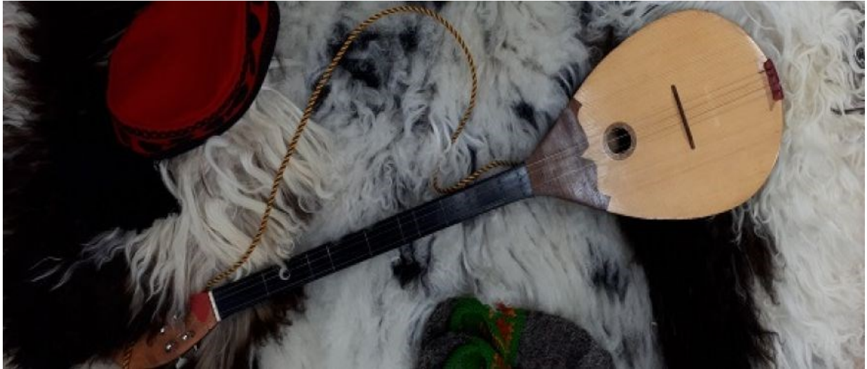
Slika 13. Tamburica Dangubica