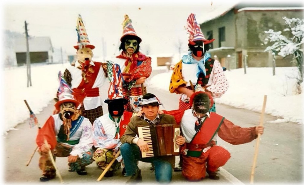
Slika 5. Crnoluški pesniki

Tradicionalnu delničku narodnu nošnju karakterizira „fiertof“ .To je šarena pregača crvene, zelene ili plave boje sa sitnim cvjetnim motivima. Osim toga postoji i koraljna ogrlica s unikatnom ukrasnom kopčom koja se naziva „kluofnca“. Etno udruga "Prepelin'c" i mještani Delnica ispunili su sve tri prostorije kuće Rački raznim predmetima iz 18. stoljeća. 28