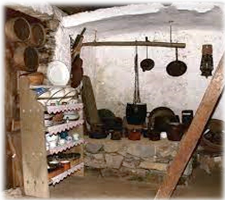
Slika 3. Unutrašnjost etno kuće Rački

Tadašnji ljudi su se bavili danas skoro nestalim zanatima koje su izučili u svojem kraju kao šegrti kod obrtnika kolara, tesara, bačvara, stolara te bravara i kovača. U Gorskom kotaru bila je poznata i trgovina tzv. suhom robom, što je podrazumijevalo drvene predmete za kućanstvo poput kuhača, sita, mišolovki, kačica za sir, solnica i dr. 23