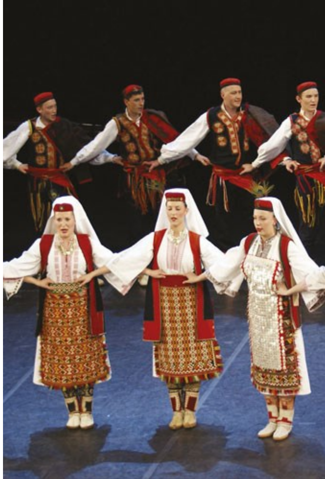
Slika 14. Lička narodna nošnja