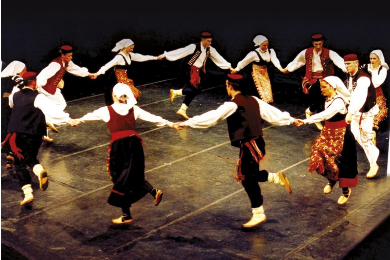
Slika 15. Ličko kolo -ples bez glazbe