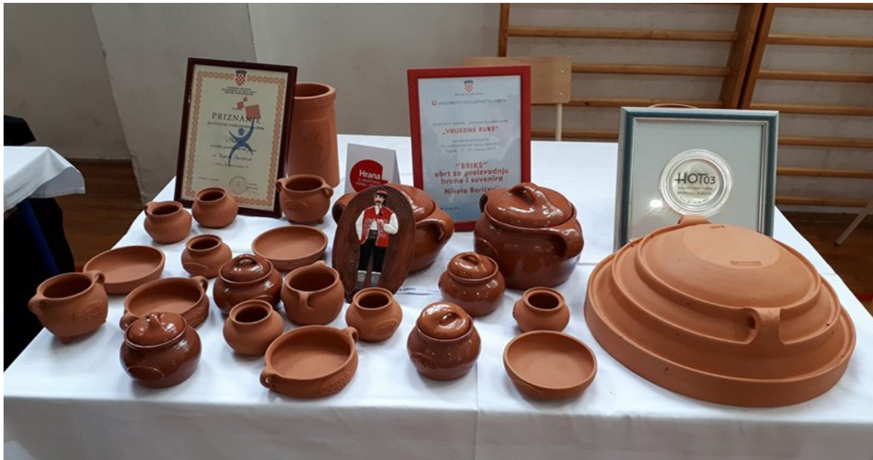
Slika 11. Zemljane posude