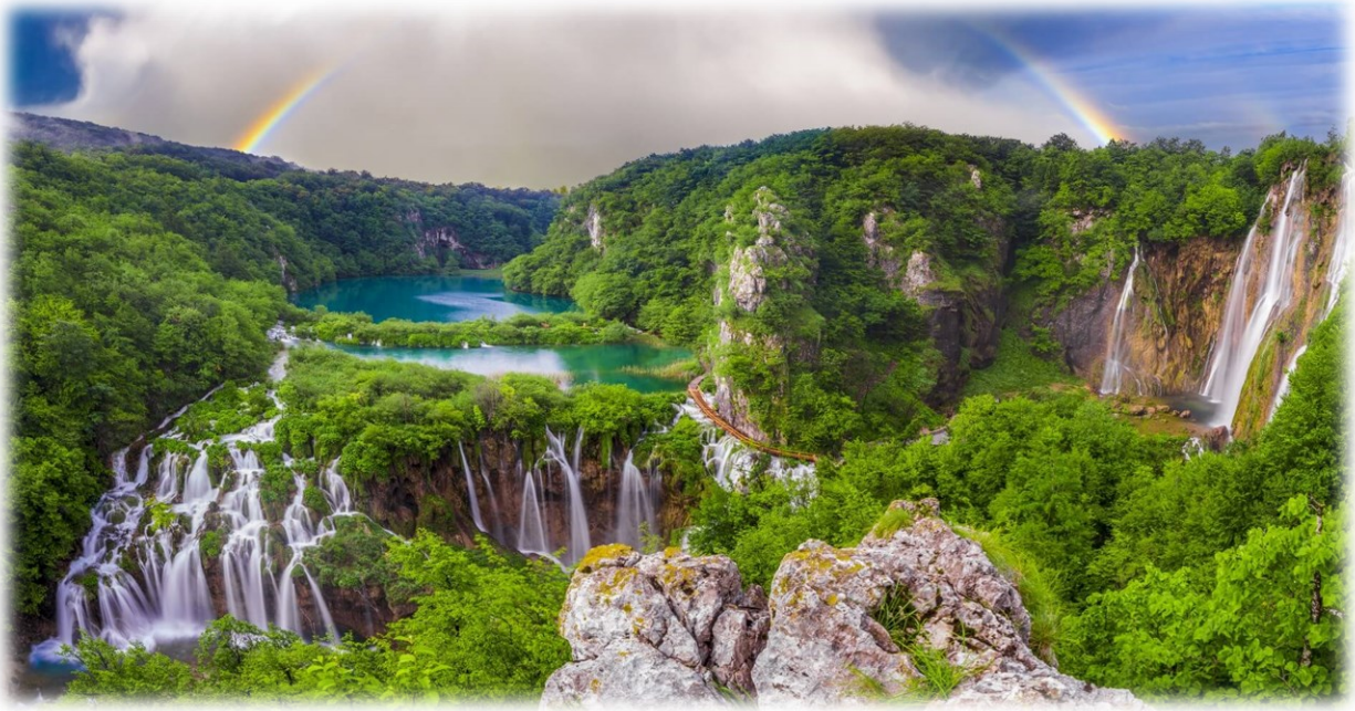
Slika 1. NP Plitvička jezera