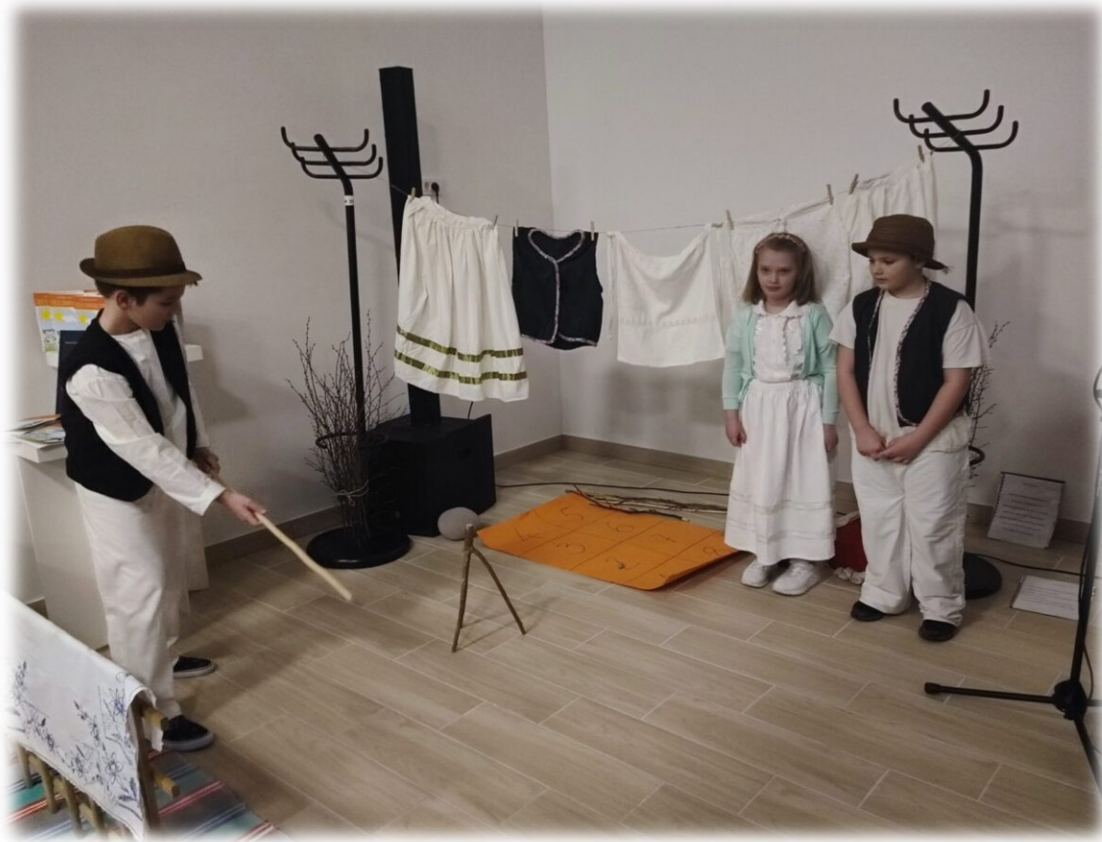
Slika 2. „Sačuvajmo od zaborava: dječje goranske igre”

Tiho pojte maleni slavuji, da se moje zlato ne probudi.