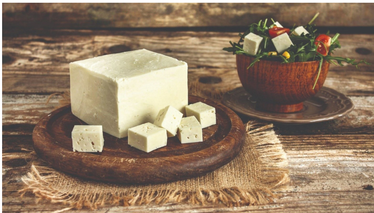
Slika 10. Lički sir škripavac

Proizvodnja ličkog sira škripavca je obično vezana uz mala obiteljska gospodarstva koja slijede tradicionalne metode proizvodnje. Proces proizvodnje je ručni i zahtijeva strpljenje i vještinu. 41