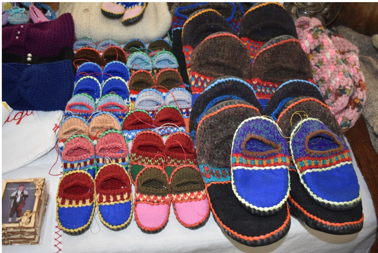
Slika 9. Ličke cokolje