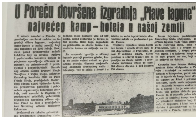
Slika 3: Izgradnja kamp-hotela Plava laguna.

restoranom. U šatorima i bungalovima moglo je boraviti oko 800 turista željnih što bližeg kontakta s prirodom. Izgradnja tada jednog od najljepših europskih kampova stajala je francusko poduzeće više od 97 milijuna jugoslavenskih dinara.