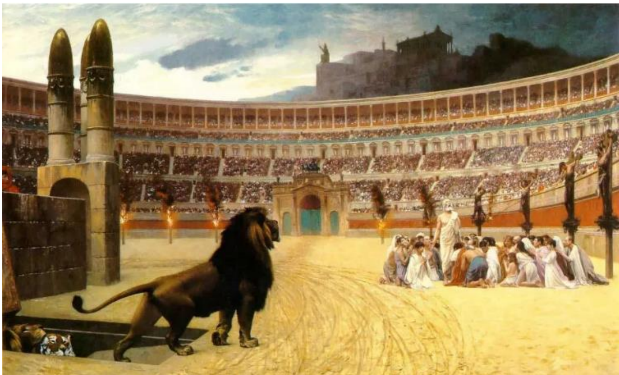
Slika 5. Slika The Christian Martyrs' Last Prayer slikara Jeana-Léona Gérômea