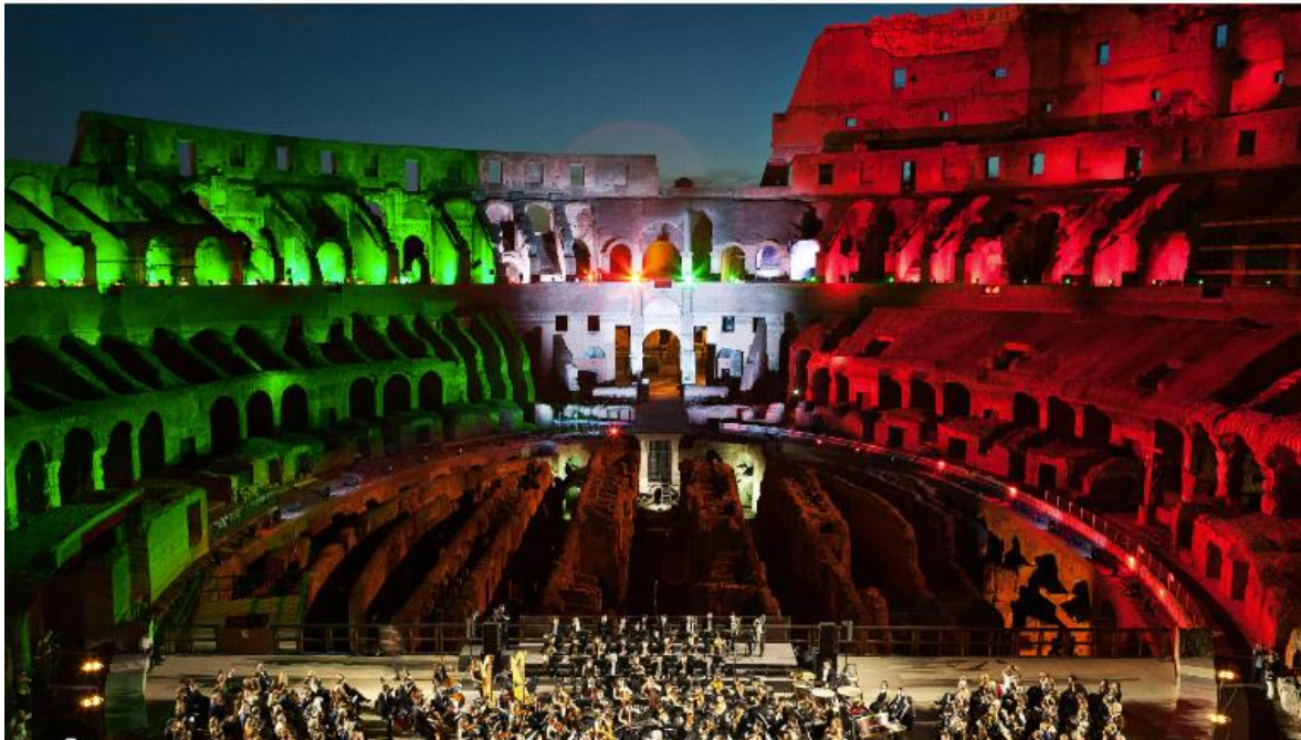
Slika 8. Jedan od rijetkih koncerata unutar Koloseja