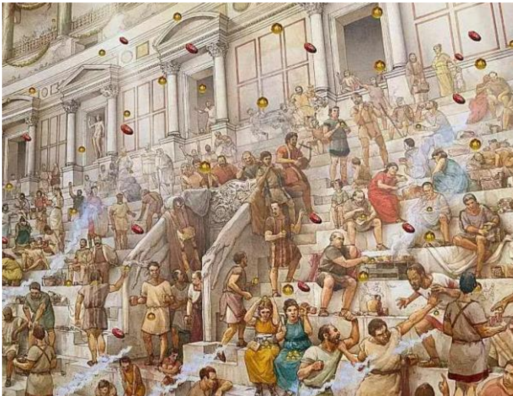
Slika 2: Ilustrirani prikaz puka u Koloseju