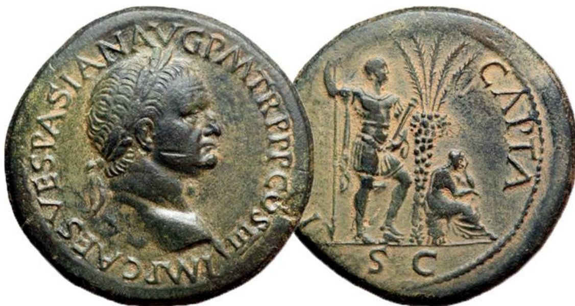
Slika 1: novčić Judaea Capta