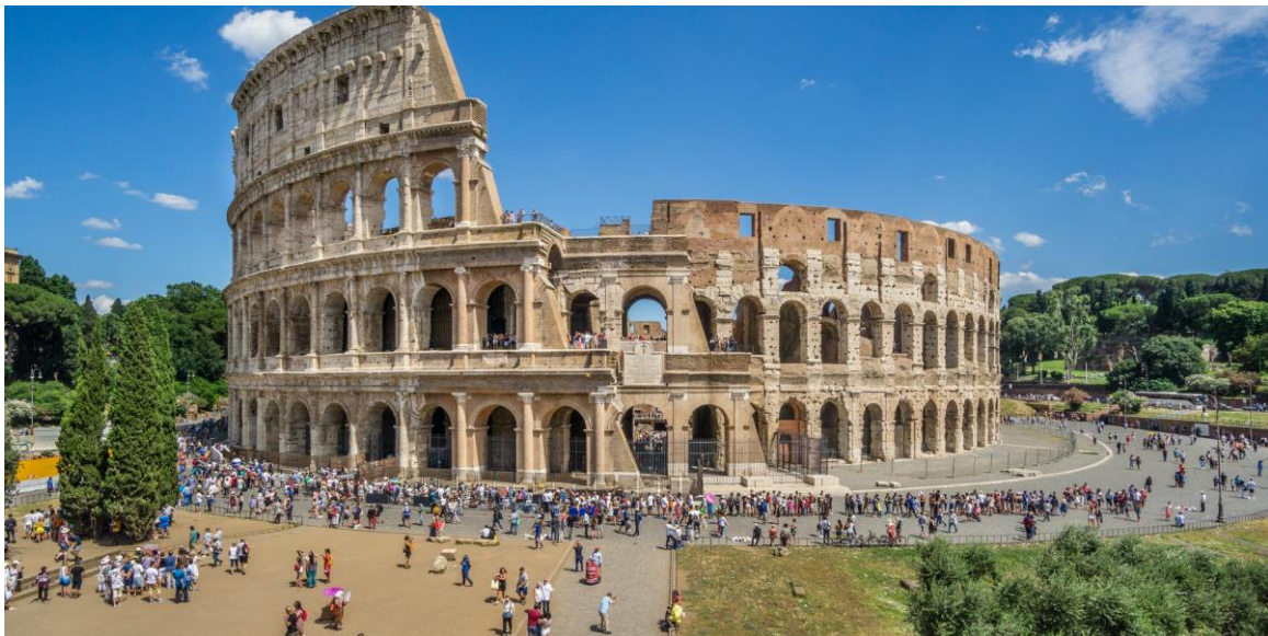
Slika 6: Kolosej izvana