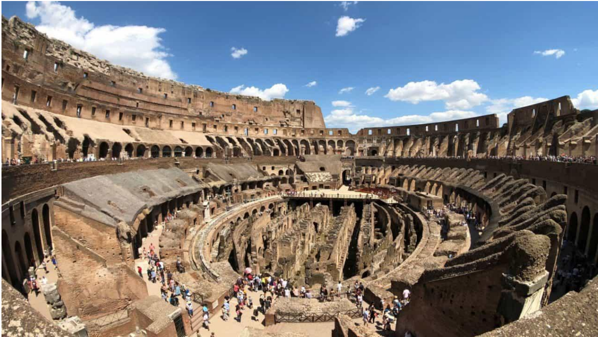
Slika 7: Unutrašnjost Koloseja