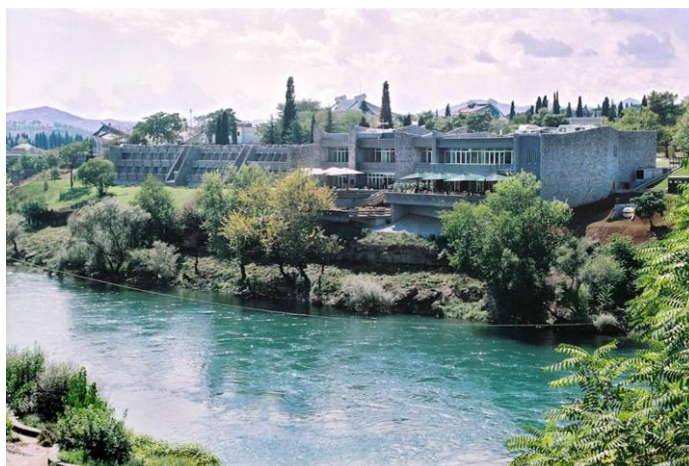
Slika 4. Hotel Podgorica