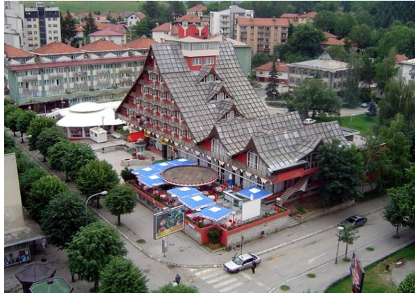
Slika 2. Hotel Pljevlja 2004.