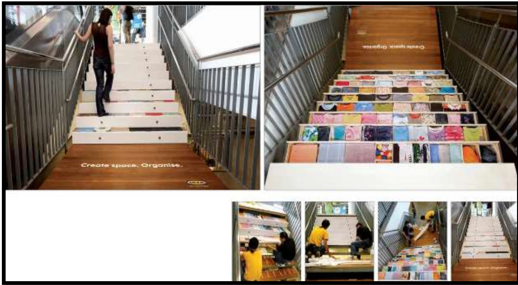
Slika 8: IKEA zakrivljene stube/stubišne ladice