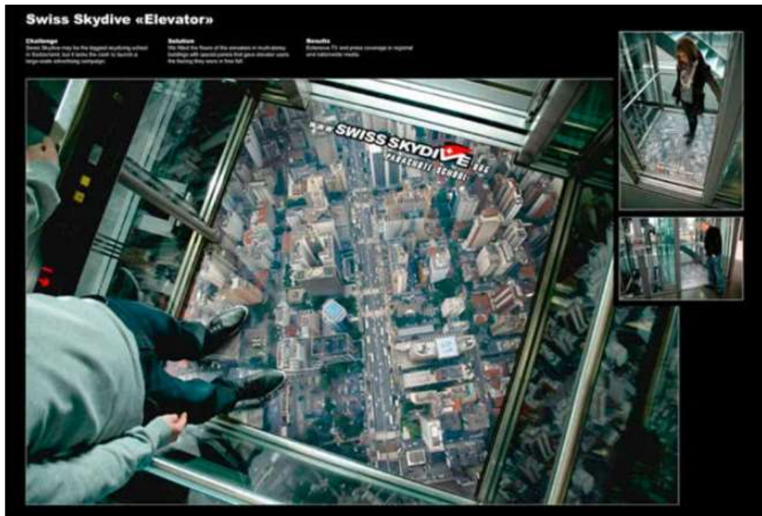
Slika 7: Swiss Skydive „Elevator“ naljepnica