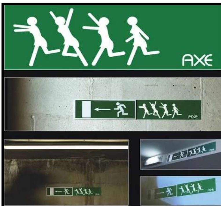
Slika 6: Axe-ove gerilske marketinške naljepnice