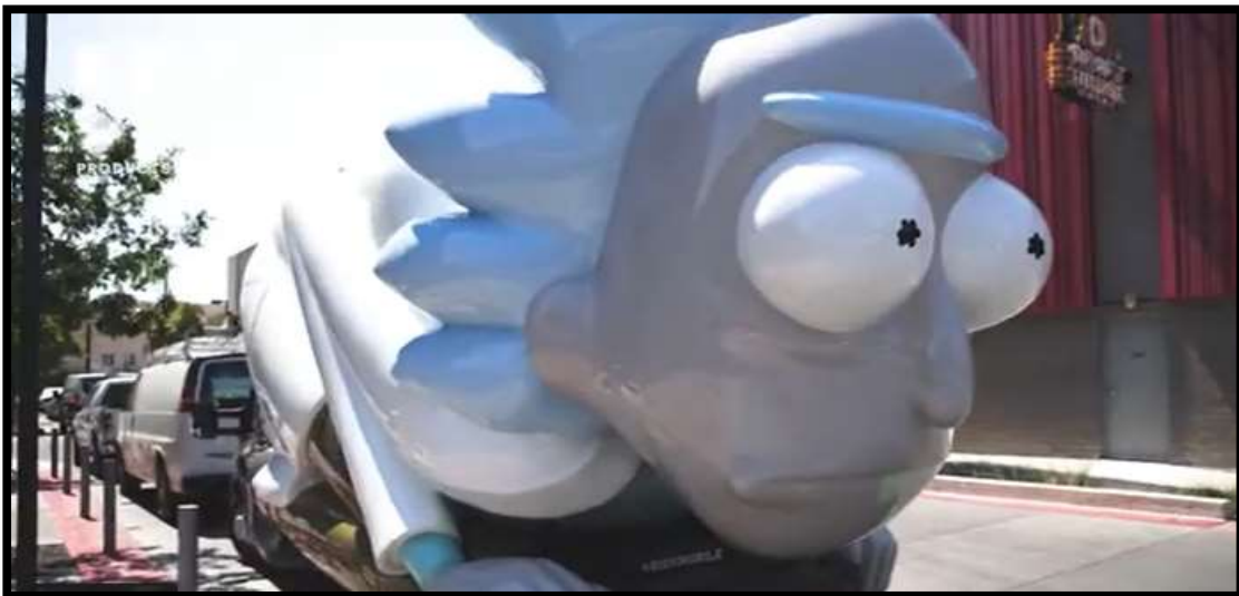
Slika 3: Iskustveni marketing – automobil u obliku Ricka iz crtane serije Rick & Morty