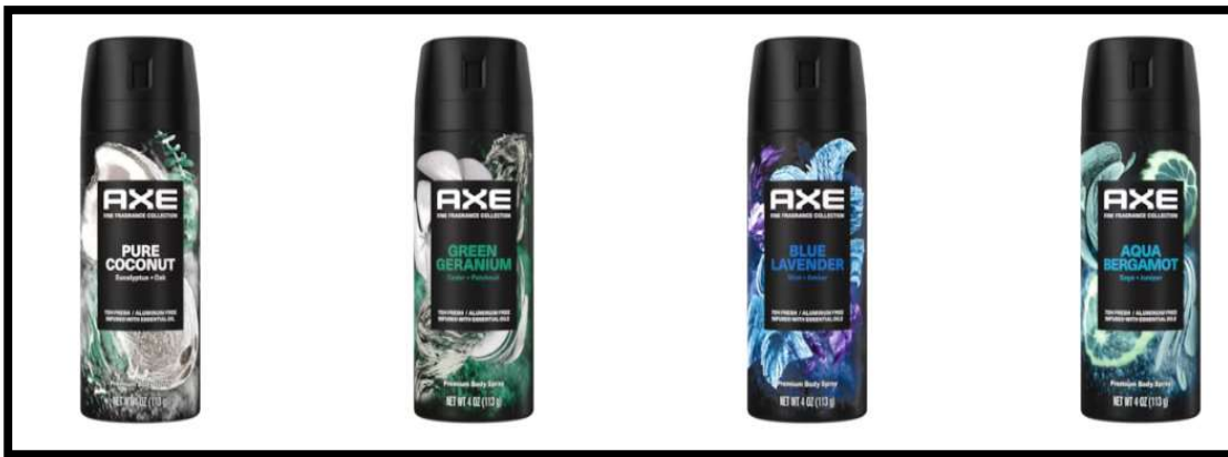
Slika 5: Sprejevi brenda Axe