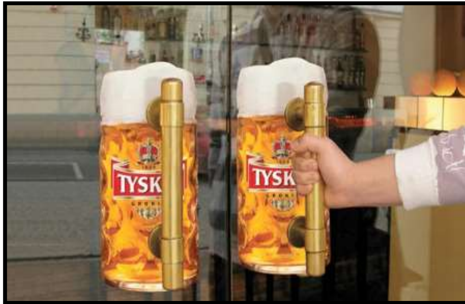
Slika 9: Prenamjena ručki na vratima za ručke krige za pivo