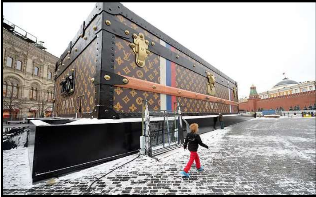
Slika 2: Ambijentalni marketing – brend Louis Vuitton na Crvenom trgu u Moskvi