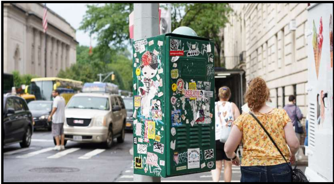
Slika 4: Divlje objavljivanje na ulicama grada New Yorka