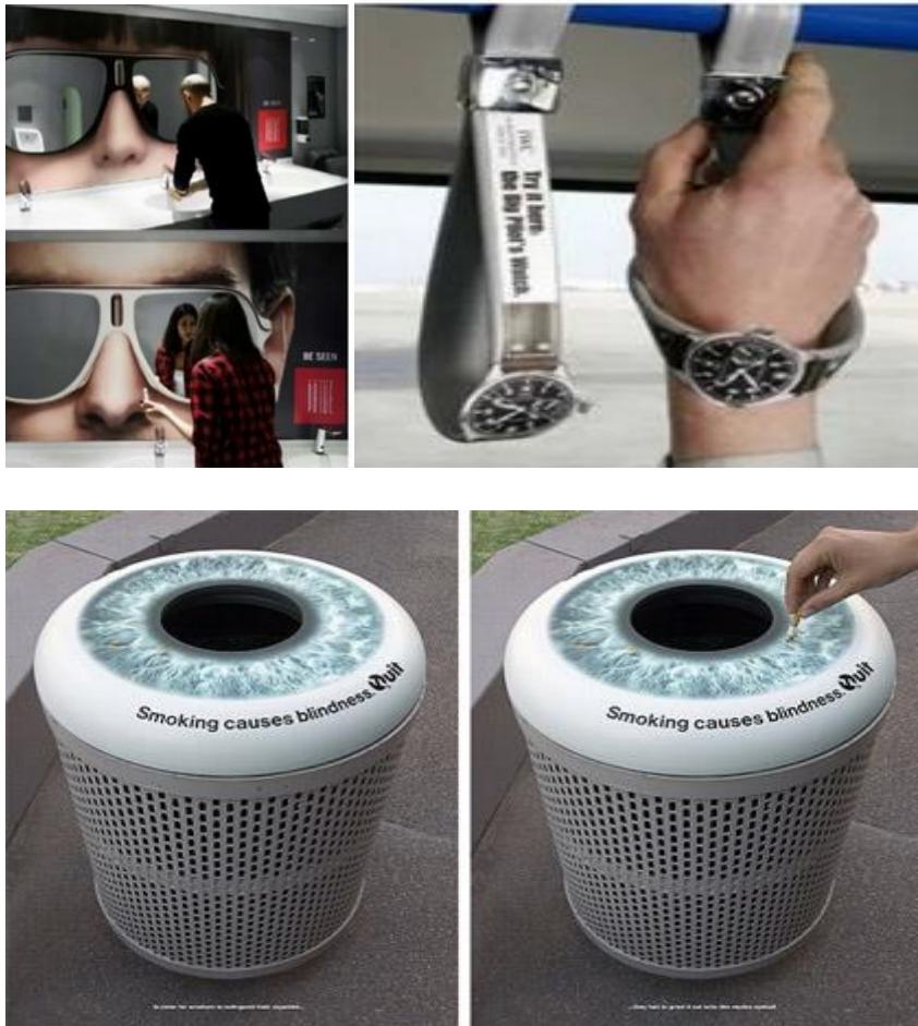
Slika 15. Primjer inovativnog oglašavanja