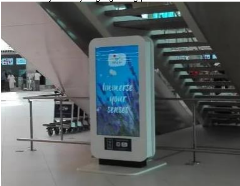
Slika 19. Primjer mirišljavog digitalnog panela