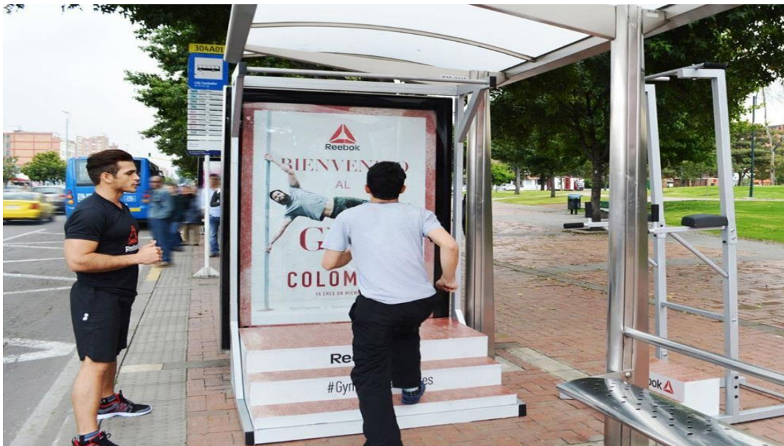
Slika 7. Primjer gerila marketinga na autobusnoj stanici