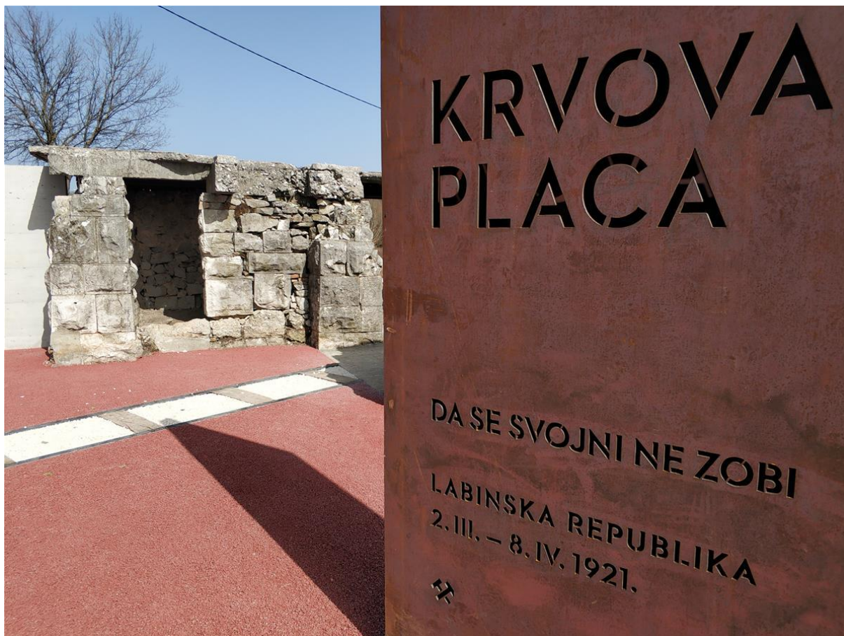
Slika 8. Krvova placa u Vinežu