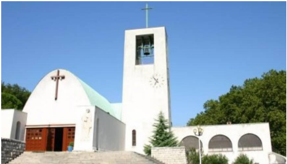
Slika 9. Crkva sv. Barbare u Raši

Kiparstvo je također značajno. Reljef sv. Barbare, izrađen 1937., na desnom ulaznom pilonu crkve, djelo je tršćanskog kipara Uga Carà. Ovaj reljef slijedi novecentistički stil "povratka redu", s naglašenim melankoličnim i metafizičkim izrazom. Ova skulptura jasno odražava utjecaj De Chirica, slika praznine glavnog trga Raše, gdje se crkva sv. Barbare besprijeckorno uklapa ( https://www.istrapedia.hr/hr/natuknice/2236/crkva-sv-barbare-u-rasi , 20. kolovoza 2023.).