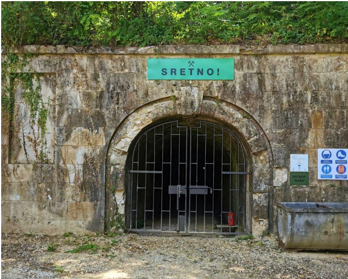
Slika 4. Pozdrav "Sretno!" nad raškim ulazom u rudnik (Izvor: https://www.rasa.hr/rasani-ispunjeni-emocijama-nakon-prvog-obilaska-preuređenog-rudnika/ , 20. kolovoza 2023. )

U okruženju gdje su rizici i neizvjesnost svakodnevni pratitelji, "sretno" nije samo formalnost, već izraz iskrene brige za kolege rudare. To je izraz empatije i podrške koji odražava svijest o potencijalnim opasnostima i težini posla. Rudari su se suočavali s mračnim, teškim uvjetima pod zemljom, neizvjesnošću hoće li se sigurno vratiti svojim obiteljima i svakodnevnim strahovima od nesreća. "Sretno" je postalo njihov način da se međusobno podsjeti na zajedničku sudbinu i potrebu za uzajamnom podrškom. Pozdrav "sretno" ima svojstvo povezivanja generacija rudara i prenošenja kulturne baštine. Kroz povijest, rudari su ga prenosili s koljena na koljeno, čineći ga neprocjenjivim dijelom rudarske folklore. Ovaj pozdrav se ne može shvatiti samo kao riječ, već kao duboko ukorijenjen ritual koji prenosi vrijednosti hrabrosti, uzajamnosti i zajedništva (Freese, 2004., str. 53.).