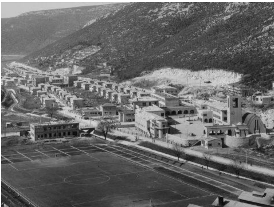
Slika 2. Raša, 1937.