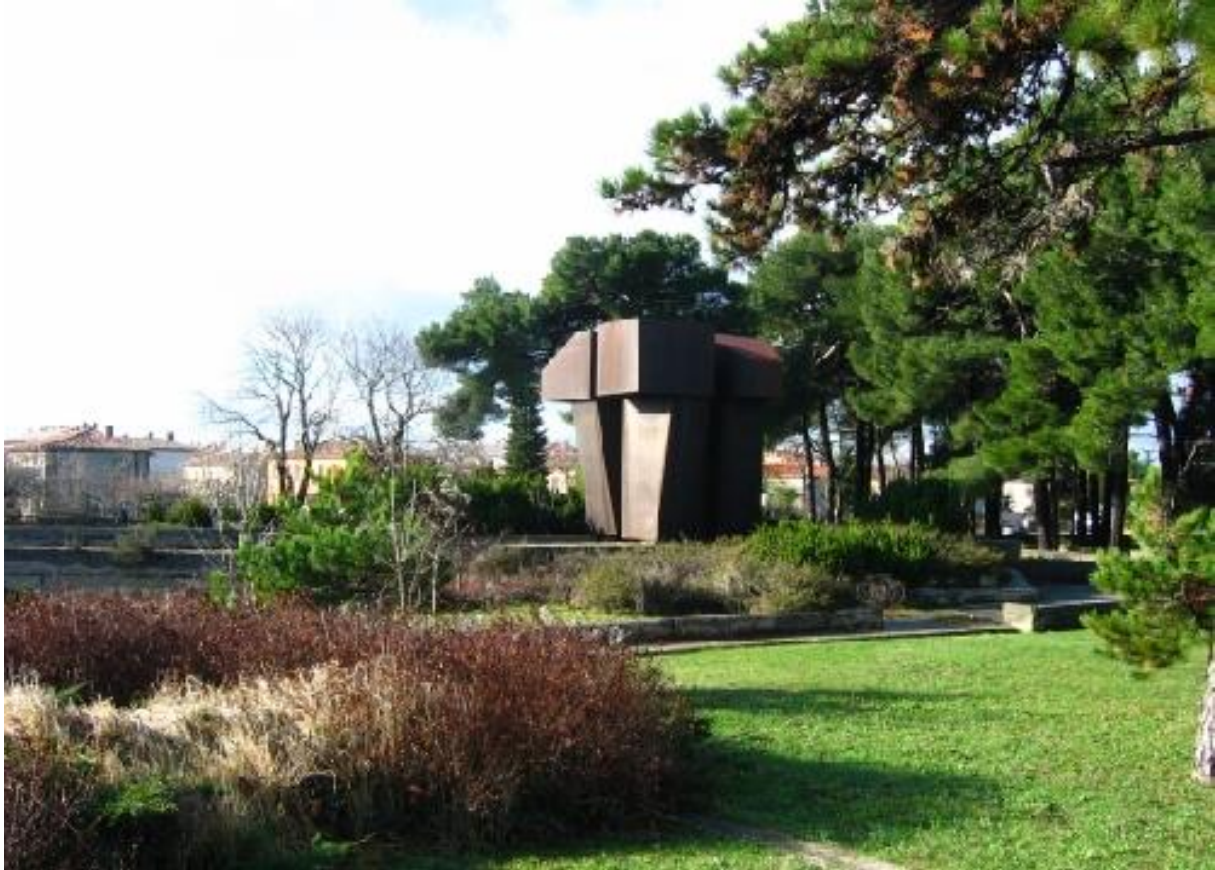
Slika 6. Spomenik rudaru - borcu

( http://www.labin.hr/kompleks-spomenika-rudaru-borcu-dovrsiti-ce-se-fazno-u-cetiri-godine , 27. kolovoza, 2023.).