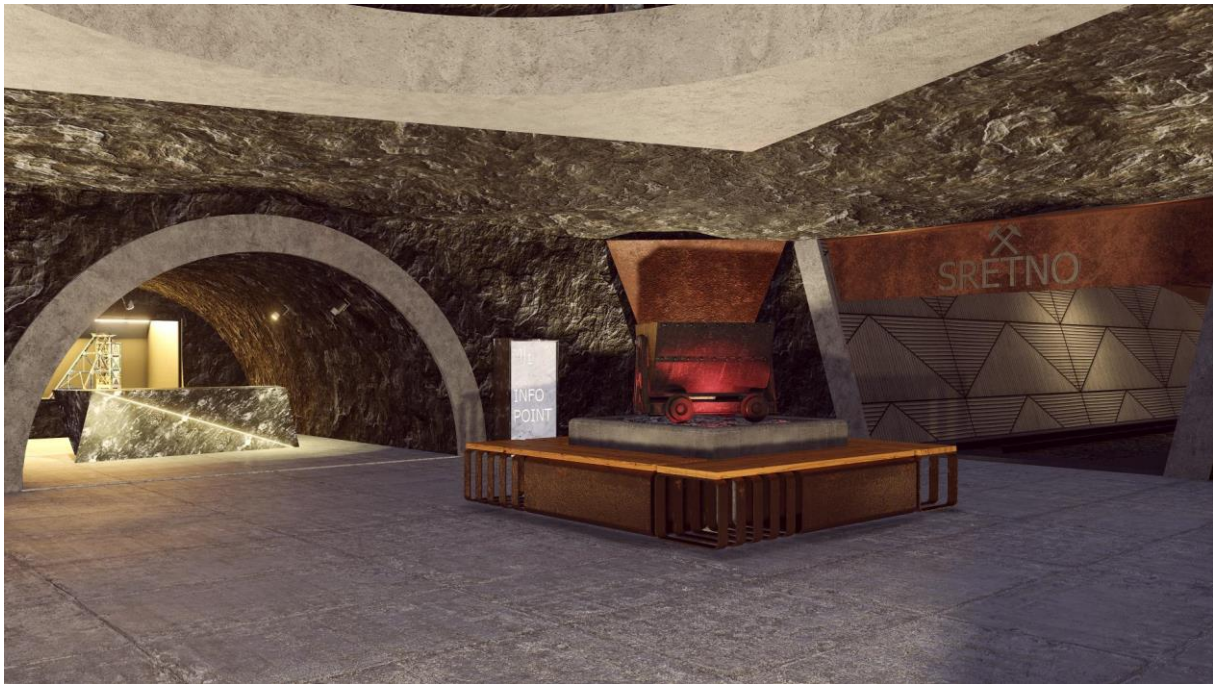
Slika 10. Simulacija Podzemnoga grada XXI

Koristeći europske fondove, konačno bi mogla postati stvarnost ideja koja se u Labinu razvijala od sredine 1990-ih. Zamisao o podzemnom gradu prvi put je uzeta u obzir 1996., kada je donesena odluka i proglašeno kulturno dobro rudarske zone Pijacal. Ovdje se nalaze lamparna, nekadašnje upravno sjedište rudnika, prostrane rudarske kupaonice, kemijski laboratorij i izvozni toranj - poznat kao "šoht" s "toplom vezom". Glavni podzemni i nadzemni dijelovi bivšeg rudnika prostiru se na području Labinštine, posebice grada Labina i općine Raše. Rudarski tuneli protežu se prema Rapcu, Plominu i Vinežu, a s najstarijim ukopom "Franz" zanimljivost leži u tome što se podzemni tunel prema Rapcu završava na plaži Maslinica, gdje je planirana izgradnja žičare prema starom gradu Labinu, slično kao što je u prošlosti postojala žičara iz Rapca koja je prevozila boksit.