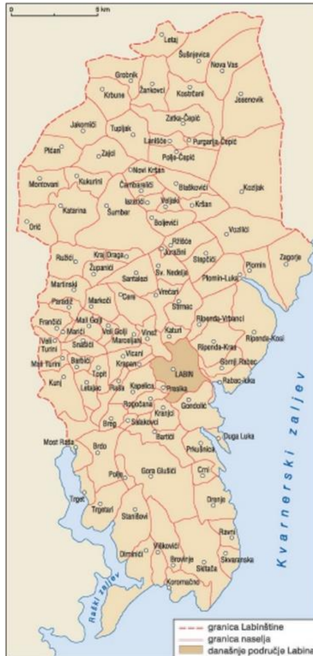
Slika 1. Područje Labinštine

Kombinacija svih ovih topografskih karakteristika čini Labinštinu jedinstvenom regijom s bogatstvom krajolika i različitih mogućnosti za razne aktivnosti i životne stilove.