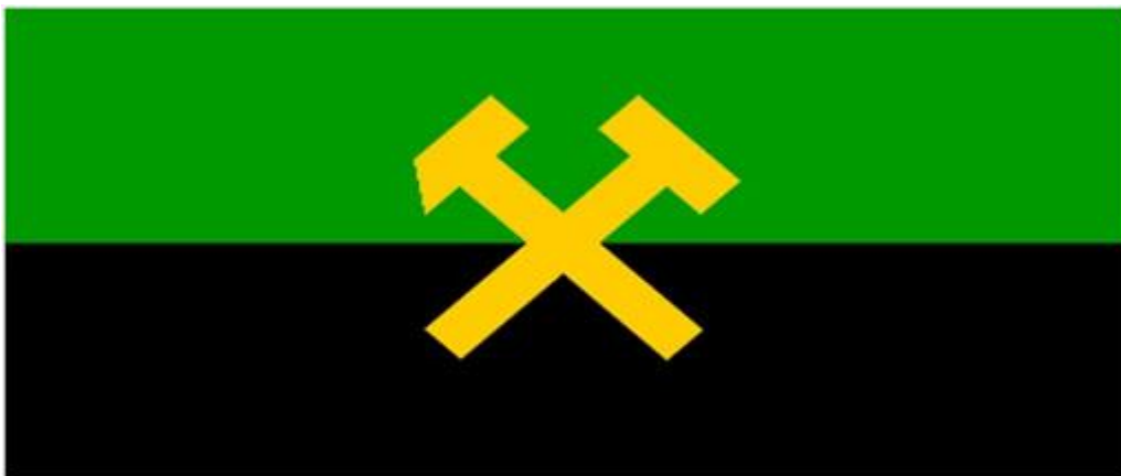
Slika 5. Rudarska zastava

Rudarska zastava, simbol bogate povijesti i nasljeđa rudarstva, nosi sa sobom duboko ukorijenjenu simboliku. Ova zastava, često nositelj različitih oblika rudarskog identiteta, postala je ikona koja povezuje radnike širom svijeta koji se bave vađenjem vrijednih resursa iz zemljine dubine.