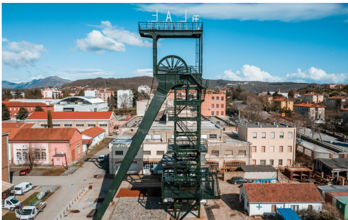
Slika 7. Labinski šoht

Šoht, visoki čelični toranj koji je tijekom vremena postao simbol Labina i njegovih stanovnika, započeo je svoju funkciju 1940., istovremeno s pokretanjem proizvodnje u Jami Labin. Na vrhu šohta nalazila su se dva velika kotača koji su se usklađeno okretali - jedan prema naprijed, a drugi unatrag - kako bi podizali i spuštali kabine dizala. Kabine su imale tri razine i prevozile su rudare (po 16 na svakoj razini), vagonete pune ili prazne te različite materijale. Kroz godine rada, šoht je postao prepoznatljiv i neizostavan dio labinske priče. Nakon završetka rudarskih aktivnosti u Labinu, šoht je zaustavio svoje kotače i počelo je dugotrajno razdoblje propadanja ovog najprepoznatljivijeg simbola grada ( https://www.istra.hr/hr/destinacije/labin/dozivate/mine-tour-soht-celicni-labinski-toranj , 29. kolovoza 2023.).