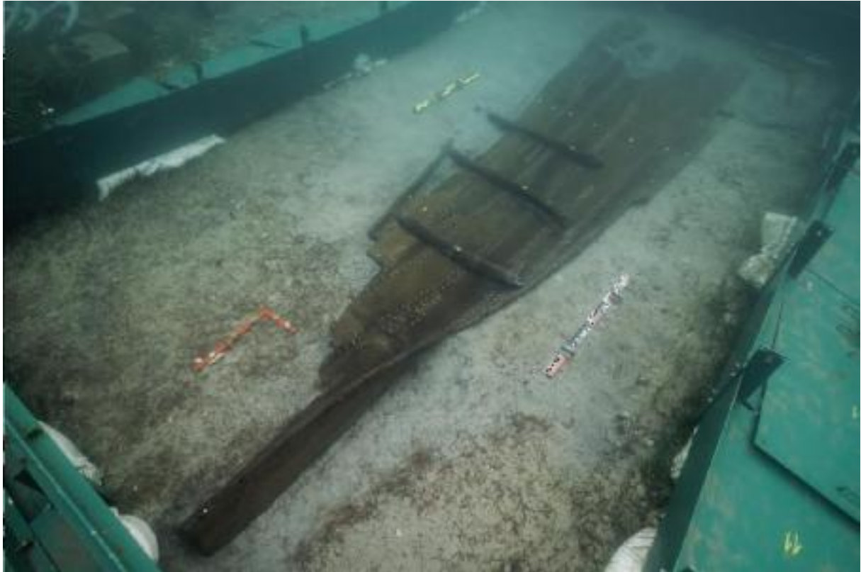
Slika 2: Šivani brod Zambratija, preuzeto iz Koncani Uhač, I., Uhač, M., Boetto, G., 2019, Zambratija - Prapovijesni šivani brod - Rezultati arheološkog istraživanja, analiza i studija, Pula.

Jedan komad trupca od brijesta, čiji je promjer veći od 40 cm, korišten je za izradu osnovog elementa broda. Na glavnom rebru, trupac je plosnat s debljinom od 3 cm, dok se prema sjevernom kraju broda debljina povećava i doseže 21-23 cm. Širina se također postupno mijenja, od 39 cm na glavnom rebru do 6 cm na sjevernom kraju broda. Ovo ukazuje na to da je sjeverni kraj, odnosno pramac broda imao ulogu kobilice. Na oplati su sačuvana dva voja na zapadnoj strani i pet vojeva na istočnoj strani broda. Debljina platica je prosječno 2,8 cm, a njihova širina varira od 13,5 do 24,6 cm. Svi ovi dijelovi su izrađeni od drva brijesta. Druga i treća platica imaju zakošeni dio na sjevernom kraju, što omogućuje odgovarajuću zakrivljenost forme broda. Četvrti voj se sastoji od dvije platice spojene kosim spojem. Peti voj, odnosno završni voj broda, je L-profila i okrenut je prema unutrašnjosti trupa. Debljina ovog obrađenog debla varira od 3 do 4,3 cm. Također, na gornjoj strani postoje dva, možda i tri, pravokutna utora čija funkcija još nije poznata.