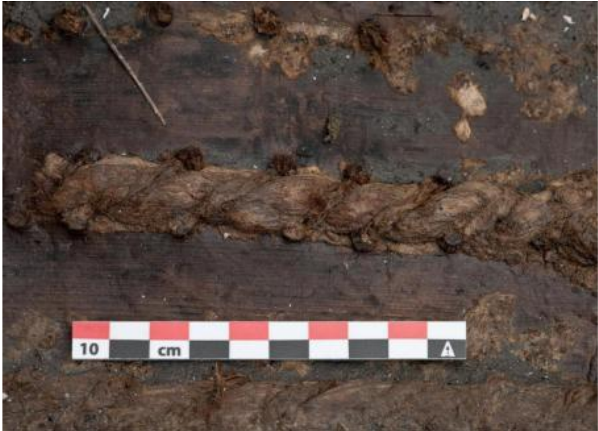
Slika 5: Pula 2: detalj spajanja šivanjem, sliku ustupila I. Koncani Uhač

Konstrukcije 30 . Dno kobilice je bilo pronađeno in situ na dubini od 2,20 metara ispod današnje razine mora. Kobilica je izrađena je od hrastovine. Njezine dimenzije su 10 x 10 centimetara. Od broskog trupa je pronađeno 14 rebara dimenzija 5 x 5 centimetara i 13 platica. Poput brodova građenih tehnikom šivanja iz Caske i Zatona, ovaj je brod bio građen jednostavnom tehnikom paralelnog šivanja. Rebra broda Pula 2 su za oplatu bila pričvršćena drvenim klinovima dok je na nekim mjestima utvrđeno korištenje i brončanih čavala 31 .