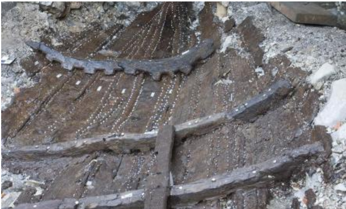
Slika 3: Poreč 1: Pogled na krmeni kraj s istoka, preuzeto iz Boetto et.al. , 2023

Brod koji je izvorno bio dug oko 7 m, pokretao se pomoću jedra i vesala, a koristio se za obalni prijevoz robe, ljudi i životinja 29 .