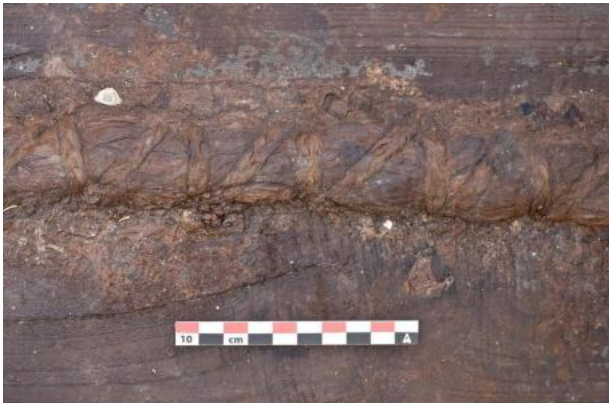
Slika 4: Pula 1: detalj spajanja šivanjem

Brod nazvan Pula 1 istražen je u dužini od 8,1 m i širini od 4,1 m. Dno se njegove kobilice se nalazilo na dubini od 2,30 metra ispod današnje razine mora. Od brodske konstrukcije su sačuvani kobilica broda dimenzija 20 x 20 centimetara, 14 rebara dimenzija 10 x 10 centimetara te 11 platica brodske oplata. Oplata broda je bila spajana Z tipom šivanja dok su pojedina rebra bila reutilizirana s drugih, moguće ranijih brodova zbog čega je na trupu bilo usađeno više klinova kojima su bili spajani za oplatu. Razmak između rebara iznosio je između 30 i 35 centimetara, a na nekoliko su rebara vidljivi tragovi utora koji su mogli služiti za polaganje temeljnice jarbola.