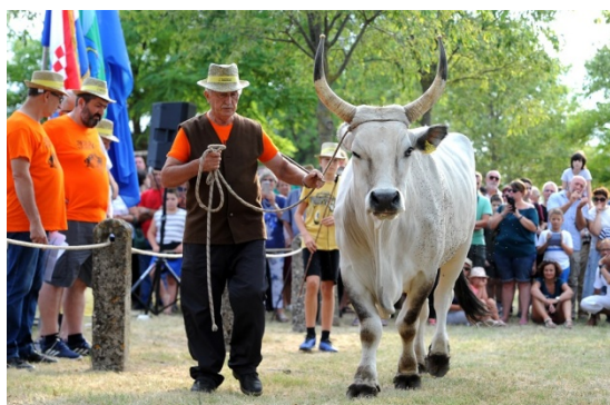
Slika 9. Izložba boškarina

Program započinje u petak kada se održava etno večer, a onda se nastavlja u subotu koja je rezervirana za biciklijadu, te misa u čast svetoga Jakovlja te sajam lokalnih proizvoda, nakon čega je u popodnevnim satima svečano otvorenje smotre istarskih volova.