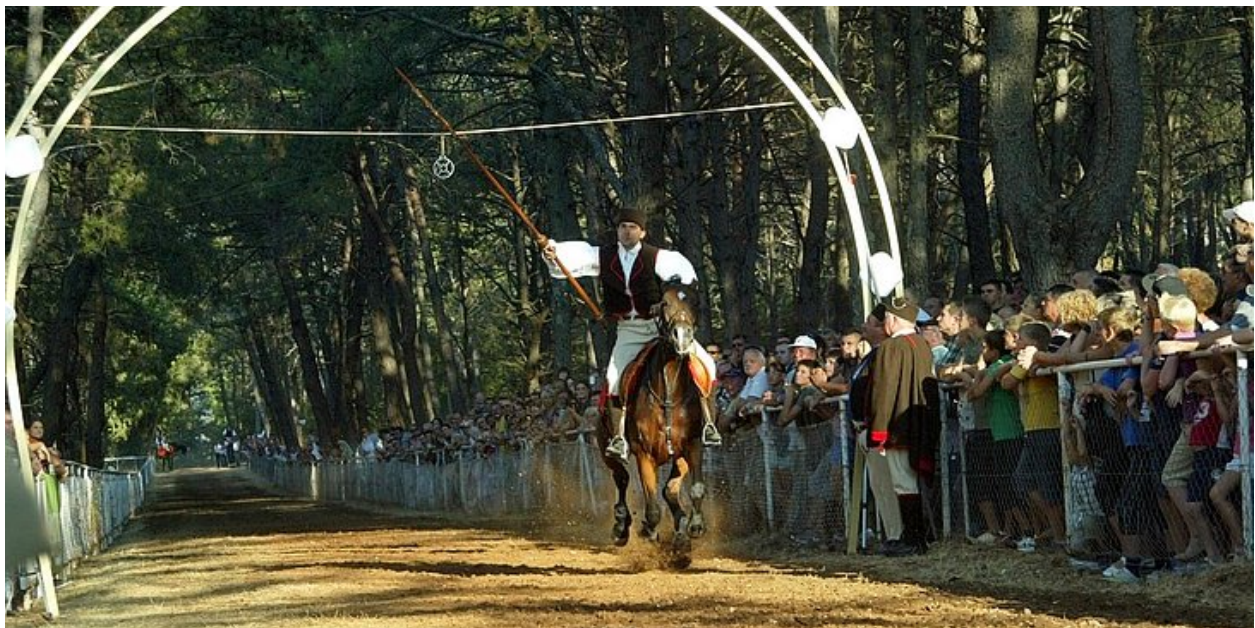
Slika 6. Trk na prstenac