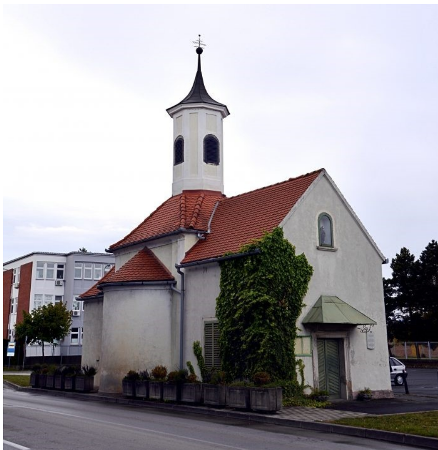
Slika 4: Kapelica sv. Roka u Varaždinu

Tamo je i danas na njezinu pročelju smještena skulptura Svetog Roka koja je do 1962. bila na unutarnjem oltaru ( https://povcast.ffzg.unizg.hr/varazdin-rekorder-izgradnji-protukuznih-i-protupoarnih-zavjetnih-crkava , pristupljeno 11. kolovoza 2023).