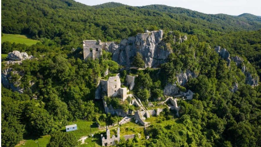
Slika 5: Stari grad Veliki Kalnik