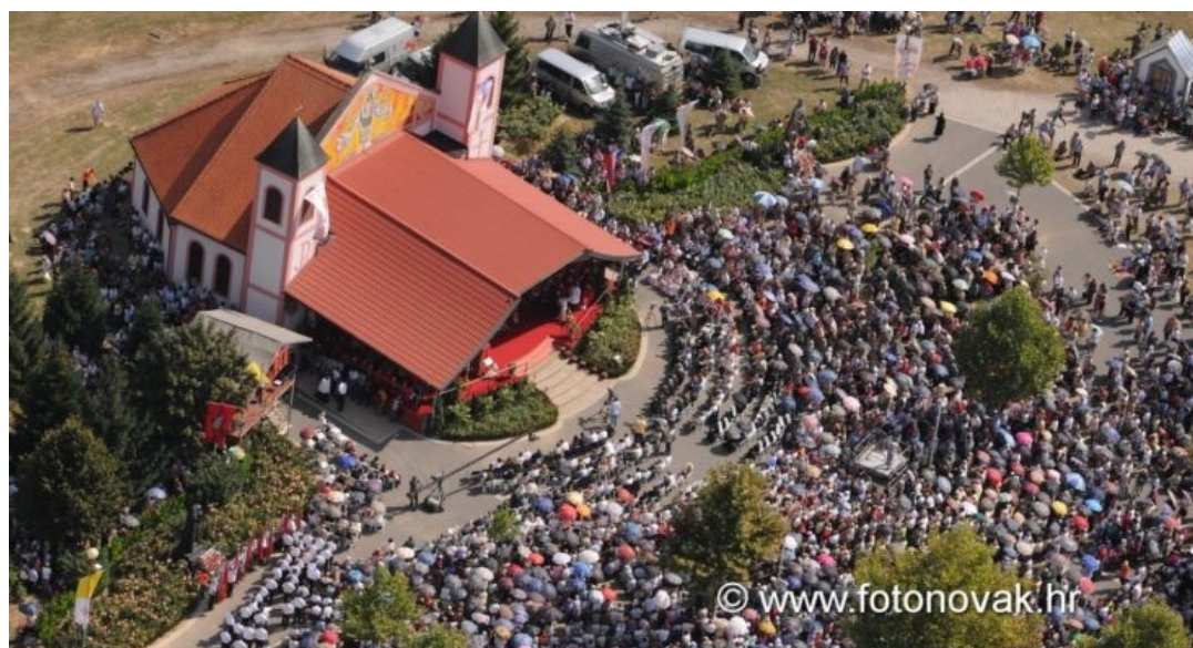
Slika 11: Hodočasnici u ludbreškom svetištu na svetoj misi

Također, u svetištu Predragocjene Krvi Kristove u Ludbregu svake se prve nedjelje u rujnu svečano obilježava Sveta Nedjelja, nedjelja Predragocjene Krvi Kristove. Tada hodočasnici iz cijele Hrvatske i drugih zemalja dolaze u Ludbreg, prisjećajući se legende kad se vino u kaležu pretvorilo u pravu Kristovu krv, klanjaju se sačuvanoj relikviji. Tradicija hodočašćenja u svetište potječe još iz 16. stoljeća. Ne samo tog dana, nego i cijelog tjedna prije Svete Nedjelje, u Ludbregu je organiziran bogat program: hodočašća vjernika iz susjednih župa, hodočašća vatrogasaca, vojske i policije, svečana bogoslužja koja predvode hrvatski biskupi, razni festivali, sajmovi, koncerti, radionice, izložbe, sportska natjecanja itd. Ludbreška je Sveta Nedjelja jedno od najvećih i najveselijih proštenja u Hrvatskoj. To omogućuje da poznata legenda i danas živi i širi se ( https://www.sjeverni.info/od-25-kolovoza-do-3-rujna-najvece-i-najveselije-prostenjedani-ludbreske-svete-nedjelje , pristupljeno 28. kolovoza 2023.).