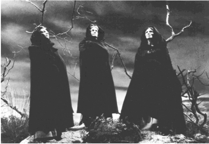
Slika 10: Copernice

rekla: „Ne smeš, dok si živ, nikome o meni ništa ispričati.” I onda je na svojoj smrtnoj postelji rekel: „To je bila moja žena.” I ona je bila u toj partiji.