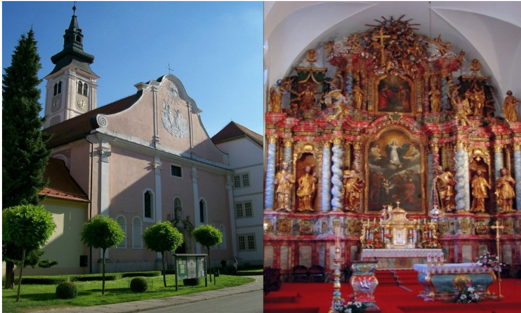
Slika 2: Današnja katedrala kojoj je 1650. prijetio požar

Golubica je bdjela nad crkvom sve do jutra, dok nije počelo svitati. Kad je zaštitila crkvu od požara, vinula se uvis i nestala. Tim je čudom Sveta Marija obranila od ognja svoju kuću za duhovni napredak (Đurić, 2007.: 27.).