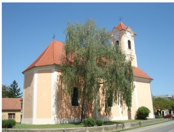
Slika 3: Crkva sv. Vida

„Varaždin bi vjerojatno doživio katastrofu da se nije dogodilo čudo. Naime, zvona crkve sv. Vida počela su zvoniti sama od sebe. Građani su se probudili i obranili. Da bi sačuvali grad od budućih ratnih nedaća i od osvajača, podignuli su na Vidovskom trgu kip sv. Ivana Krstitelja. Osim toga, na svako Ivanje prisjećali su se tog čuda zvonjavom zvona crkve sv. Vida” ( https://www.turizam-vzz.hr/istrazite/legende , pristupljeno 9. kolovoza 2023.).