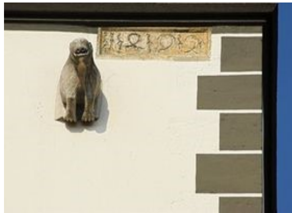
Slika 7: Medvjedica na crkvi sv. Nikole

„Nakon što je na tome mjestu sagrađena prva crkva, u nju je najprije ušla medvjedica tražeći svoj brlog i medvjediće. Kada je shvatila da njih više nema, okamenila se od tuge, što je graditelje jako pogodilo pa su je, takvu okamenjenu, ugradili u znameniti crkveni toranj kako bi vječno svjedočila o svojoj žalosti“ ( https://visitvarazdin.hr/sto-vidjeti/varazdinske-legende/ , pristupljeno 9. kolovoza 2023.).