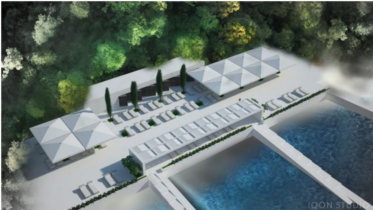
Slika 4. Vizualizacija plaža i partera sunčališta- KlinikeEnoch.