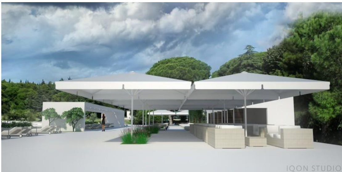
Slika 5. Novi prijedlog plaže kliničkog kompleksa „Enoch“