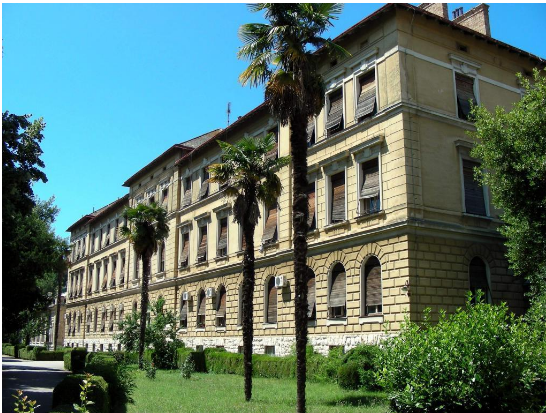
Slika 3. Paviljoni, dio bolnice Prim.dr.Martin Horvat

Reurbanizacija i zoniranje cijelog kompleksa bolnice, treba omogućiti adekvatne zone pristupa u pojedinim paviljonima duži tretman liječenja zone fizikalnih terapija u jedinstveni blok. Zone sporta i zone stanovanja većeg broja pratilaca u apartmanskom smještaju. Zone paviljona sa djelom za rekreaciju i šetnje, prenamjene prostora uza adaptacije i prilagođavanje danim zahtjevima. Veće i manje građanske zahvate i obrok te rekonstrukcije postojećih instalacija i inovacije medicinske opreme. Razvoj medicinskog i zdravstvenog turizma u Rovinju pozitivno bi se odrazio na otvaranje novih radnih mjesta te povećanjem kvalitete života stanovnika, a zaposlenicima Bolnice osiguralo bi se napredovanje edukacije i obrazovanje.