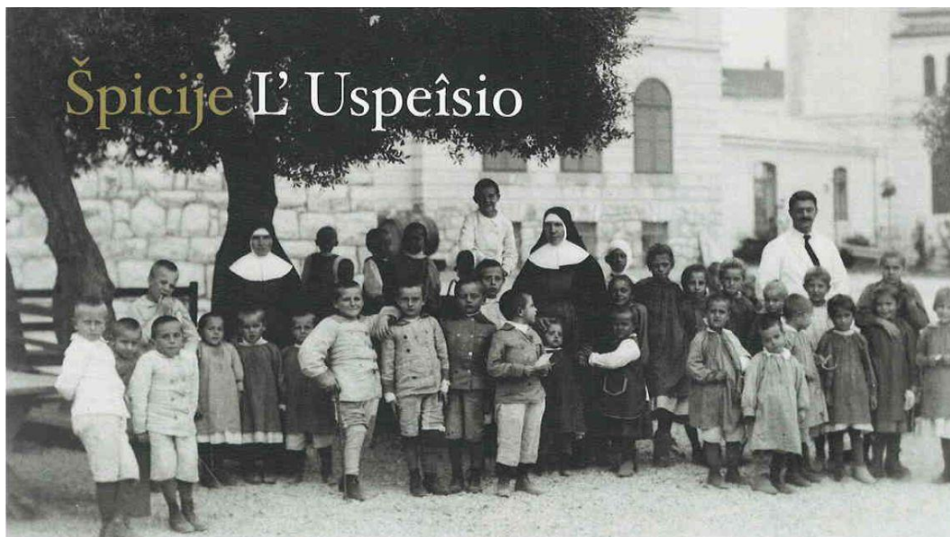
Slika 1. Špicije – morsko lječilište Nadvojvotkinja Marija Terezija .