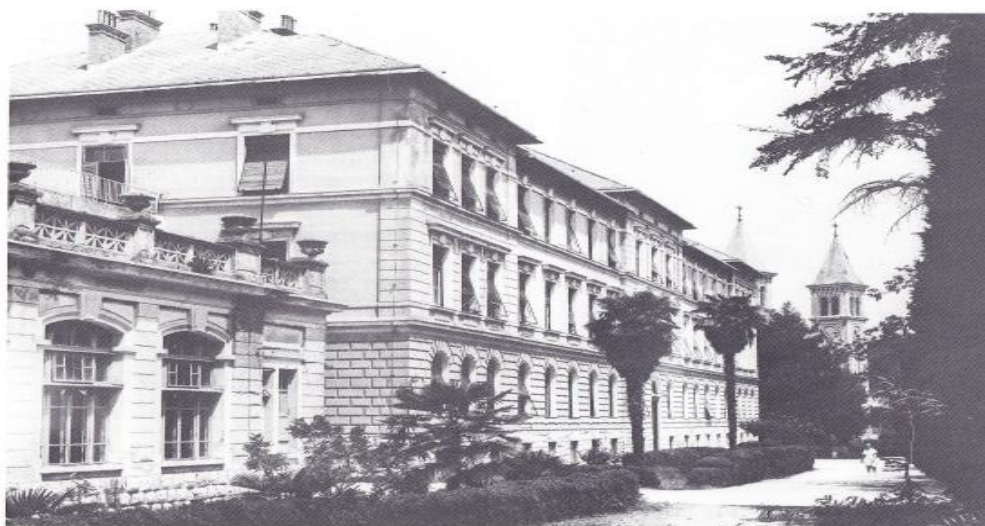
14. Paviljon b 15. IV odjel (III faza izgradnje 1936)