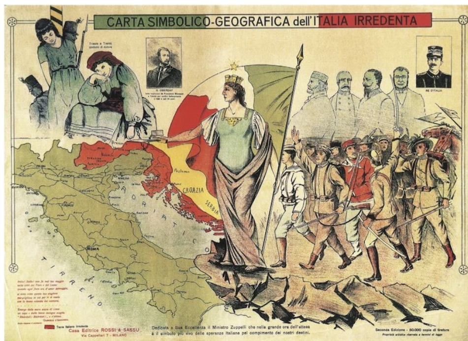
Slika 12: „Simboličko-zemljopisna karta neoslobođene Italije“