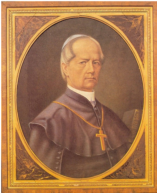
Slika 3: Biskup Juraj Dobrila

predložen za biskupa. 20 Cvjetko Rubetić u svom djelu „Vjekopis Dra Jurja Dobrile“ o tome piše: „Pitajući car pok. biskupa ljubljanskoga Wolfa: što misli, tko bi bio najvredniji i najsposobniji za biskupa u Poreču, odvrati Wolf, poznavajući u jednu ruku narod hrvatski u onoj biskupiji i njegove duševne potrebe a u drugu vrline Dobriline, kakvimi se ne mogaše iztaći nijedan drugi kandidat, iskreno i otvoreno kaže caru: „Veličanstvo! Dobrila je za tu biskupiju najvredniji i najsposobniji. Vriedno bo je, da onaj vjerni puk poslie stotina godina jednoć dobije biskupa, koji će sv. evangjelje propoviedati u njegovu materinskom jeziku.“ 21 Imenovan je za porečko – pulskog biskupa 12. listopada 1857. Svoju prvu biskupsku poslanicu je posvetio puku biskupije na hrvatskom jeziku kojeg tada većinski Hrvati u toj biskupiji nisu čuli stotinu godina i „govori on pravu rieč apostolsku svomu narodu tako jasno, da ga može razumjeti svaki istarski kmet; govori ono, što je svakomu kršćaninu najpotrebitije, govori kao čovjek iz puka, čije potrebe i jade on skrozim poznaje.” Dobrila dovodi biskupiju u red: Pregledava prihode i naplaćuje dugove od najma. 22