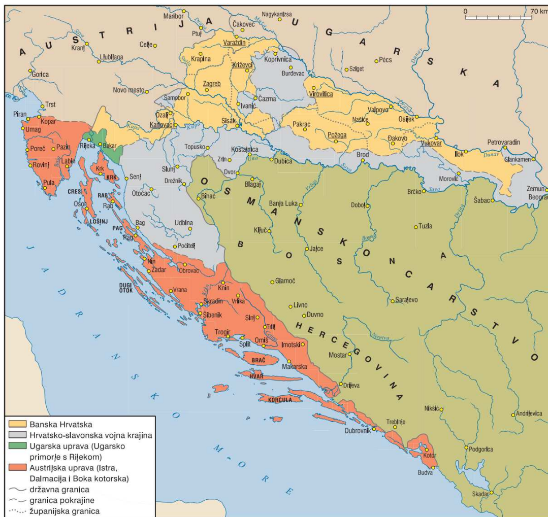
Slika 1: Karta hrvatskih zemalja početkom 19. stoljeća.

Izvor: Tomislav Markus, „Trojedna Kraljevina Hrvatska, Slavonija i Dalmacija od 1790. do 1918./ Osnovne smjernice političke povijesti,“ u Temelji moderne Hrvatske/ Hrvatske zemlje u “dugom” 19. stoljeću , ur. Vlasta Švooger, Jasna Turkalj, Zagreb: Matica hrvatska, 2016., str. 3