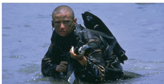
Slika 7. Jordan O'Neil, izvor Pinterest , preuzeto 23. kolovoz 2023.