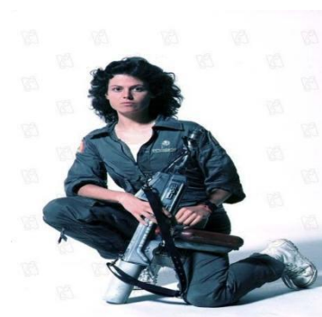
Slika 2, Ellen Ripley , izvor Le Blog de la Petite Val , preuzeto 15. kolovoz 2023.