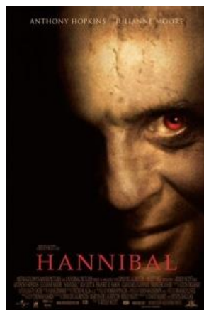
Slika 8, Hannibal , izvor IMDb, preuzeto 25. kolovoz 2023.

Možemo reći kako je Clarice nemirna i nervozna tijekom cijelog filma, ovo stanje možemo opravdati opaskom kako uvijek neki muškarac tajno nadgleda njezine korake. Unatoč tomu, žena je ovdje pokretač akcije i nije samo puki objekt požude koji se samo gleda. Ona rukuje oružjem, prati kriminalce i ubojice pa se ne ustručava taknuti prekidač niti ići za svojom opsesijom. Time se uzdiže od tradicionalno predstavljene žensklosti. Zadnji prizor filma prikazuje njegov bijeg dok je u avionu. Prikazana je intrigantna scena Lectera gdje sjedi pored malenog dječaka. Lecter želi ručati i otvara posudu s ručkom, a njoj se nalaze ljudski ostatci. Dječak pored njega traži da proba što jede. Ovaj mu daje i napomije da je uvijek dobro probati nove stvari.