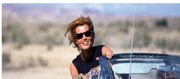
Slika 4, Thelma , izvor Wishful Thinking Fiction Fashion Film , preuzeto 21. kolovoza 2023.