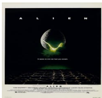
Slika 1, Alien , izvor Wikipedija, preuzeto 15. kolovoza 2023.