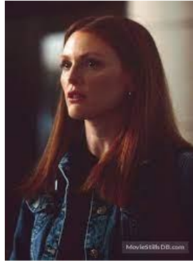
Slika 9, Julianne Moore kao Clarice Starling, izvor Pinterest, preuzeto 23. kolovoz 2023.