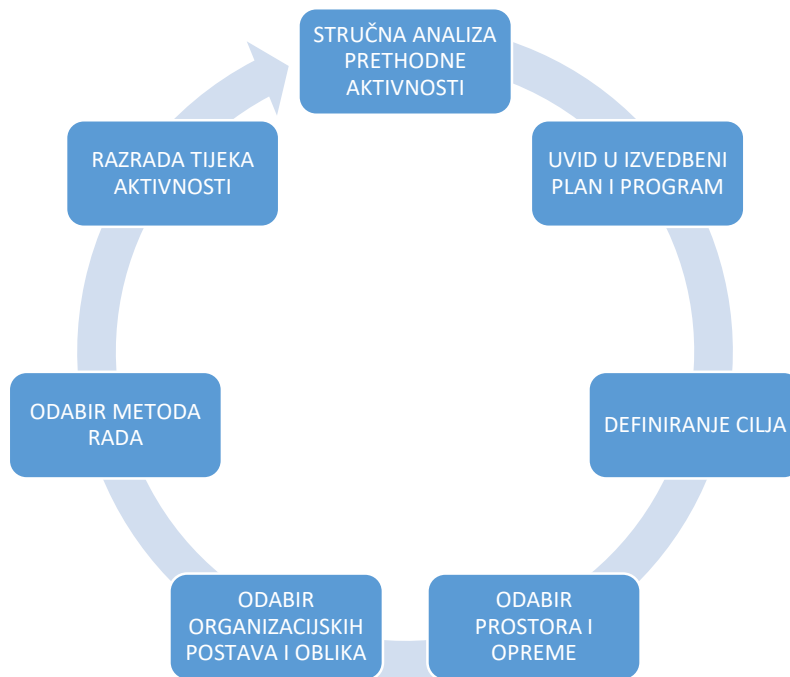
Prikaz 3. Postupci organizacijskog pripremanja odgojitelja za kineziološke aktivnosti (Petrić, 2019).

Slunjski (2003) navodi da kakvoća rada uvelike ovisi i o očekivanjima koja odgojitelj ima prema djeci, odnosno o onomu što on misli o djeci s kojom radi. Ta se slika o djetetu odražava na sve što odgojitelj za dijete ili s djetetom radi jer, na određen način, oblikuje sve njegove odgojne postupke. Ono što se ponekad može dogoditi kao posljedica određene slike o djetetu nešto je što se naziva samoispunjavajućim proročanstvom. Autor stoga upozorava: „ono je postalo nespretno jer smo mi tako o njemu razmišljali. Misleći nešto o djetetu, to smo od njega i učinili!“ (Slunjski, 2003:8).