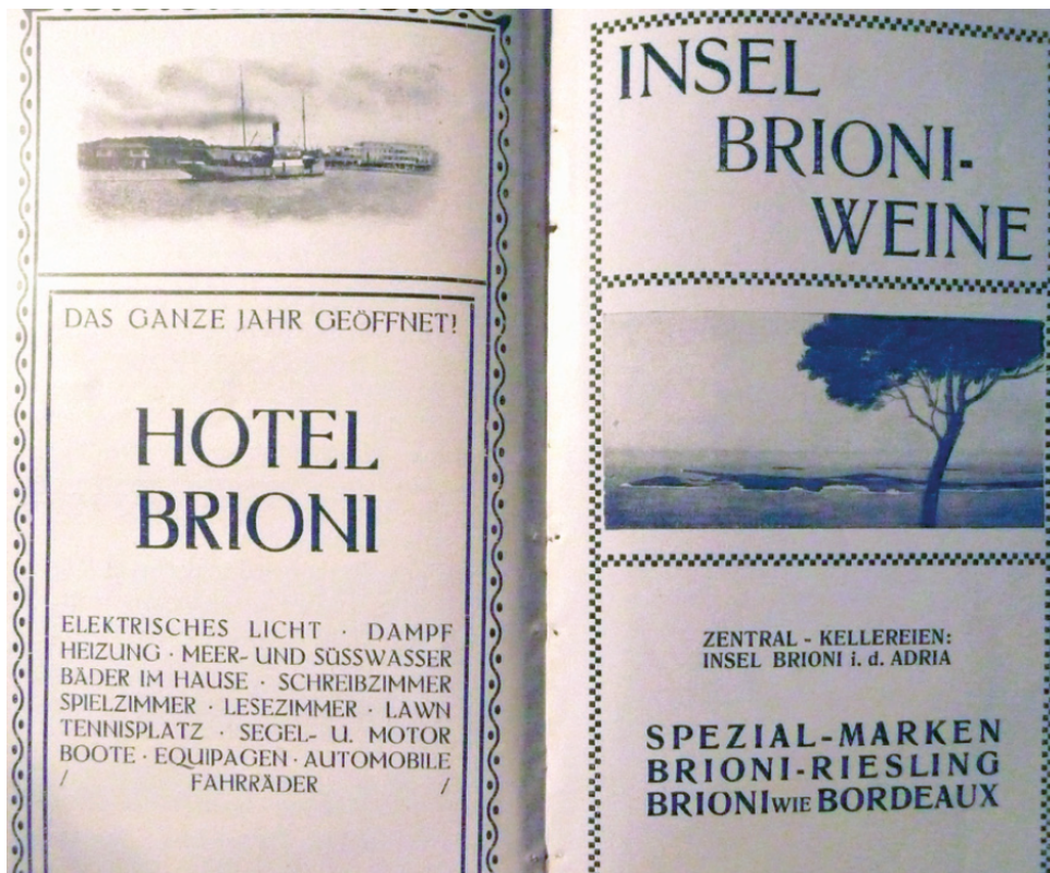
Slika 3. Prvi brijunski vodič

o turističkim dolascima: u razdoblju od 1904. do 1909. više od 50 posto gostiju dolazilo je iz Beča, 10 posto iz Graza, 30 posto iz ostalih dijelova Austrije, a preostalih 10 posto činili su strani gosti. Dok je 1904. i 1905. na otočju godišnje boravilo prosječno 5.000 osoba, nakon uvođenja parobrodске linije Pula - Brijuni 1906. (dotad se na otok stizalo preko Vodnjana i Fažane) bilježi se već 15.000 dolazaka. Unapređenjem prometne infrastrukture (parobrodskih veza, a posebice nakon uvođenja direktne željezničke veze iz Beča za Pulu) broj gostiju povećao se od 1907. do 1909. na čak 30.000 godišnje. Stoga budućnost leži u proširenju kapaciteta i daljnjem unapređenju prometne infrastrukture, razvoju zdravstvenog, kulturnog, ali i kongresnog turizma te korištenju blagodatne blage mediteranske klime, koja omogućava i dulje zimske i proljetne boravke. 4