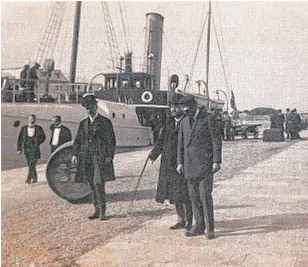
Slika 7. Robert Koch na Brijunima, 1901.