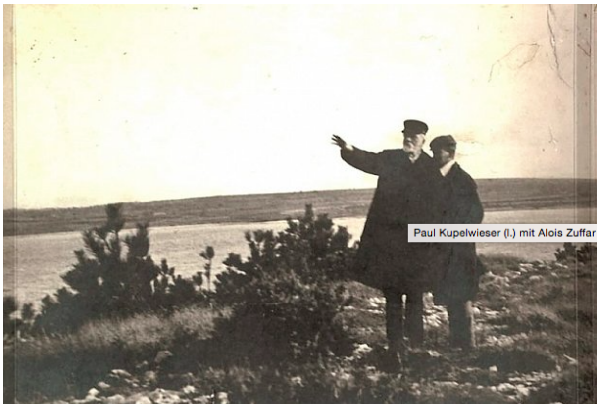
Slika 6. Paul Kupelwieser i Alojz Čufar, 1900.

rodom iz Labina, direktorom robe. Preporučan je kao šumarski stručnjak i „čovjek velike pristojnosti“ graditelju Kupelwieseru, a 1894. sa ženom i djecom preselio se na divlje otoke. Od prvog dana je neumorno i vjerno radio na realizaciji ideja svojeg poslodavca. Bio je šumar na Brijunima (zasadio je oko 10 000 stabala), geodet, majstor graditelj i inženjer cesta - sve u jednoj osobi. Nakon radikalnog čišćenja stvoreni su nježni šumski pejzaži, valjane livade, šetnice za svako godišnje doba i skroviti puteljci s egzotičnim biljkama. Prijevoz odabranih biljaka i sjemena (koje je Kupelwieser poslao iz Londona i Pariza na Brijune) izvršila je austrijska ratna mornarica. Bilo je potrebno stvoriti i plodnu zemlju za stočarstvo, obrađivanje polja, vinograde i voćnjake. Krhotine iz venecijanskih kamenoloma morale su se prevoziti tračnicama u preklopnim vagonima kako bi se osigurao novi teren za stambene i poljoprivredne zgrade, parkove i poljoprivredu. Neposredno prije početka stoljeća, gostima je bilo na raspolaganju prvih 14 soba. Ipak, malarija i slaba opskrba pitkom vodom bile su stalne prijetnje i prepreke turizmu otoka. 14