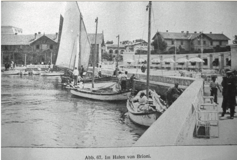
Slika 2. Brijunska luka