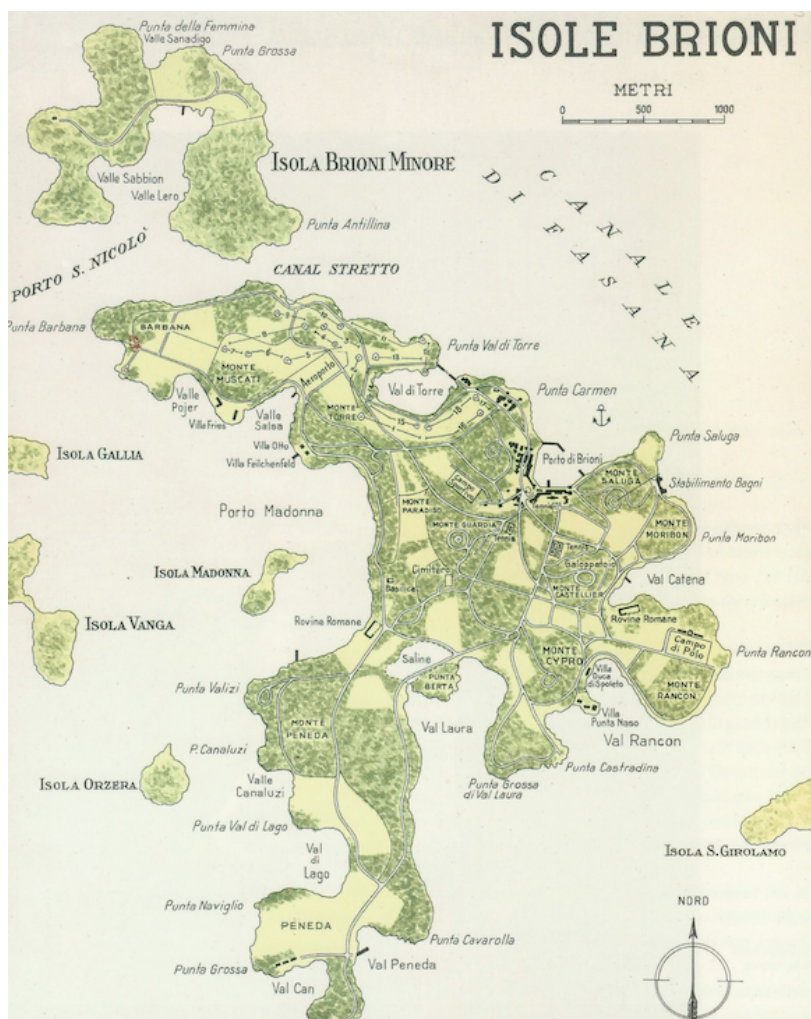
Slika 1. Karta Brijuna, 1934.