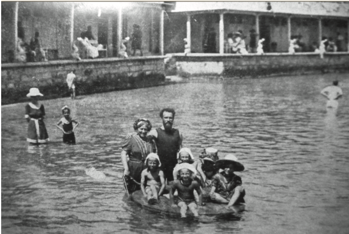
Slika 5. Kupalište Saluga