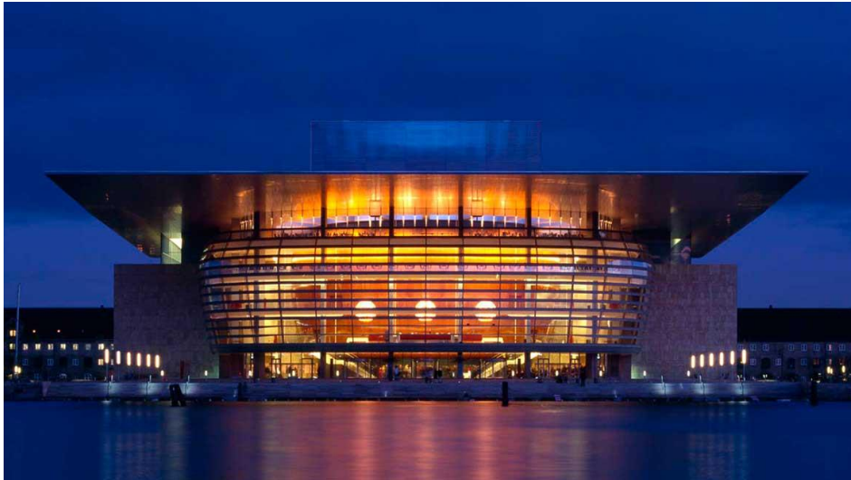
Slika 12. Kraljevsko kazalište – Opera