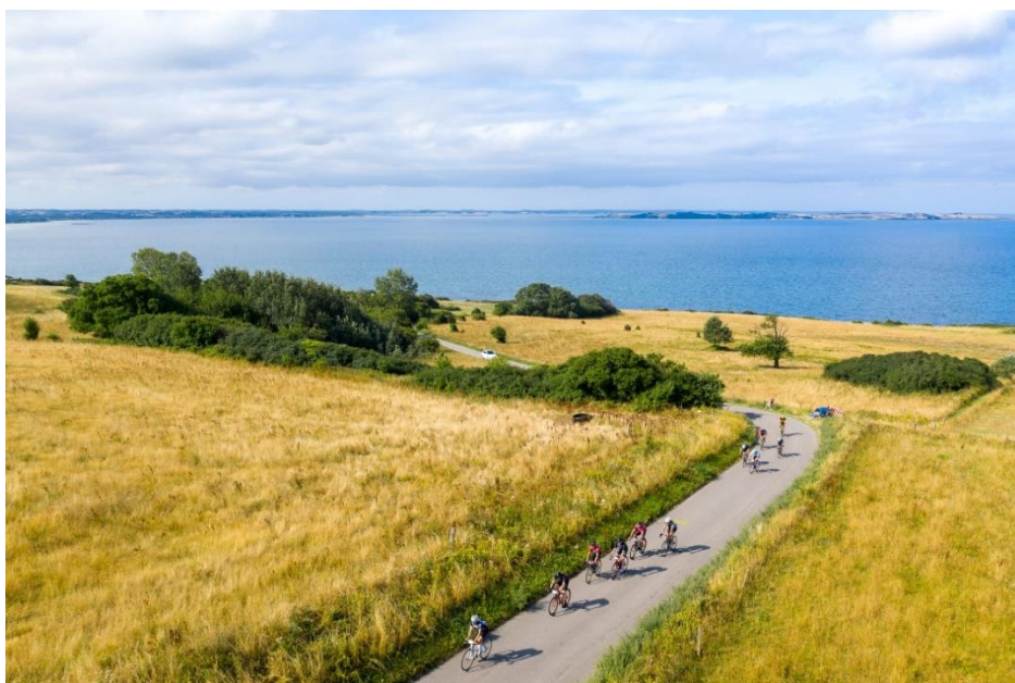
Slika 8. Geopark Odsherred