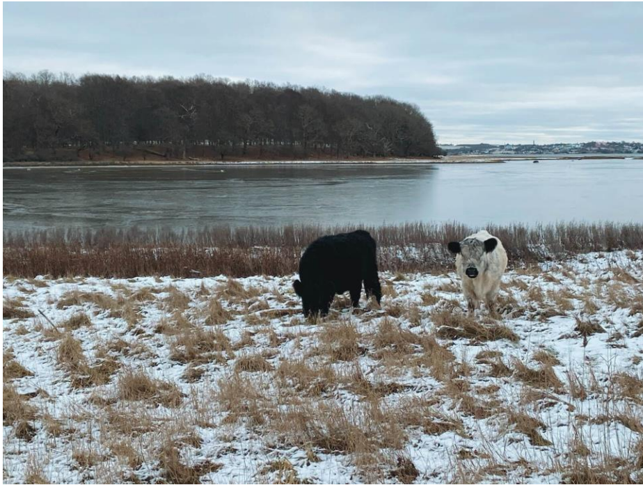
Slika 5. Nacionalni park Skjoldungernes Land