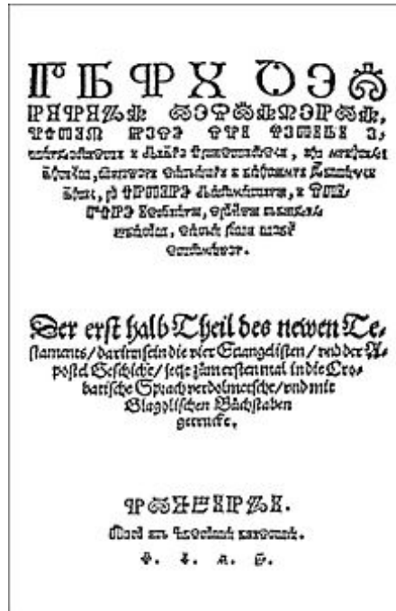
Slika 9. Prijevod Novog zavjeta na glagoljicu 1562.