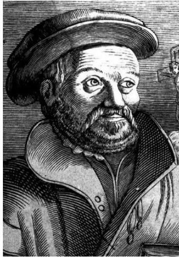
Slika 6: Antun Dalmatin

Živić iz Istre kojeg je pulski biskup imao veliku želju uhvatiti i osuditi. Radio je na ispravicima hrvatskih prijevoda. Na kraju je uhvaćen i spaljen. 33