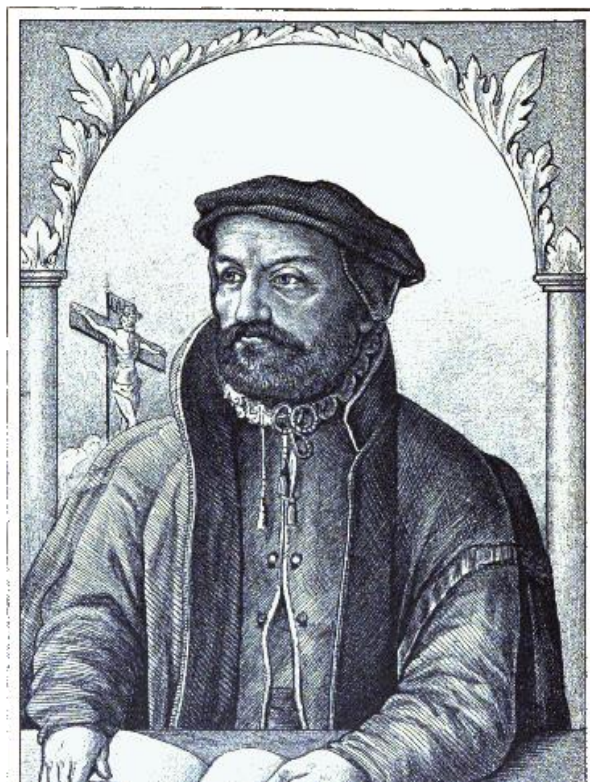
Slika 7: Stjepan Konzul Istranin