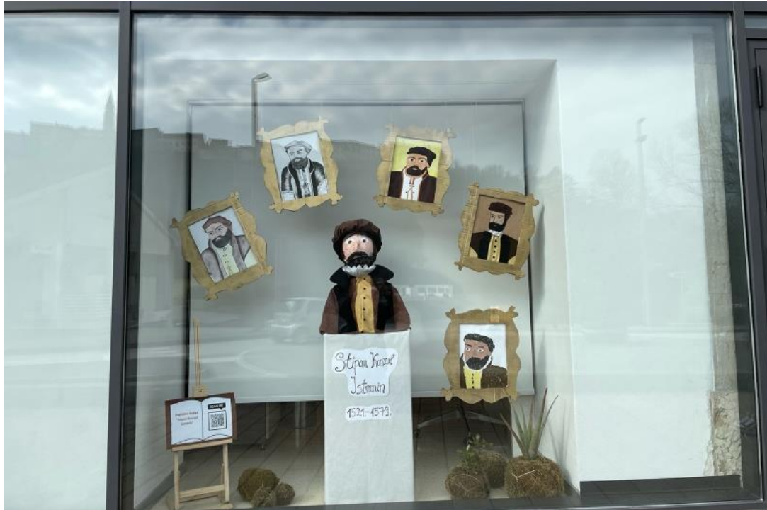
Slika 12. Izložba o Stjepanu Konzulu Istraninu u Gradskoj knjižnici u Buzetu