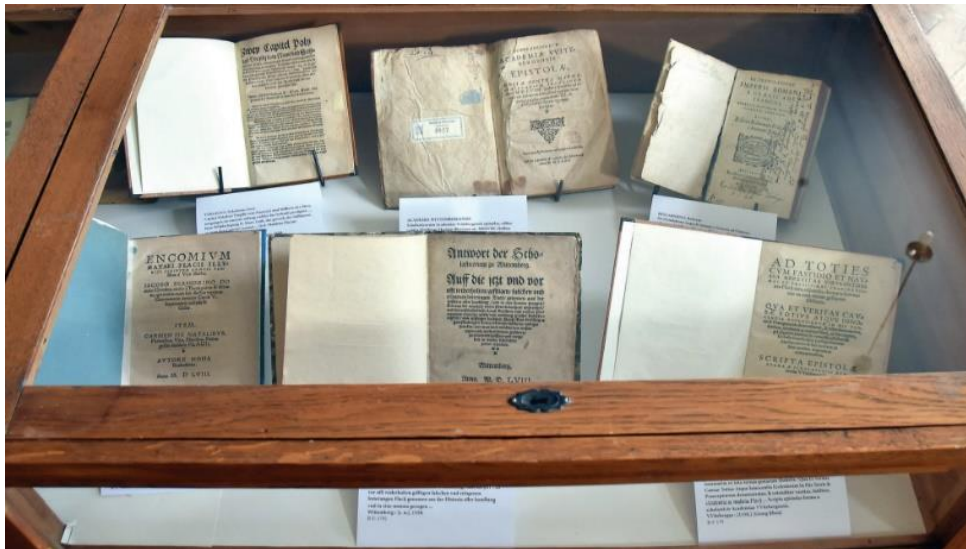
Slika 13. Izložba u Sveučilišnoj knjižnici Pula