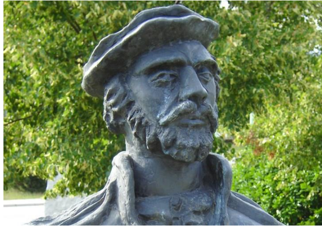
Slika 11. Spomen ploča Stjepana Konzula Istranina u Buzetu

stvaralaštvu govorili stručnjaci iz Njemačke i Italije, te predavači sa sveučilišta u Zagrebu, Rijeci, Puli i Zadru. Izrađen je plakat posvećen Konzulu koji su dobile sve škole u Istri te se Konzula uključilo u kurikulume zavičajne nastave u vrtiće, osnovne i srednje škole. Dodatni program organizacije obljetnice bila je i Mala glagoljska akademija „Juri Žakan“. 58