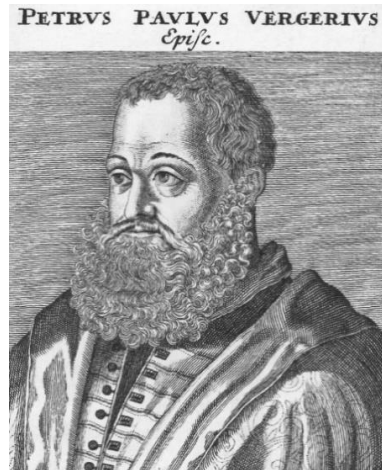
Slika 5: Petar Pavao Vergerije

narod: Katekizam i Abecedarij , te ih 1553.godine izdao. To su prve dvije knjige napisane na slovenskom jeziku. Kako bi približio reformaciju što više Slavenima, osmislio je da se stvori zajednički sveslavenski jezik. U Tübingenu umire 4. listopada 1565. godine. 31