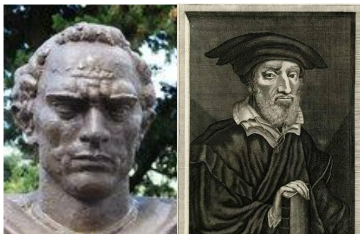
Slika 4. Baldo Lupetina i Matija Vlačić Ilirik