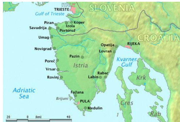
Slika 2: Karta Istre

protestantizma uistinu i prakticiraju vjeru, onakvu kakva je zapisana u Bibliji te naslijeđena od apostola. Najvažniji istarski reformatori bili su Baldo Lupetina, Matija Vlačić, Stjepan Konzul, braća Vergeriji te Matija Živić. Svaki od njih bio je „nagrađen“ progonstvom, a neki od njih su uhvaćeni i spaljeni. 17