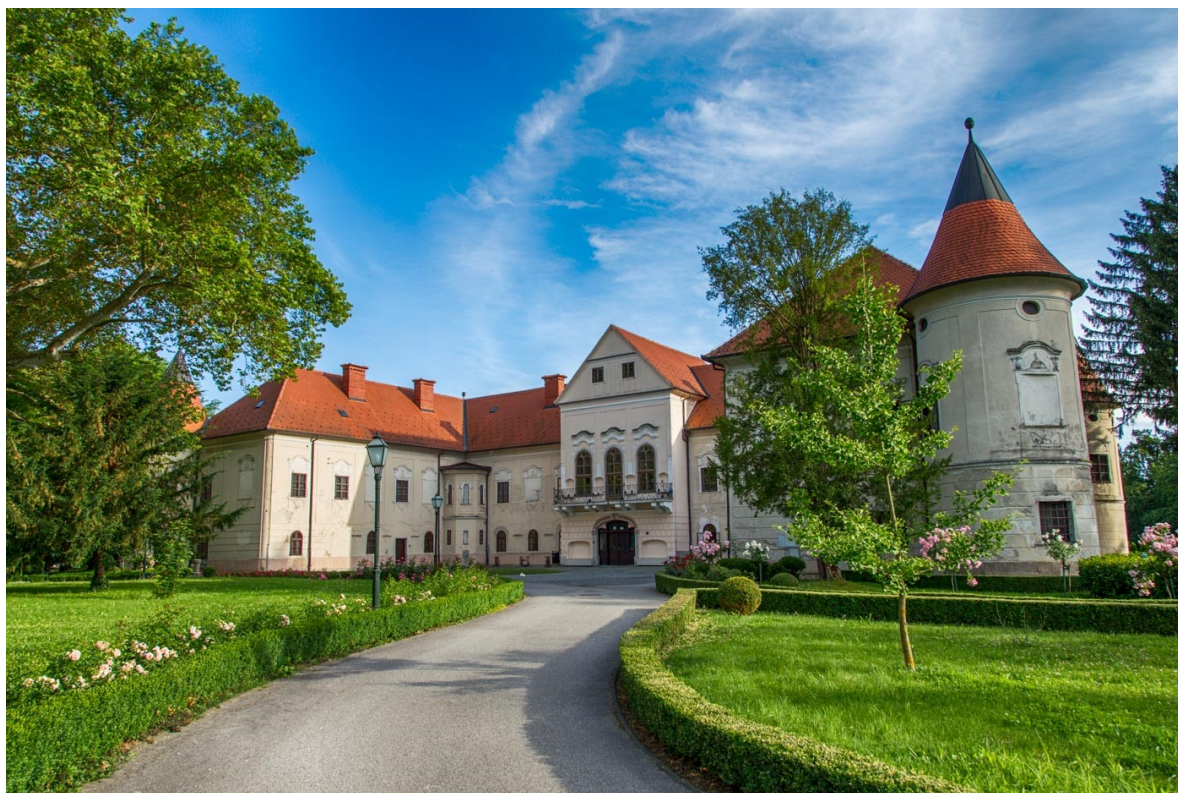
Slika 9. Dvorac Lužnica