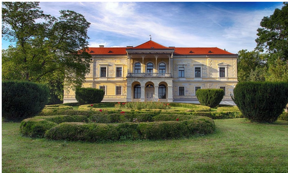
Slika 7. Dvorac Laduč