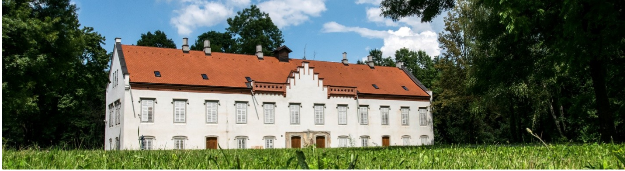
Slika 4. Novi dvori zaprešički – nakon obnove