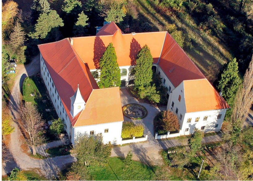
Slika 6. Dvorac Oršić u Gornjoj Bistri