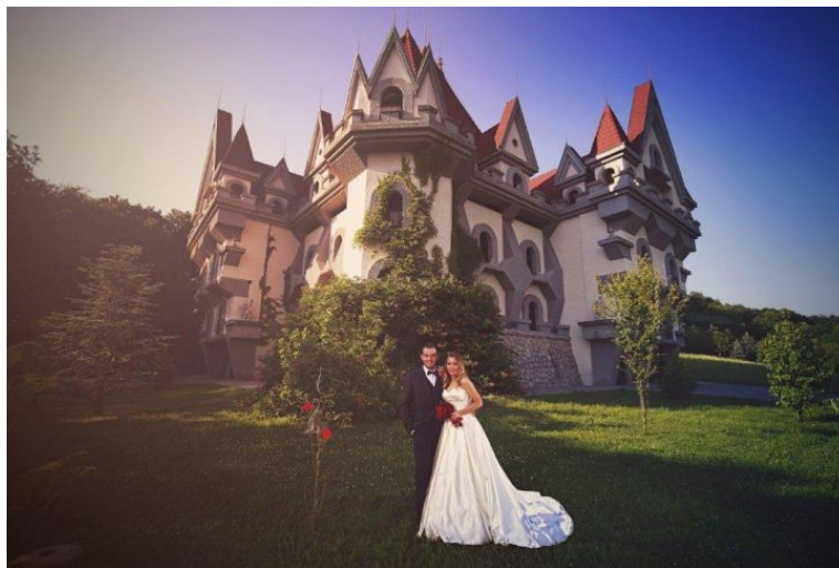
Slika 13. Dvorac Empirej

A dvorci u ovoj regiji ostat će zapušteni i bez budućih planova sve dok se ne usmjeri proces rješavanja dokumentacije za posjed dvorca, njegovu obnovu i prenamjenu te osmisle održivi i funkcionalni planovi, strategije i akcije, kako bi svaka investicija ostvarila i ispunila svoju svrhu valorizacije temeljito i u potpunosti.