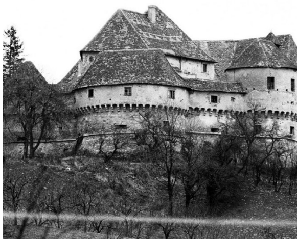
Slika 10. Veliki Tabor prije obnove

Obnova je bila izvršena u dvije faze. Prva faza trajala je od 2001. do jeseni 2007., a druga od kraja 2008. do kraja 2011., nakon čega je dvorac u potpunosti restauriran i rekonstruiran. 66 Danas se u dvorcu, osim muzejskih izložaba, održavaju i srednjovjekovne svečanosti, ali i brojne muzejske radionice.