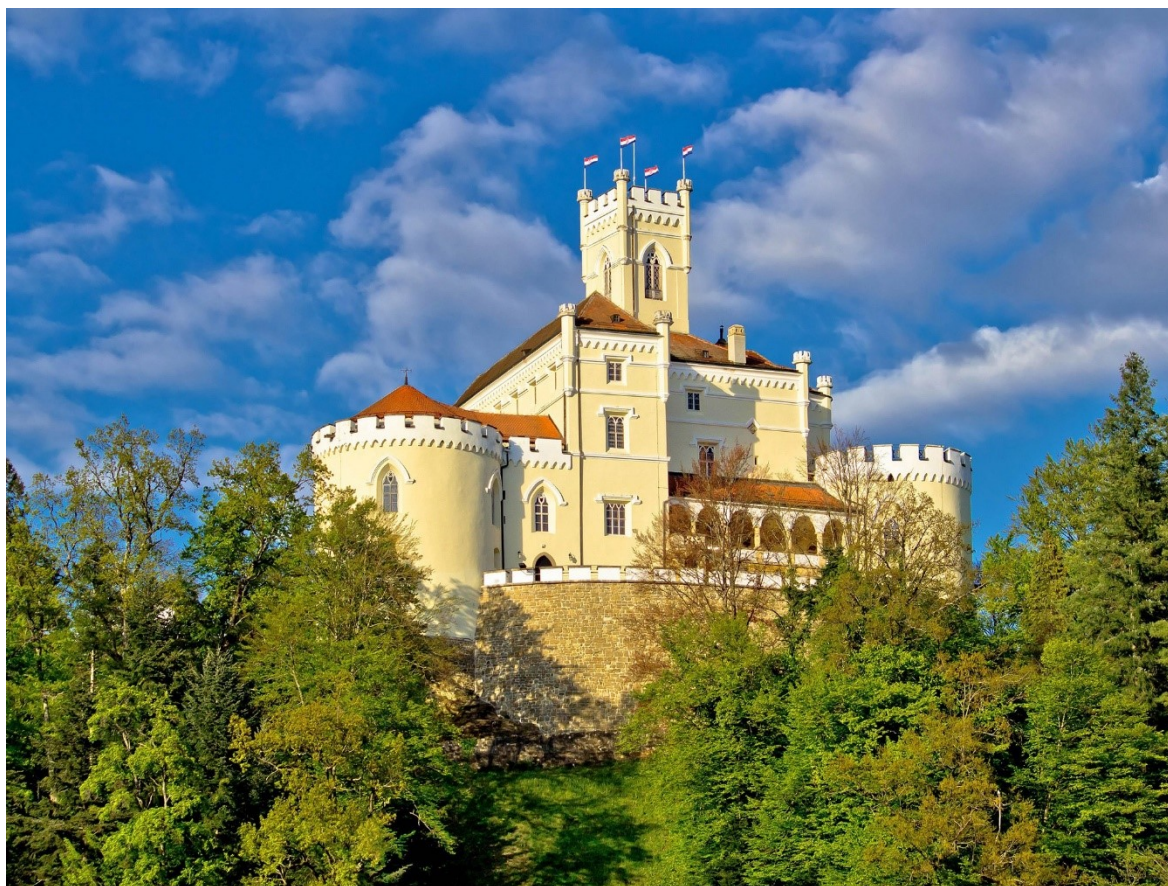
Slika 12. Dvorac Trakošćan