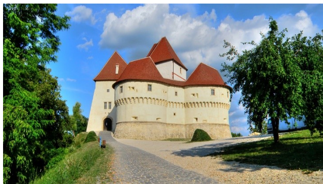
Slika 11. Veliki Tabor nakon obnove