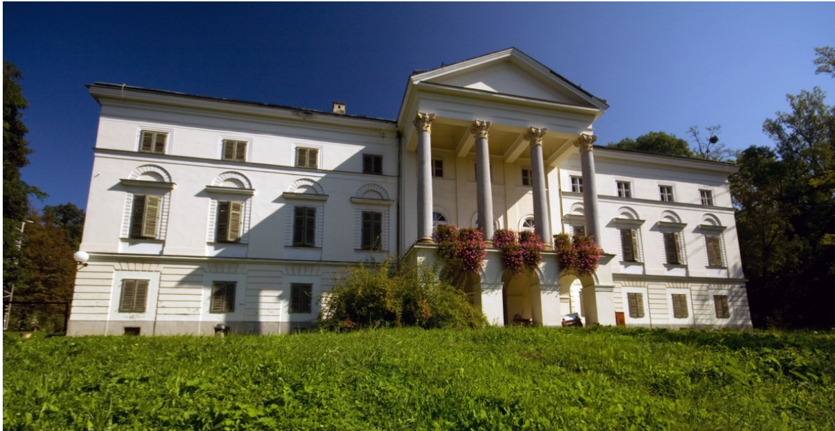
Slika 8. Dvorac Januševac

U obnovu dvorca utrošeno je gotovo 40 godina. Također, značajan je podatak i relevantna činjenica kako je u samom dvorcu bio smješten dio Državnog arhiva Hrvatske, što mu daje određeni povijesni značaj. 63 Iako spomenik nulte kategorije, dvorac danas nije otvoren za posjetitelje.