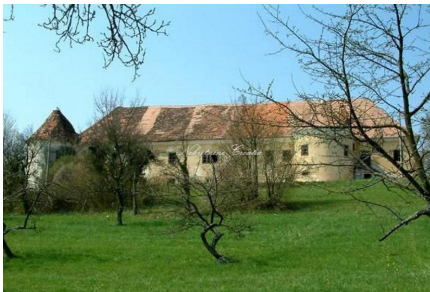
Slika 3. Mali Tabor