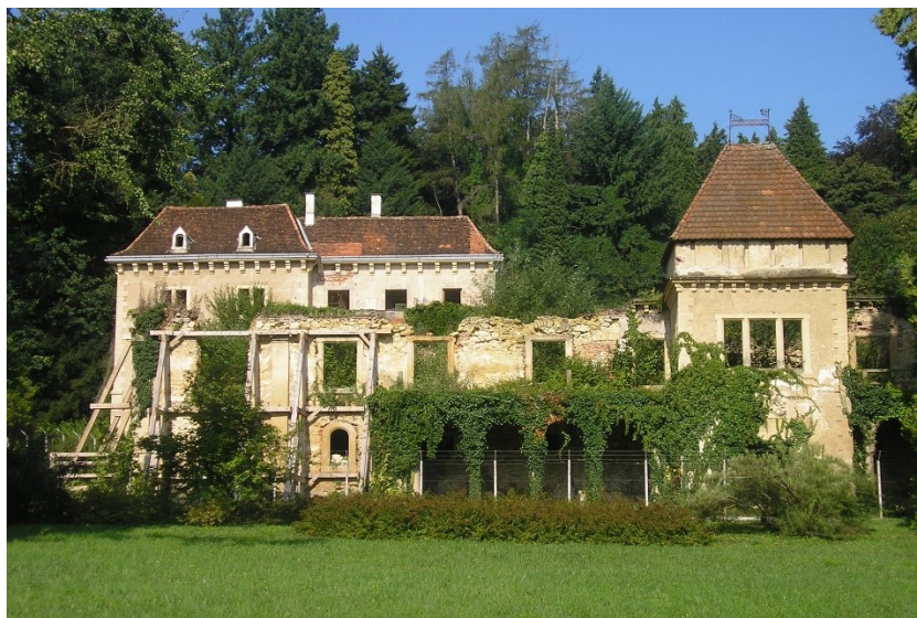
Slika 2. Dvorac Opeka

Lokacije poput napuštenih dvoraca vjerojatno su vrlo zanimljive mladima jer su gotovo bez ikakvog nadzora, iako konkretnih statistika o uzrocima uništavanja kulturnih dobara nema. Ljudi koji se okupljaju na ovim mjestima često počinju s razaranjem, odnosno oštećenjem okoliša u svojem osobnom okruženju, a najčešće to postižu prekomjernom zlouporabom opijata.