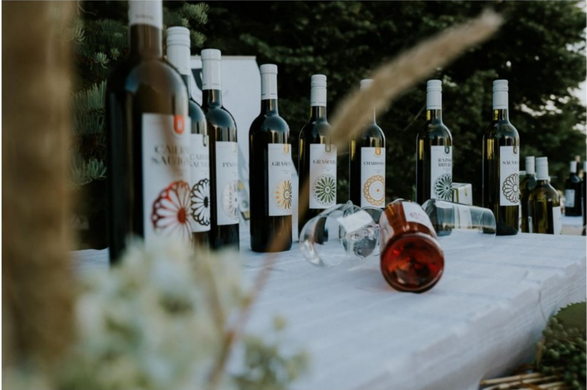
Slika 16. Dani otvorenih vinskih podruma

Osim glavnih odrednica programa, nalazi se i niz događanja koja su povezana s tradicijom, uključujući promociju dječjih radova na temu vezova te izložbe koje prikazuju narodne običaje.