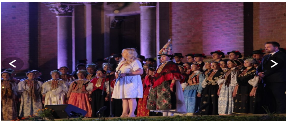
Slika 23. Svečano otvaranje 57. Đakovačkih vezova