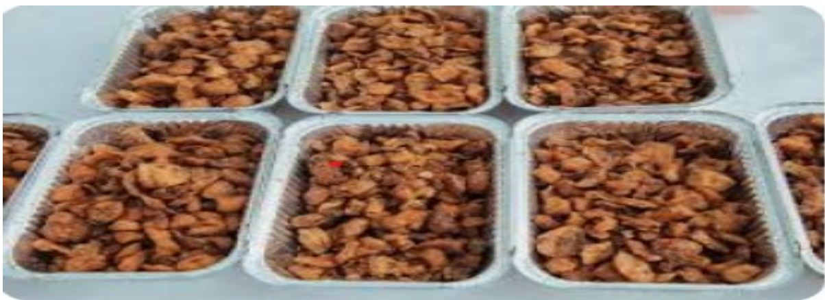
Slika 19. Čvarci