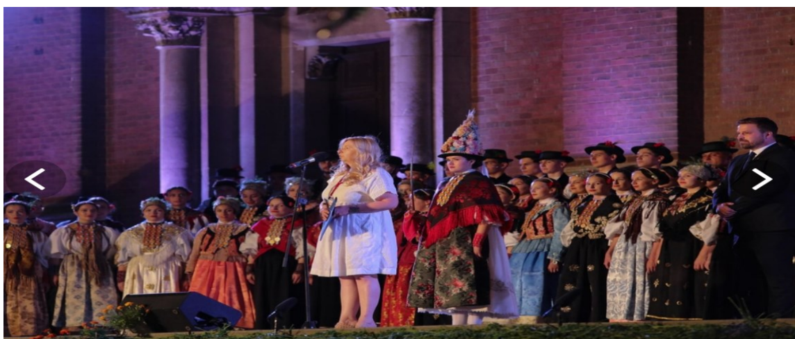
Slika 23. Svečano otvaranje 57. Đakovačkih vezova

Svečano otvaranje 57. Đakovačkih vezova tradicionalno se održava ispred Katedrale svetog Petra, na Strossmayerovu trgu. Središnji dio otvaranja manifestacije obuhvaća scensku sliku koju vode Mirko Ćurić i Darko Milas, scenaristi i redatelji te manifestacije od 2004. Ovogodišnja scenska slika bila je posvećena temi vjenčanja i ženidbe kao značajnom činu, kako u životu pojedinca tako i u narodnom i tradicionalnom životu. Izvedba ove slike, koju su izveli glumci, pjevači solisti, KUD-ovi i tamburaški sastavi (slika 24.), temeljila se na rukopisnoj priči „Puška kobnica“ autora Nikole Tordinca, đakovačkog svećenika i književnika (1858. – 1888.).