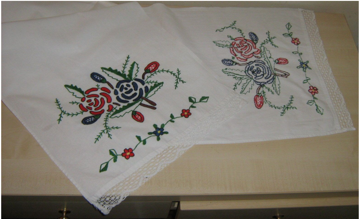
Slika 11. Slavonski ručnik, ručno vezen rad

je tipično za taj kraj. Tako su se na ručnike vezli motivi konja, seoskih kola, đerma, cvijeća i tome slično.