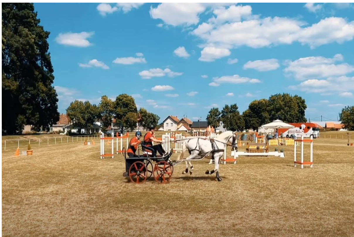
Slika 25. „Finale Croatia Cupa” za jednoprege i dvoprege

Svečano otvaranje Đakovačkih vezova bilo je obogaćeno nastupima jahača i vozača zaprega s lipincima. Ova manifestacija, koju su službeno podržali Državna ergela i privatni uzgajivači, redovito uključuje svečanu povorku koja prikazuje bogato ukrašene tradicijske svatovske zaprege,iskusne vozače i vješte jahače svih uzrasta. Prošlogodišnja povorka na 56. Đakovačkim vezovima brojila je 44 svatovske zaprege i 62 jahača iz Slavonije, Baranje i Srijema. Osim toga, otvorenje Vezova dodatno se obogaćuje nastupima vještih jahača lipicanaca koji donose i predstavljaju službene zastave, čime se dodatno ističe ljepota ove tradicije. 66