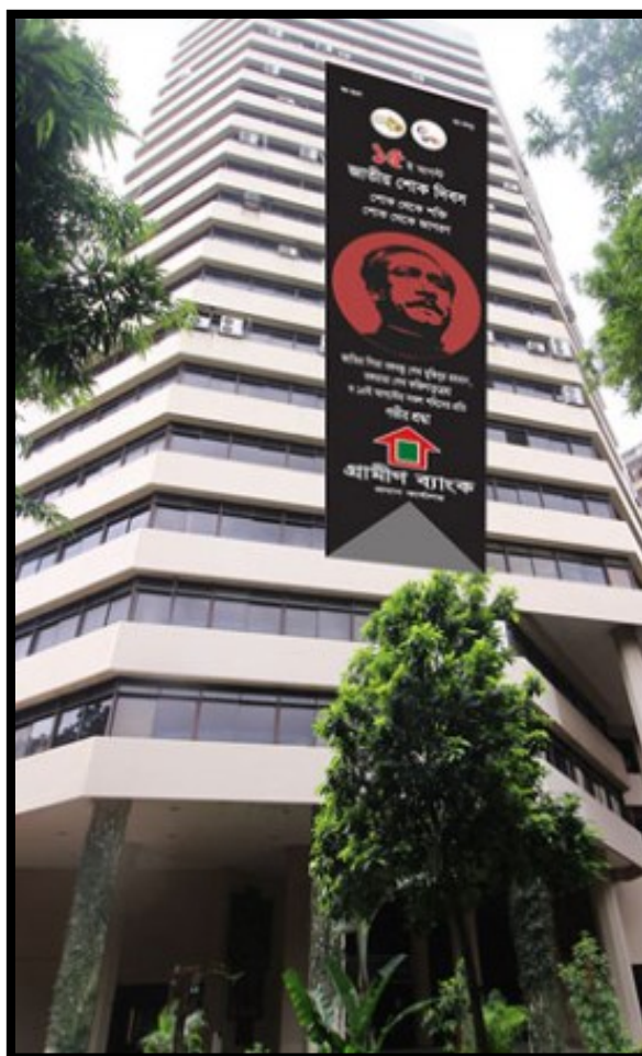
Slika 2.: Grameen banka (Bangladeš)