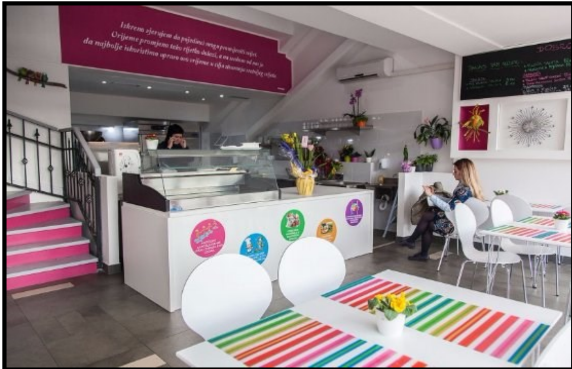
Slika 5.: Bistro Punkt, Pula