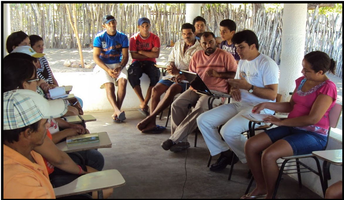
Slika 4.: Ashoka

Ashoka je društveno poduzeće osnovano 1980. godine, s misijom da svojim aktivnostima doprinosi u svijetu u kojem građani utječu na promjene na pozitivan način. Danas ima više od 300 zaposlenika, te djeluje u više od 95 zemalja u cijelom svijetu. 71 Ashoka je poduzeće pionir u društvenom poduzetništvu, kojemu je od osnivanja prioritet društveno poduzetništvo kroz suradnju sa drugim društvenim poduzećima i pojedincima koji omogućavaju inovativna društvena, kulturna i ekološka rješenja.