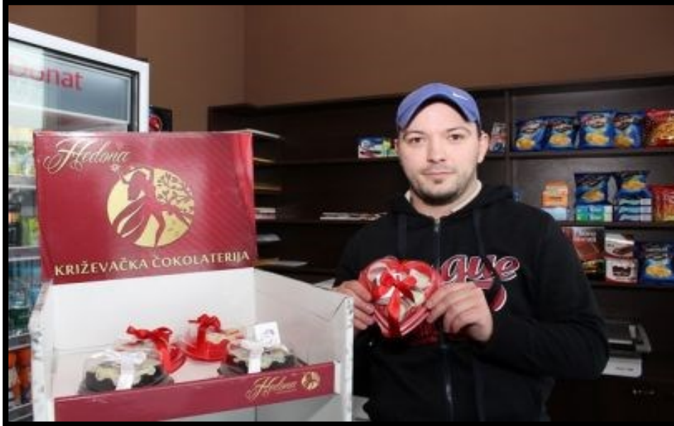
Slika 7.: Hedona: Choco bar

invaliditetom. To nisu radionice u kojima se svladavaju samo određene proizvodne aktivnosti, već cjelokupan proizvodni proces.