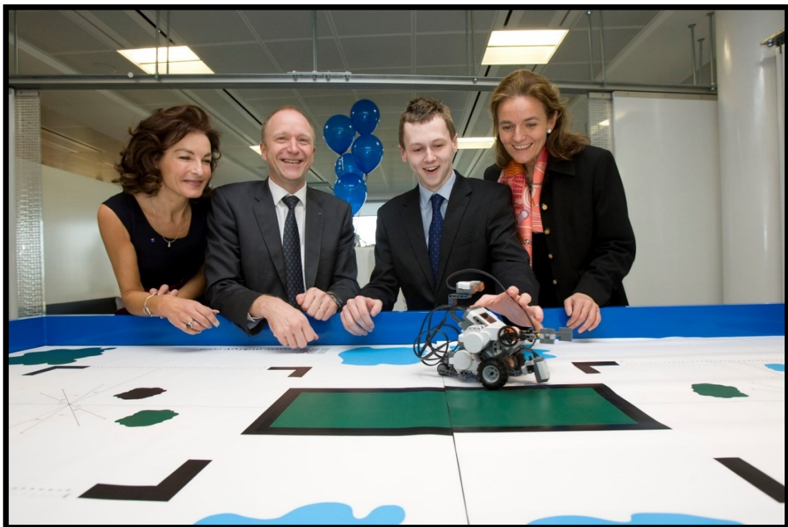
Slika 3.: Specialisterne, Danska

razvijen IBM SkillsBuild, besplatni digitalni program putem kojeg neurodivergentni kandidati i konzultanti imaju mogućnost obuke i tečajeva za stjecanje zahtjevnih tehnoloških vještina poput kibernetičke sigurnosti, analitike, upravljanja projektima i umjetne inteligencije. Specialisterne je društveno poduzeće koje svojim poslovanjem doprinosi podržavanju osoba oboljelih od autizma i njihovom zapošljavanju, pa na takav način djeluje na provedbe cilja održivog razvoja – dostojanstven rad i gospodarski razvoj.