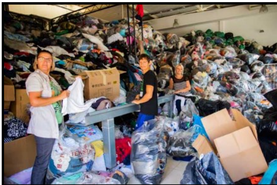
Slika 6.: Prikupljanje tekstila za recikliranje – Humana Nova Čakovec

utječu na boljitak vlastitog života, ali i društva u cjelini (prikupljaju tekstil – Slika 6., recikliraju otpad, izrađuju, šivaju, kroje odjevne predmete koji se prodaju u Second - Hand trgovinama, te dr.).