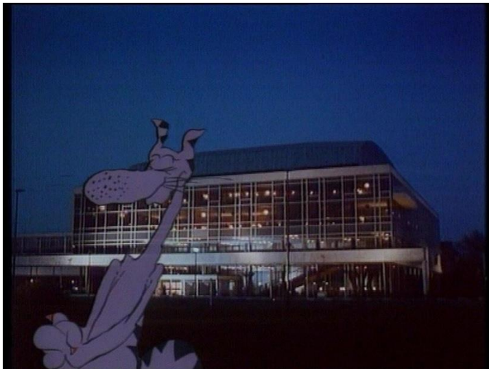
Slika 6. Maskota Eurovizije 1990., Eurocat ispred dvorane Vatroslava Lisinskog