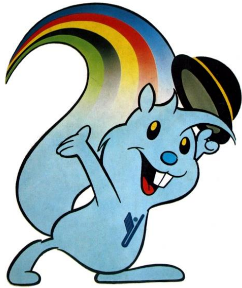
Slika 4. Maskota Univerzijade 1987., vjeverica Zagi