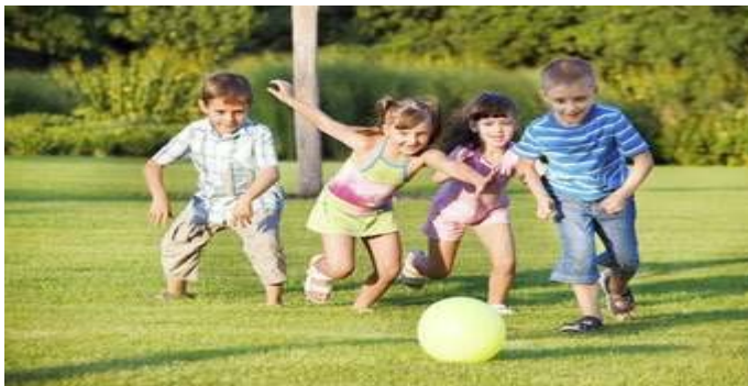
Slika 4. Djeca u igri