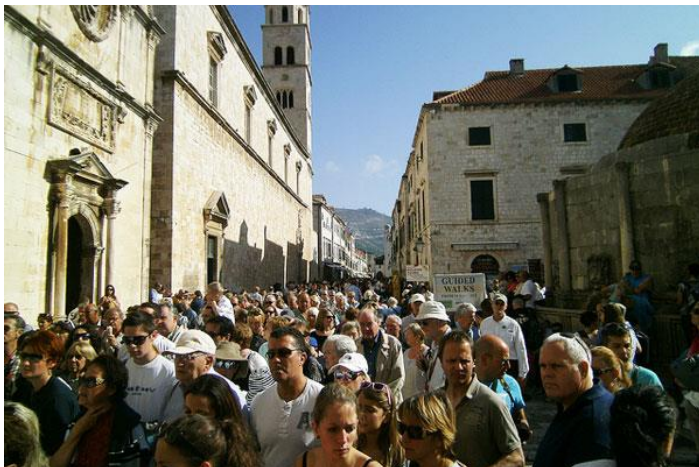
Slika 2. Prenapučeni Stradun turistima u Dubrovniku