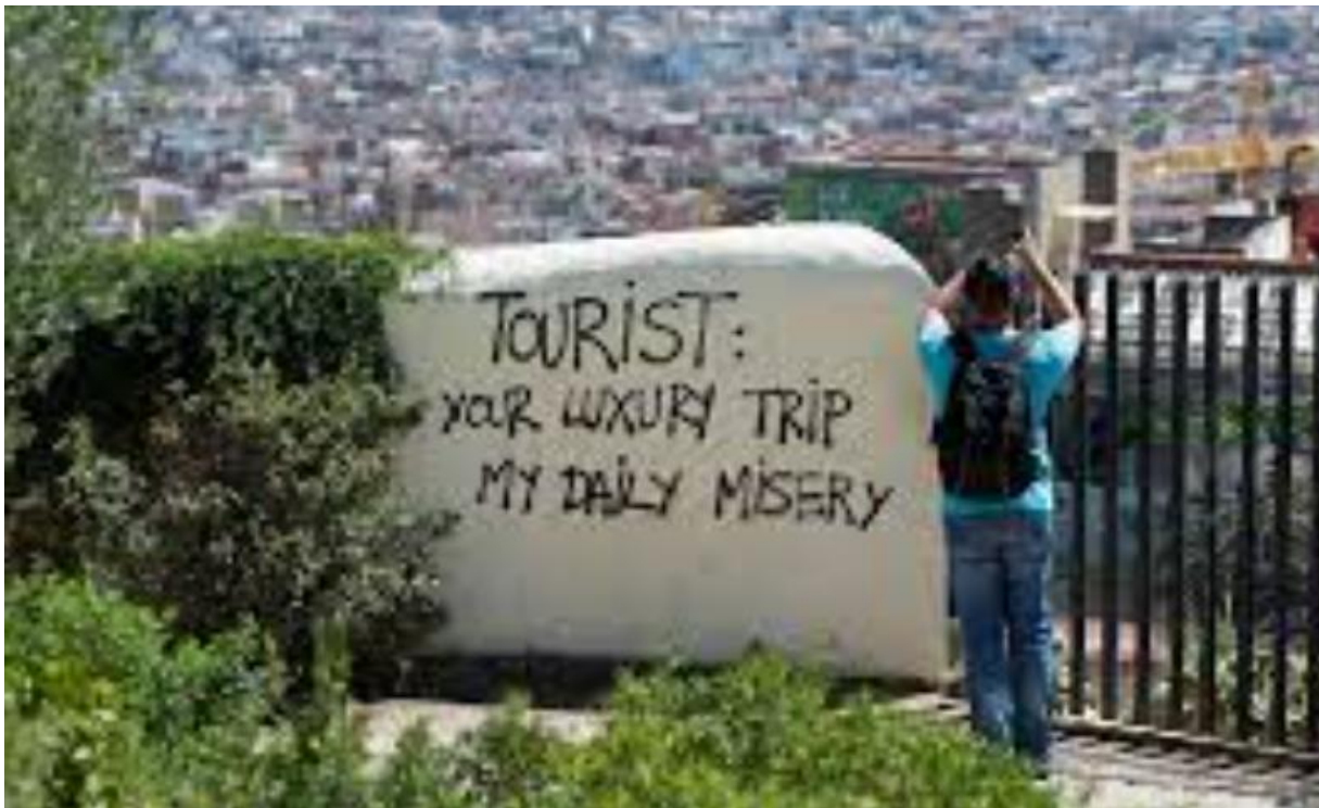
Slika 13. Pobunjeničke poruke lokalnog stanovništva turistima