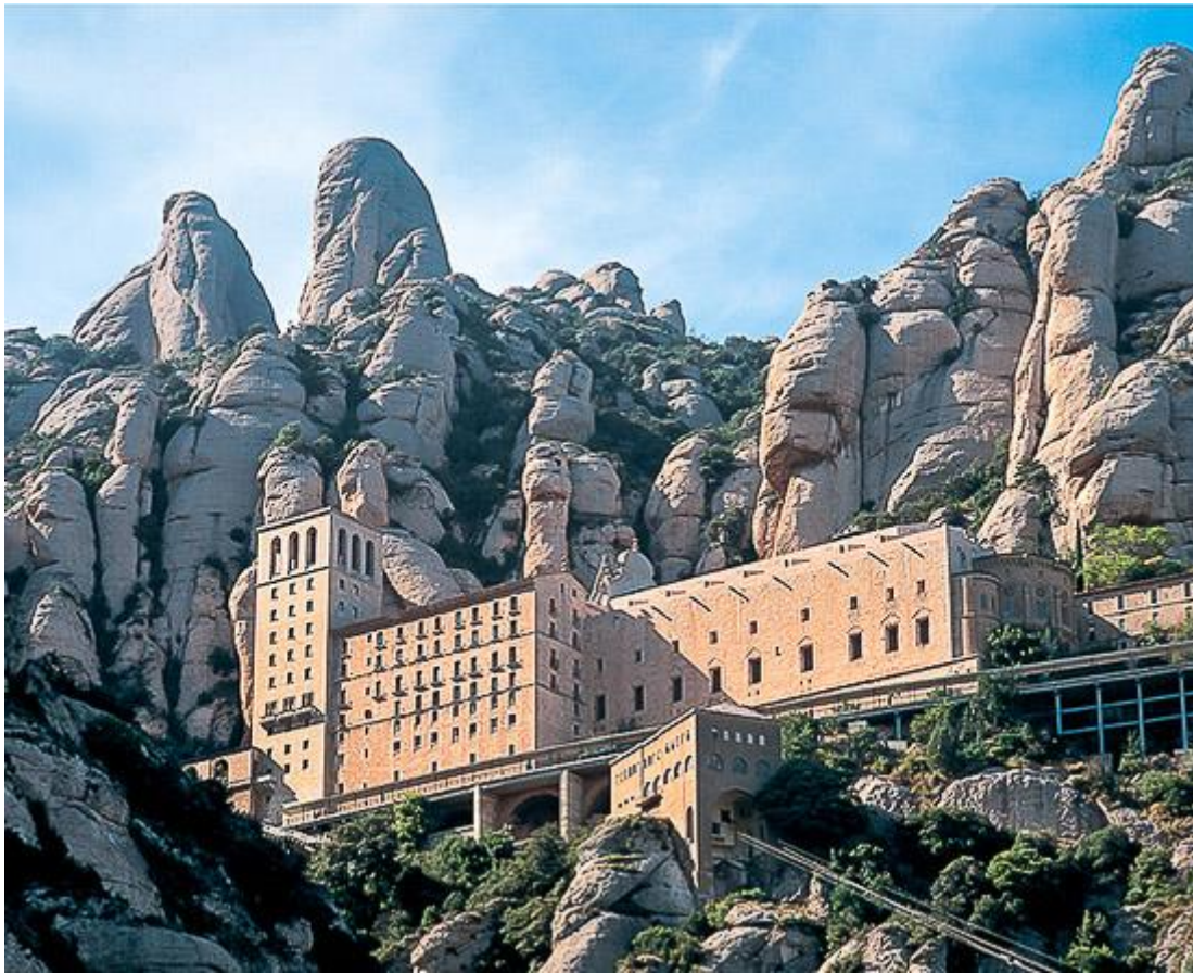
Slika 6. Planina Montserrat