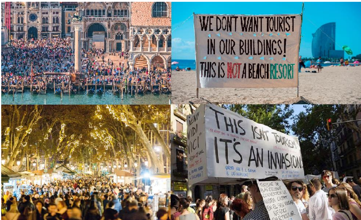
Slika 1. Prenapučene svjetske destinacije i reakcije lokalnog stanovništva