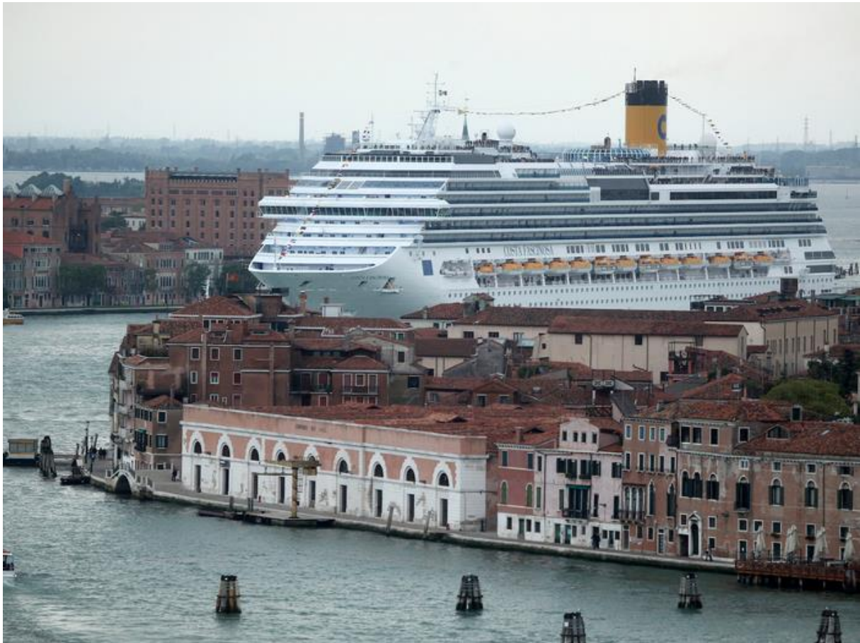
Slika 11. Zagađena lučka infrastruktura Barcelone