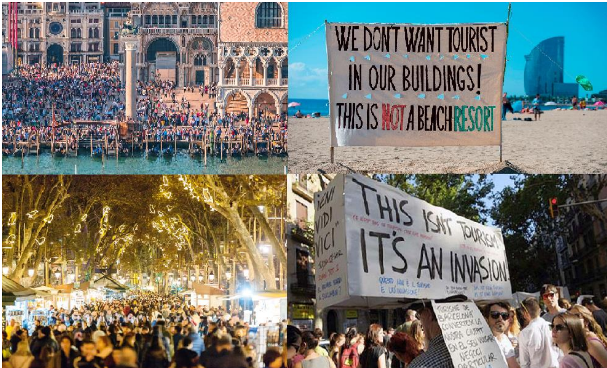
Slika 1. Prenapučene svjetske destinacije i reakcije lokalnog stanovništva