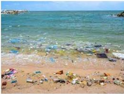
Slika 10. Zagađenost plaža Barcelone