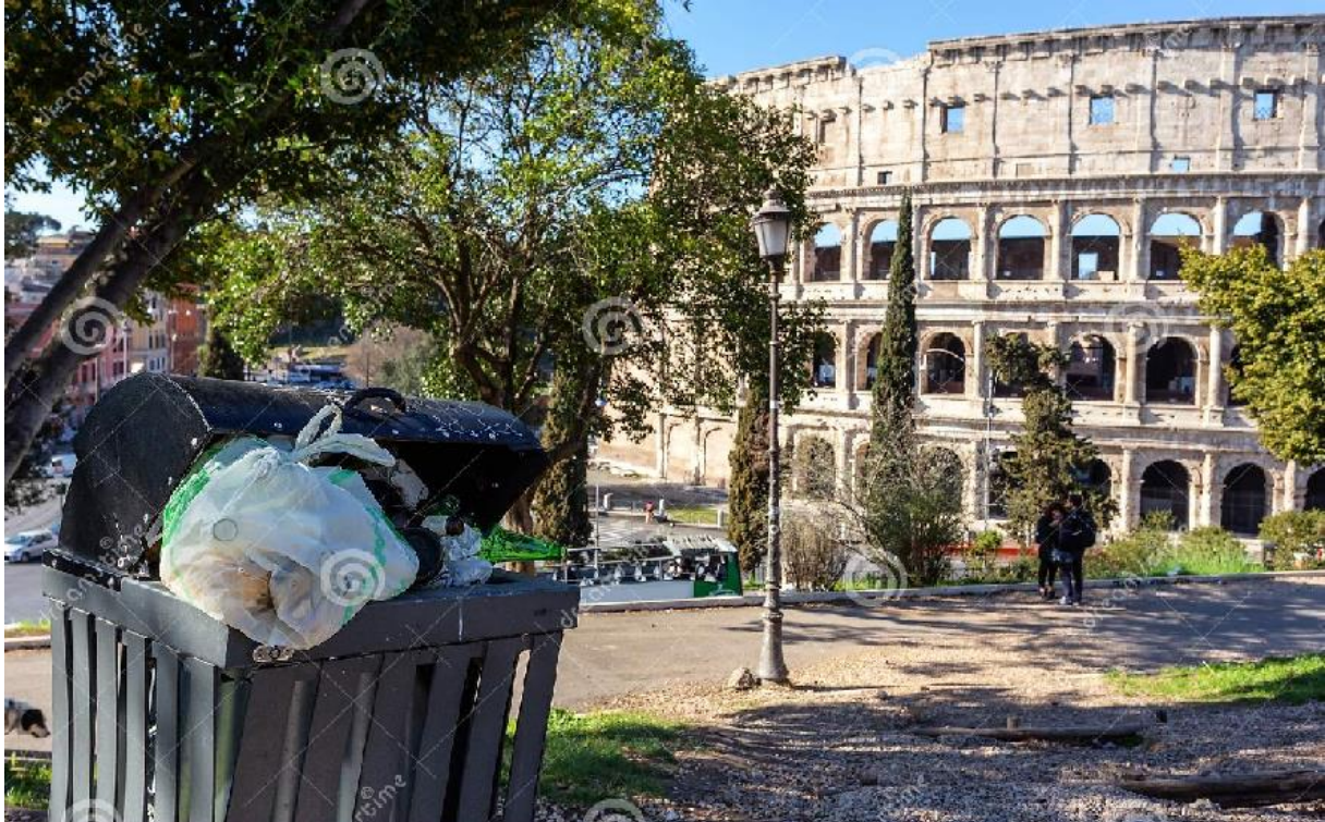
Slika 19. Akumulacija smeća ispred Koloseuma