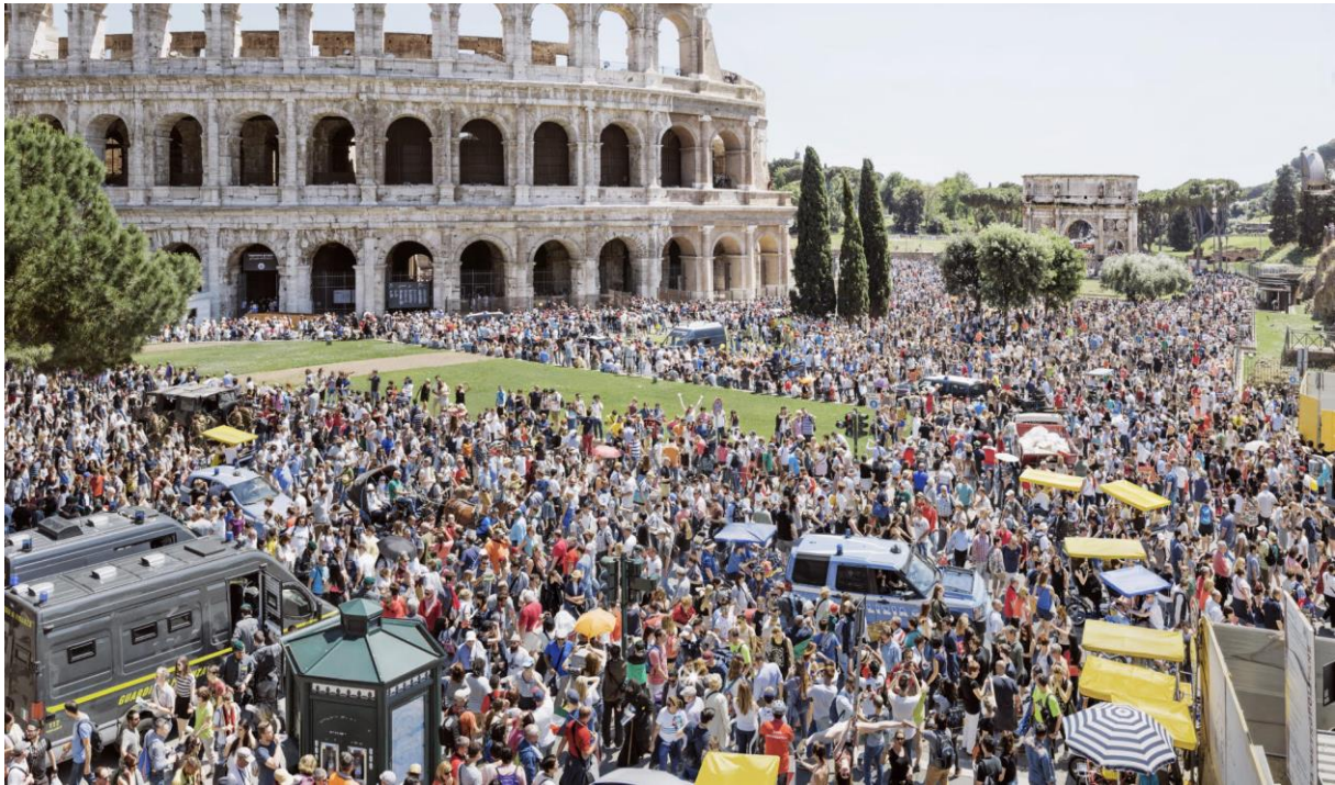
Slika 18. Turističke gužve oko Koloseuma