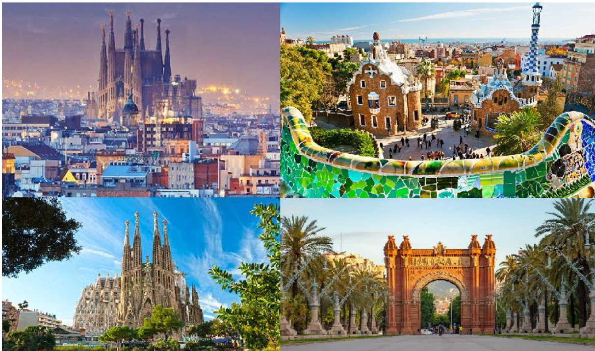
Slika 4. Barcelona kao turistička destinacija