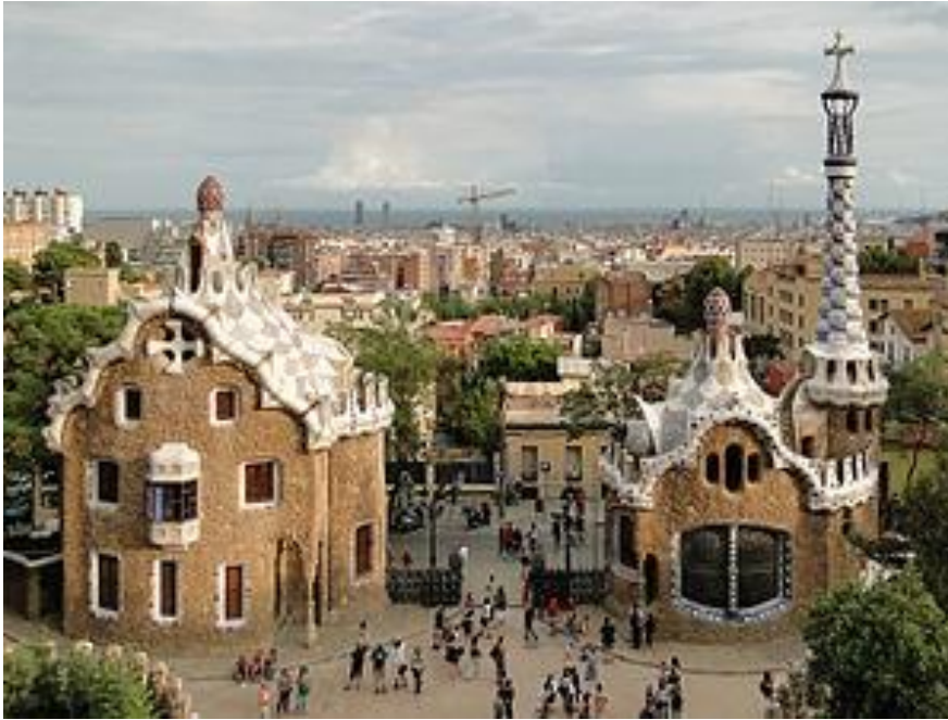
Slika 7. Ulaz u Parc Guell