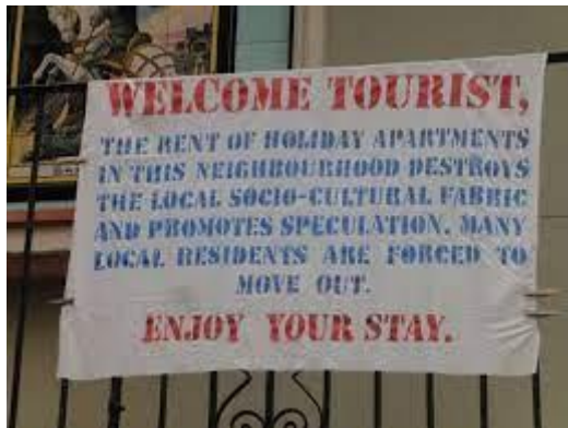
Slika 12. Poruka lokalnog stanovništva turistima