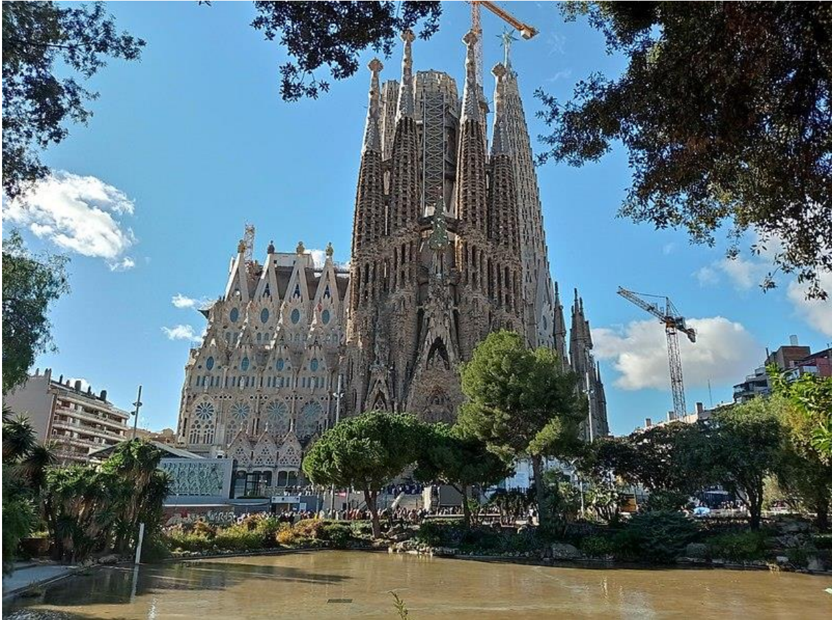
Slika 8. Bazilika Sagrada Familia