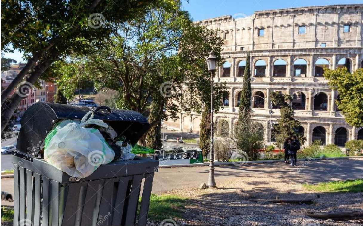
Slika 19. Akumulacija smeća ispred Koloseuma