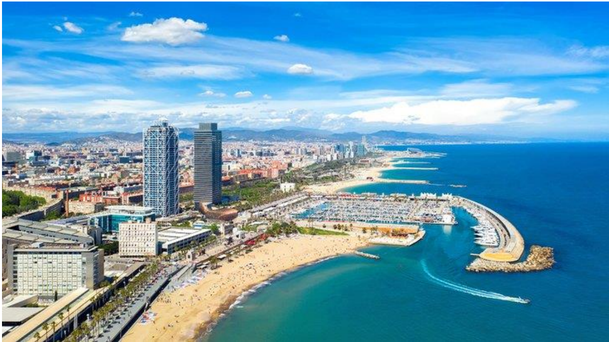
Slika 5. Plaže Barcelone