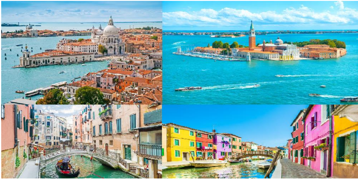
Slika 14. Venecijski kanali