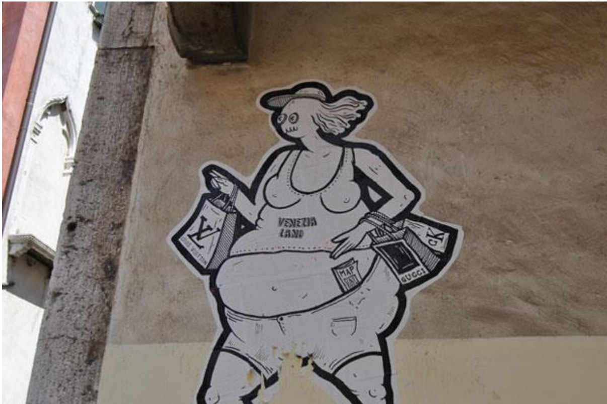
Slika 17. Grafiti protiv turista u Veneciji