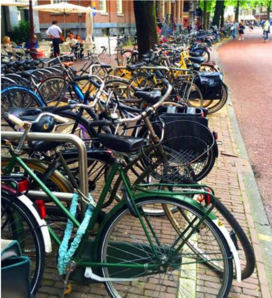
Slika 3. Prenapučenost bicikala turista i lokalnog stanovništva

Izvor: 1. UNWTO (2020): Overtourism? Understanding and Managing Urban Tourism Growth beyond Perceptions, dostupno na https://www.e-unwto.org/doi/pdf/10.18111/9789284420070 , pristupljeno 08.04.2021.