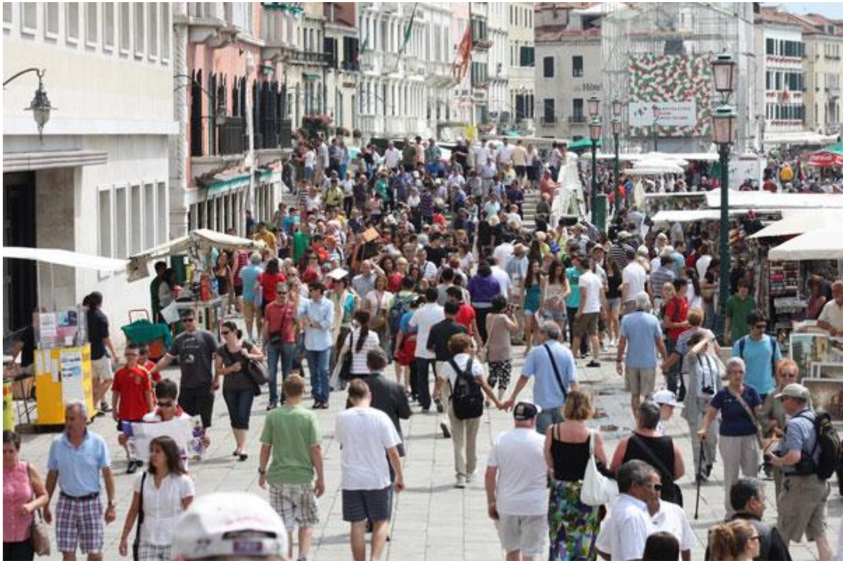
Slika 15. Turističke gužve u Veneciji