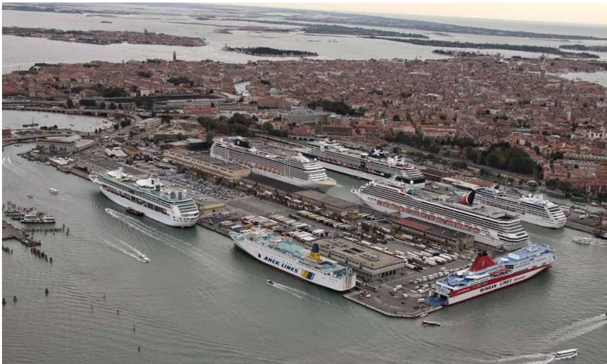
Slika 16. Prenapučenost kruzera u venecijskoj luci