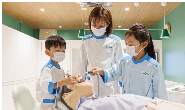
Slika 3. Tematska kućica "Zubna ordinacija"