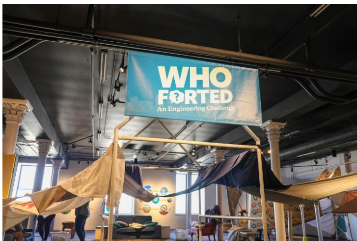
Slika 7. Interaktivni eksponat Who fortified