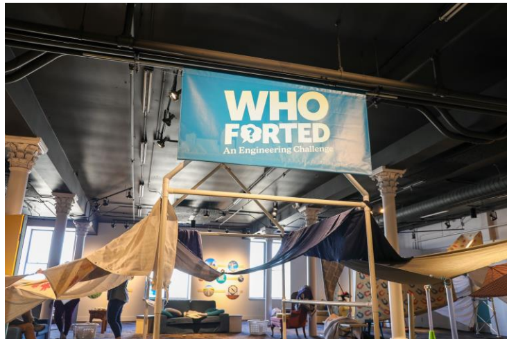
Slika 7. Interaktivni eksponat Who Forted