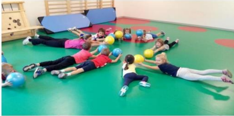
Slika 6. Opće pripremne vježbe s loptom (Petrić, 2019)