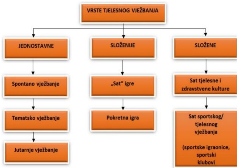
Slika 3. Vrste tjelesnog vježbanja djece predškolske dobi (Neljak, 2009)

Neljak (2009) istražuje različite oblike tjelesnog vježbanja za djecu predškolske dobi, naglašavajući različite razine složenosti u tim aktivnostima. Početni stupanj uključuje jednostavne oblike, poput spontanog, tematskog i jutarnjeg vježbanja. Spontano vježbanje obuhvaća neplanirane aktivnosti koje djeca samoinicijativno poduzimaju, bez upliva stručnjaka. S druge strane, tematsko vježbanje predstavlja planiranu aktivnost koju vodi voditelj, s fokusom na jednostavnim motoričkim zadacima.