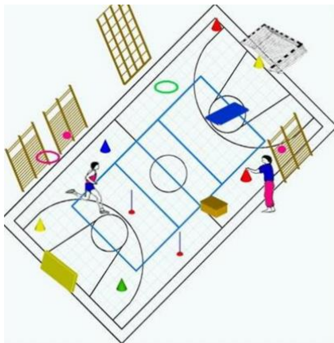
Slika 5. Igra „Pronađi boju“ (Sindik, 2009)