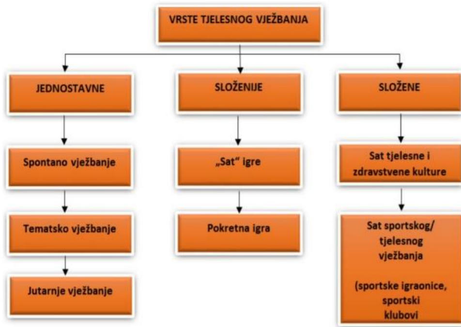
Slika 3. Vrste tjelesnog vježbanja djece predškolske dobi (Neljak, 2009)

Neljak (2009) istražuje različite oblike tjelesnog vježbanja za djecu predškolske dobi, naglašavajući različite razine složenosti u tim aktivnostima. Početni stupanj uključuje jednostavne oblike, poput spontanog, tematskog i jutarnjeg vježbanja. Spontano vježbanje obuhvaća neplanirane aktivnosti koje djeca samoinicijativno poduzimaju, bez upliva stručnjaka. S druge strane, tematsko vježbanje predstavlja planiranu aktivnost koju vodi voditelj, s fokusom na jednostavnim motoričkim zadacima.