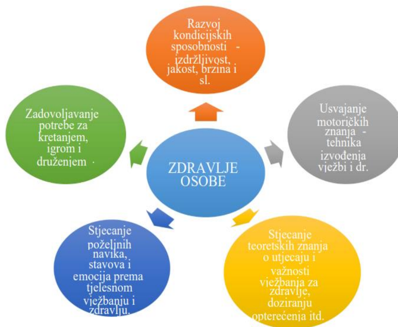
Slika 1. Struktura ciljeva koji se nastoji postići primjenom tjelesnog vježbanja (Pejčić i Trajkovski, 2018)

Prema Bungić i Barić (2009), postavljeni su ciljevi koji doprinose održavanju zdravlja osobe. To uključuje zadovoljavanje potreba za kretanjem, druženjem i igrom, razvoj kondicijskih sposobnosti poput izdržljivosti, jakosti i brzine, usvajanje motoričkih znanja o pravilnom izvođenju vježbi te stjecanje teoretskih znanja o utjecaju i važnosti vježbanja za zdravlje.