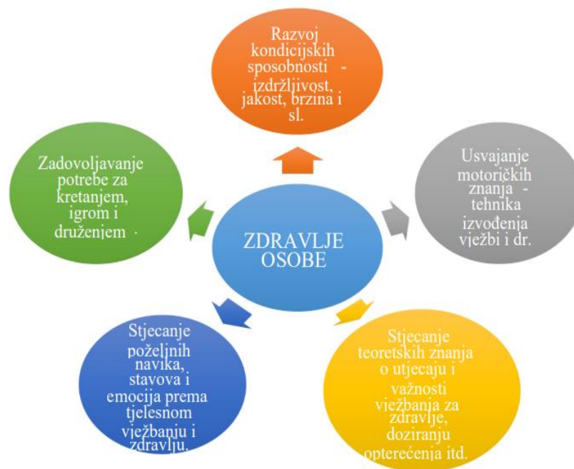
Slika 1. Struktura ciljeva koji se nastoji postići primjenom tjelesnog vježbanja (Pejčić i Trajkovski, 2018)

Prema Bungić i Barić (2009), postavljeni su ciljevi koji doprinose održavanju zdravlja osobe. To uključuje zadovoljavanje potreba za kretanjem, druženjem i igrom, razvoj kondicijskih sposobnosti poput izdržljivosti, jakosti i brzine, usvajanje motoričkih znanja o pravilnom izvođenju vježbi te stjecanje teoretskih znanja o utjecaju i važnosti vježbanja za zdravlje.