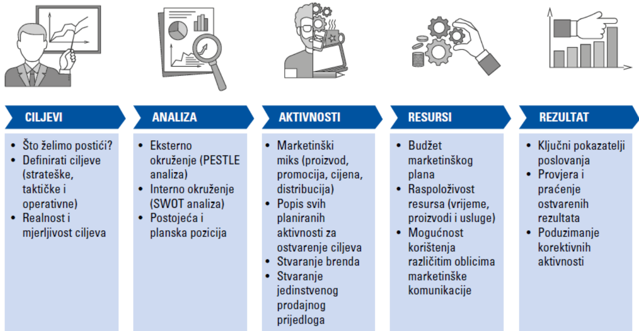
Slika 2. – Metodologija plana

Metodologiju izrade moguće je prikazati na sljedeći način: