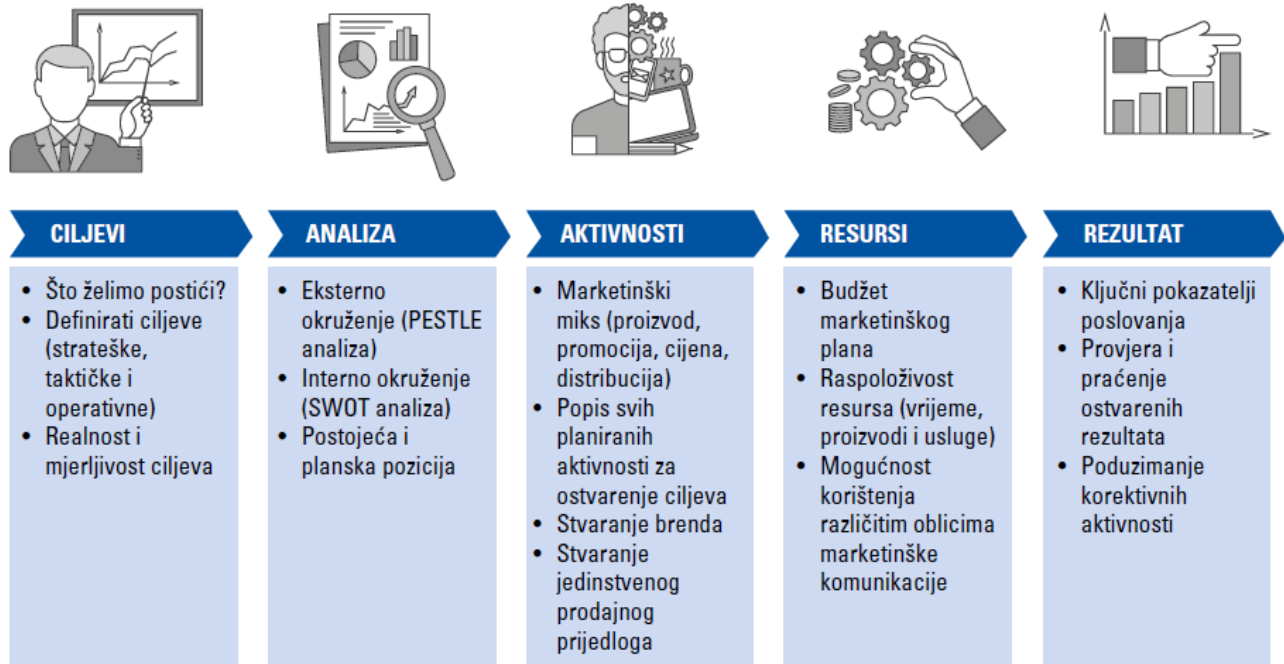
Slika 2. – Metodologija plana

Metodologiju izrade moguće je prikazati na sljedeći način: