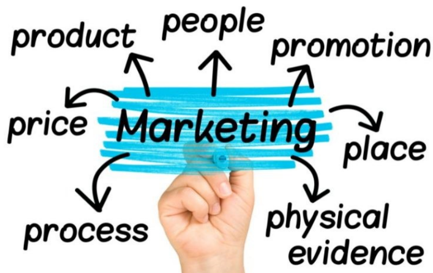
Slika 3. – Marketinški miks

Izborom ciljanog tržišta identificiraju se potencijalni tržišni segmenti, s relativno istovrsnim potrebama koje je moguće zadovoljiti pomoću marketinškog miksa. Iako je svaki segment miksa bitan sam po sebi, samo njihovo usklađivanje jamči potpunu uspješnost odabrane strategije.