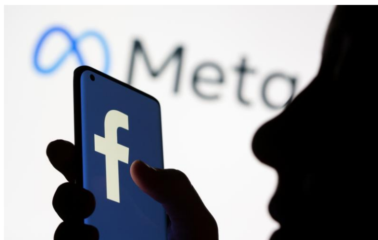
Slika 2: Facebook

Danas više od 3 milijarde ljudi diljem svijeta koristi Facebook za stvaranje poslovnih i osobnih veza s istomišljenicima. Zbog ogromnog uspjeha platforme, njezino matično poduzeće, koje se sada zove Meta, napravilo je značajne akvizicije i ostaje sila u područjima komunikacija, medija i pop kulture.