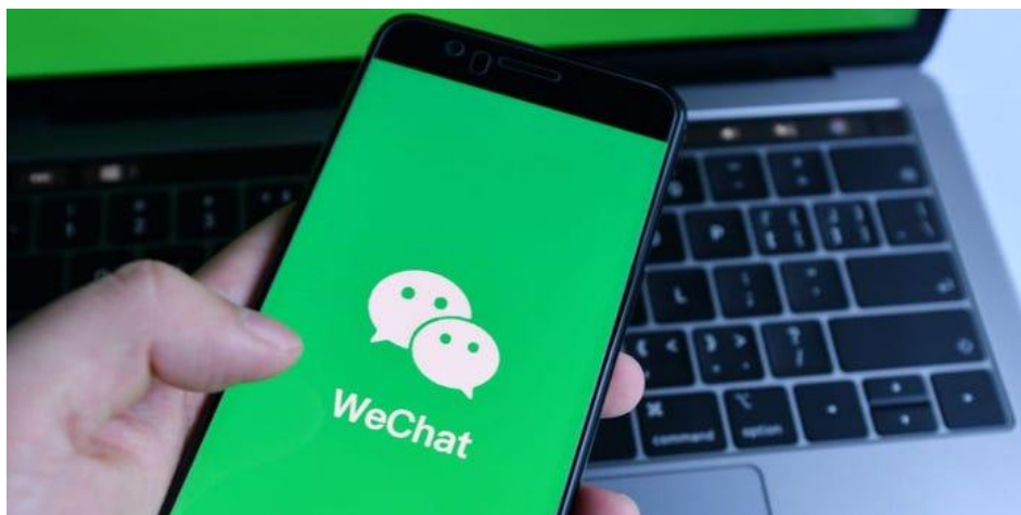
Slika 5: WeChat aplikacija

Izvor: Reviews, https://www.businessinsider.com/guides/tech/what-is-wechat (Datum pristupanja: 11.07.2023.)