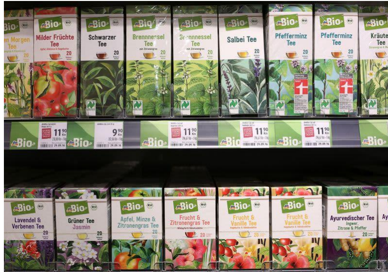
Slika 10: Proizvodi s ekološkim predznakom