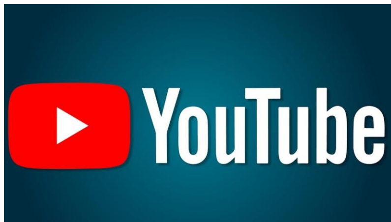
Slika 3: Platforma Youtube