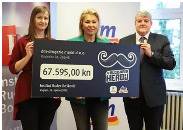
Slika 12: Donacija Institutu Ruđer Bošković

Izvor: DM, https://www.dm.hr/tvrtka/drustvena-odgovornost/jedni-za-druge-zajedno (Datum pristupanja: 25.07.2023.)