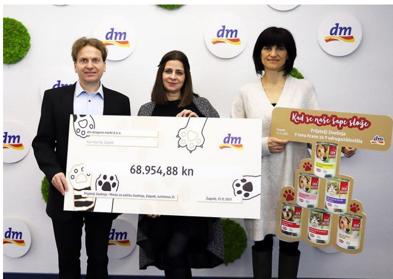
Slika 14: Donacija za napuštene životinje