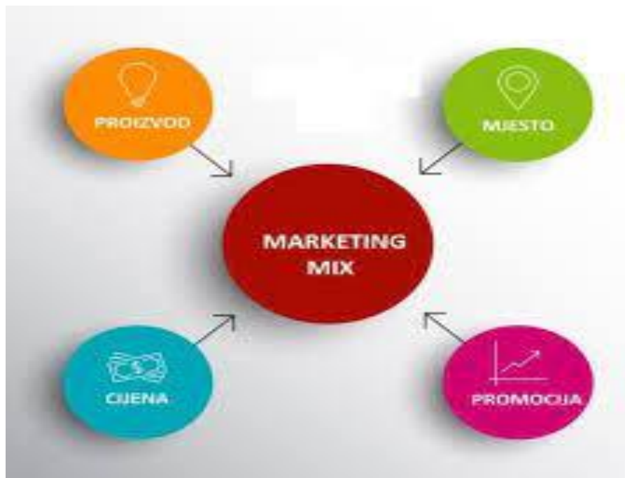
Slika 1: Glavni elementi marketinškog spleta