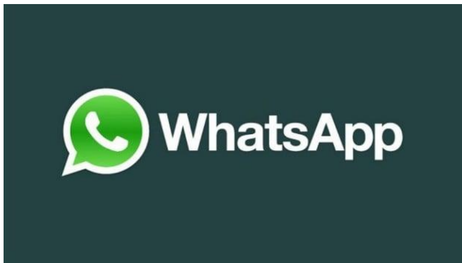
Slika 4: WhatsApp aplikacija