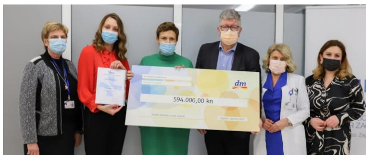
Slika 13: Podrška radu KBC Zagreb

DM - drogerie markt d.o.o. je Institutu Ruđer Bošković predao donaciju zbog nastavka istraživanja raka prostate, a koja donacija je ostvarena u sklopu kampanje Movember sa kazalištem Kerempuh u kojoj je DM pozvao sve muškarce da bolje brinu o zdravlju i obavljaju redovite liječničke preglede.