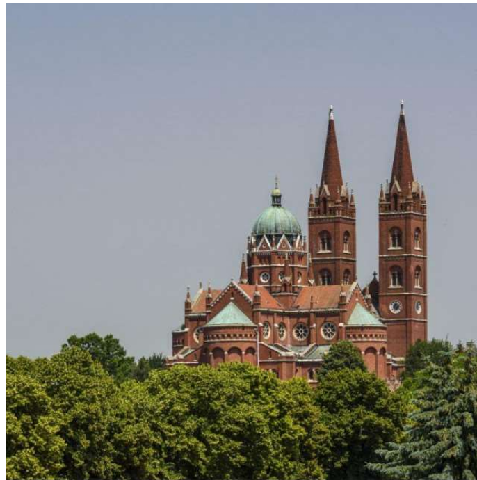
Slika 7. Katedrala sv. Petra u Đakovu