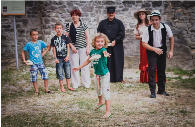
Slika 12. Djeca igraju tradicionalnu igru – pljočkanje