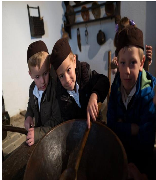
Slika 11. Upoznavanje sa starinskim posuđem