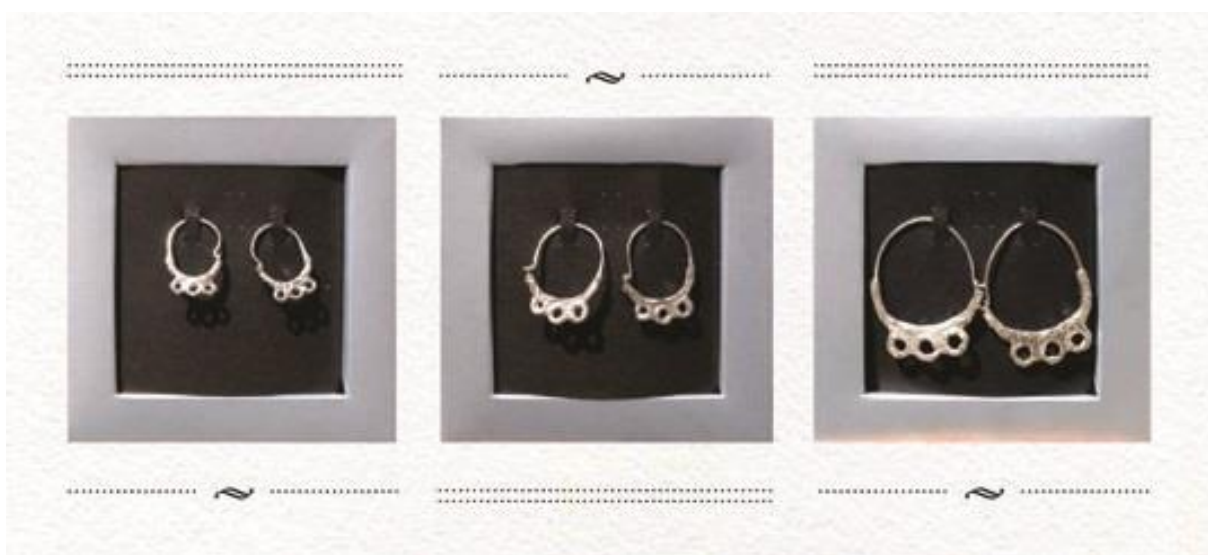
Slika 1. Autohtoni buzetski suvenir - Buzetska naušnica

Buzetske naušnice . Naime, počele su se izrađivati replike srebrnih nosivih naušnica u tri veličine (male, srednje, velike). Danas se Buzetska naušnica prodaje kao novi buzetski suvenir te je odlično prihvaćena od domaćeg stanovništva, ali i stranaca koji ju kupuju kao uspomenu na posjet malom istarskom gradu Buzetu. (Grah Ciliga, 2011: 303-306)