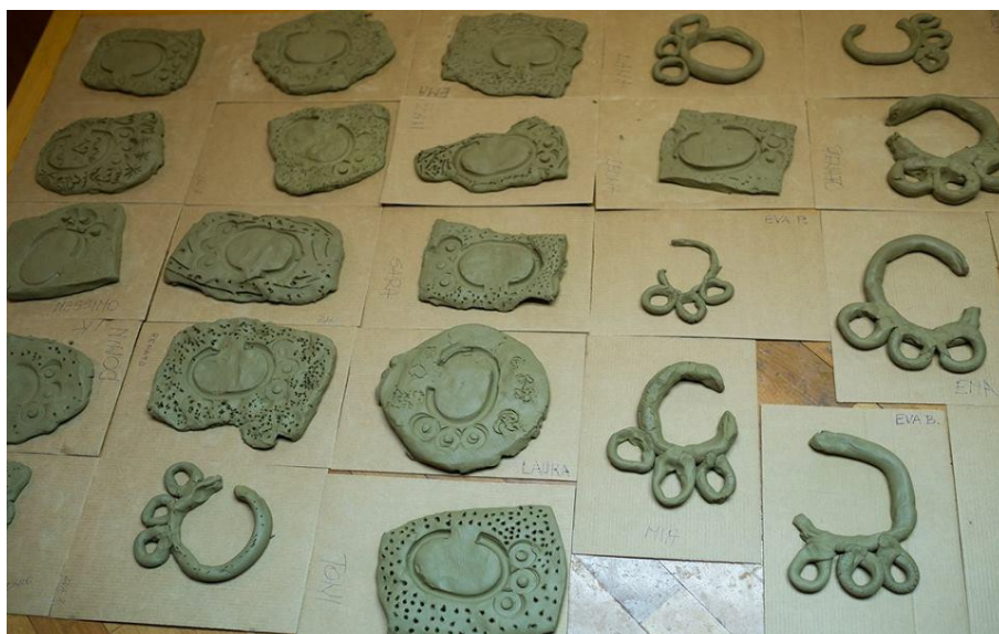
Slika 9. Radovi djece (motiv: Buzetska naušnica , likovna tehnika: glina)