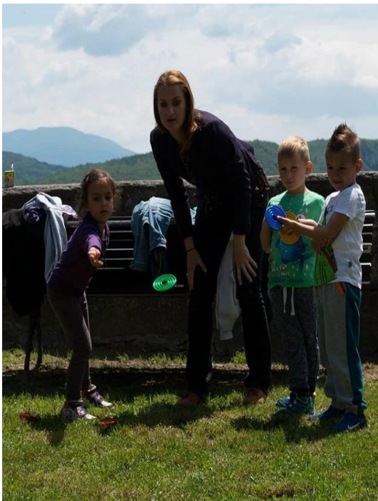
Slika 10. Djeca pljočkaju