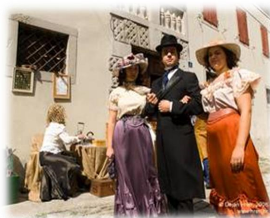
Slika 2. Dame i gospoda u šetnji gradom