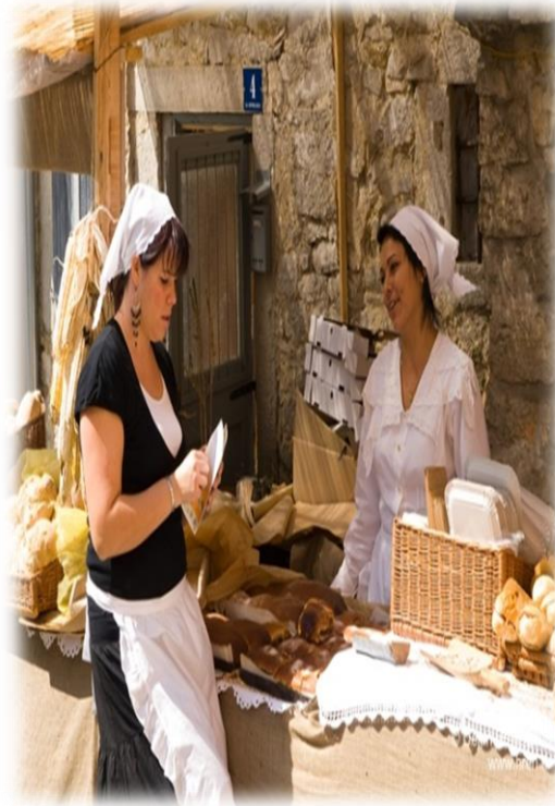
Slika 3. Pekara - prodaja domaćeg kruha i ostalih tradicijskih delicija