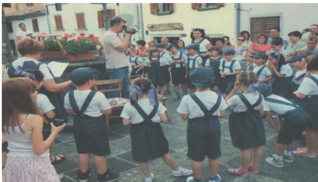
Slika 15. Završna priredba u Starom gradu na Šterni

Izvor: Arhiva Dječjeg vrtića „Grdelin“, fotografirano u lipanju 2014.