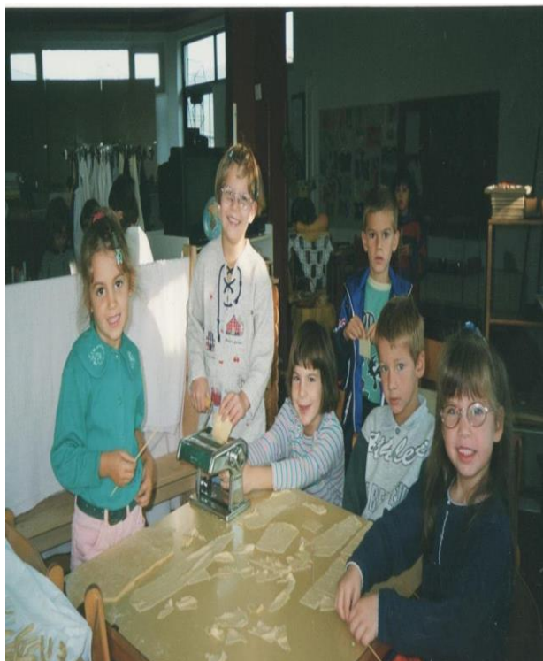
Slika 6. Djeca dječjeg vrtića sudjeluju u izradi njoka i fuža

Izvor: Arhiva Dječjeg vrtića „Grdelin“, fotografirano 5. rujna 2010.