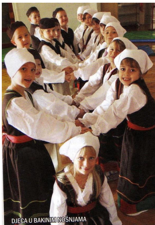
Slika 5. Djeca plešu tradicijski istarski ples - balun