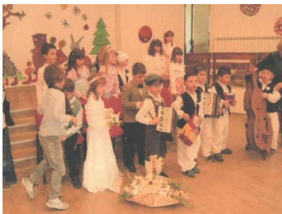
Slika 13. Scenska igra Svatovi po starinski