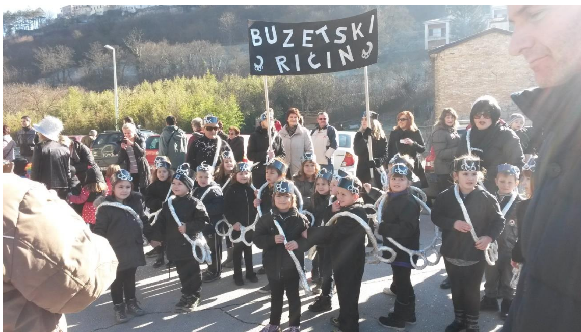
Slika 8. Dječji vrtić "Grdelin" Buzet, skupina Šćinke - dječja maškarana povorka

Izvor: Autorica rada, fotografirano 5. veljače 2016.