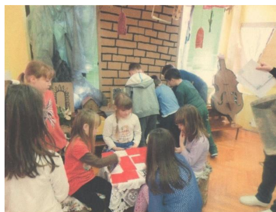
Slika 14. Centar kulturne baštine