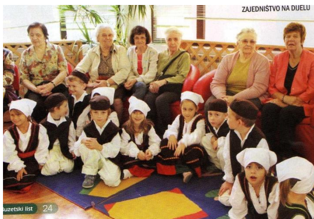
Slika 4. Korisnice Programa pomoći u kući i Dnevnog boravka donijele djeci narodne nošnje