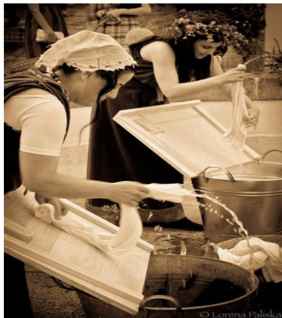
Slika 9. Srednjoškolke u ulozi pralje