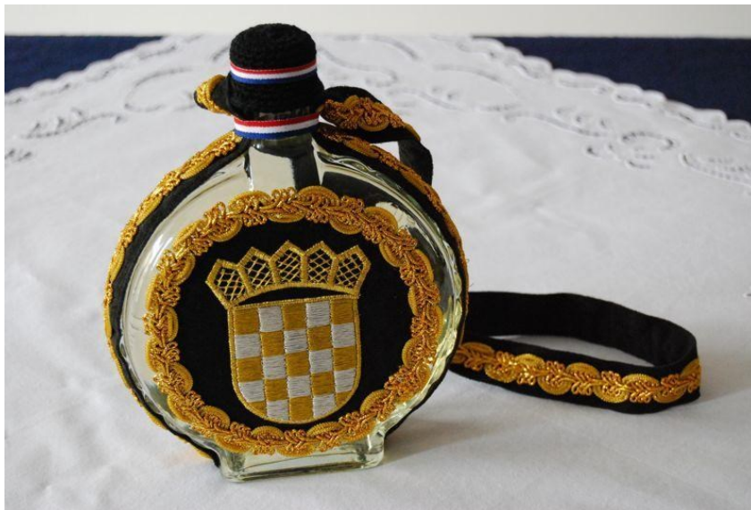
Slika 19: Slavonski zlatovez