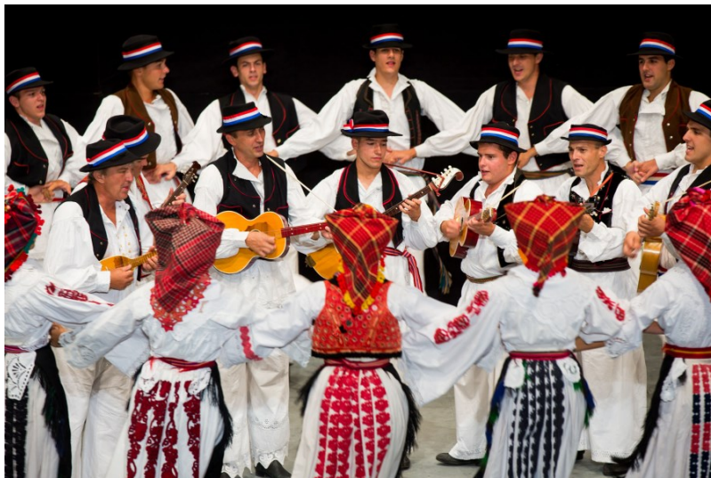
Slika 14: Slavonsko kolo