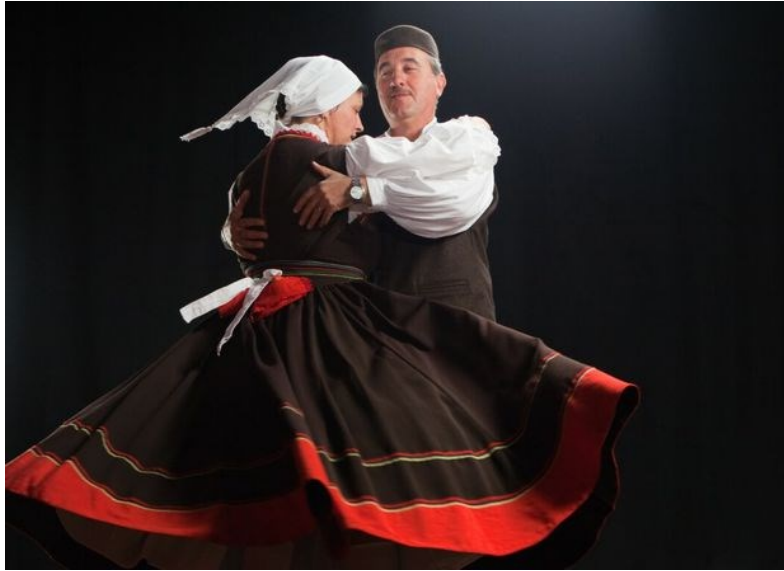
Slika 10: Istarska narodna nošnja