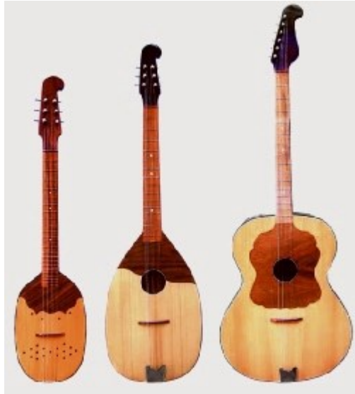
Slika 15: Tambura