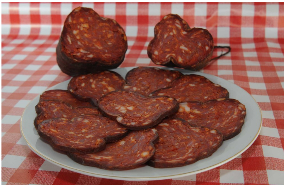
Slika 18: Slavonski kulen