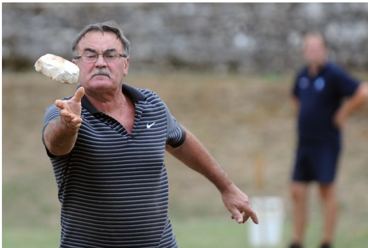
Slika 12: Pljočkanje