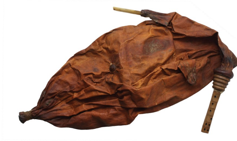
Slika 8: Mih i mišnice