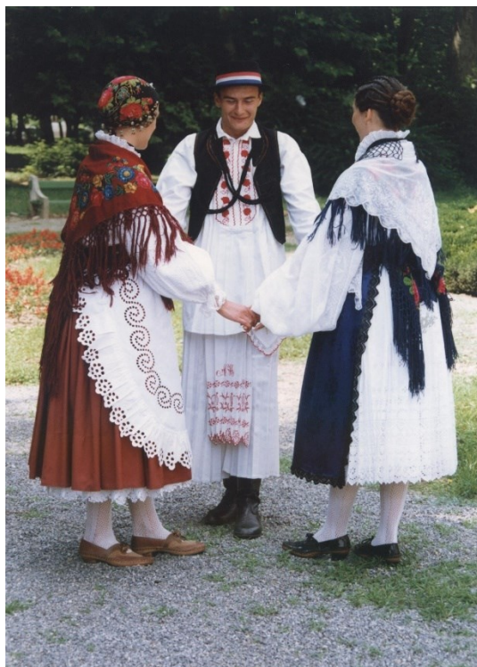
Slika 17: Narodne nošnje Donjeg Miholjca