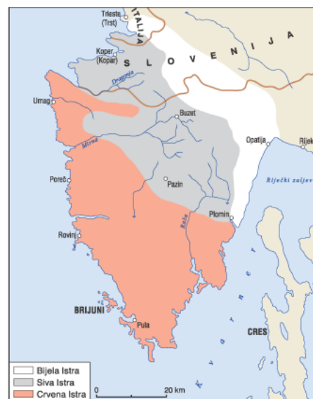
Slika 1: Bijela, siva, crvena Istra