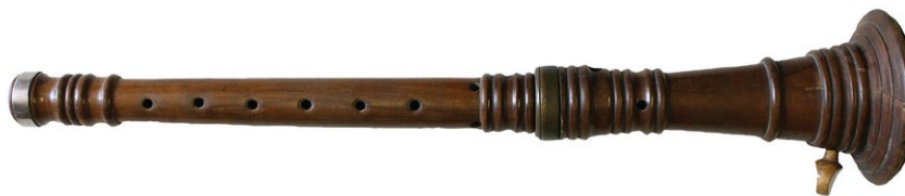
Slika 9: Sopele