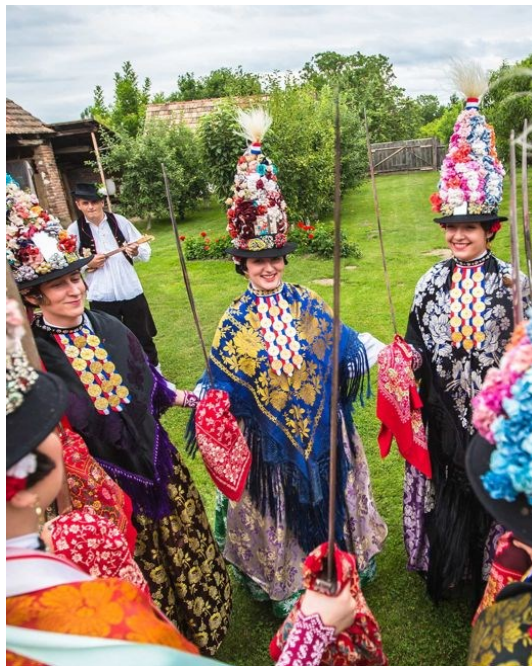
Slika 22: Kraljice ili ljelje iz Gorjana