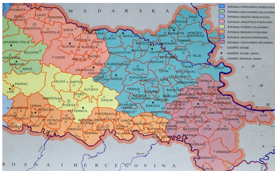
Slika 13: Slavonija