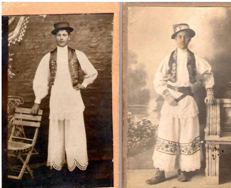
Slika 21: Šokci