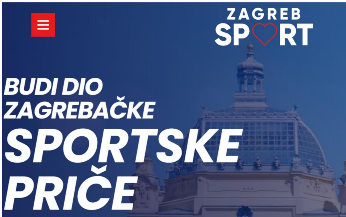
Slika 15. Promocija sportskog turizma