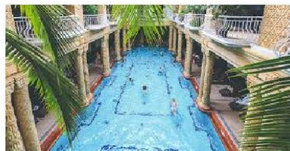
Termalne kupke za vodeni sport - Budimpešta