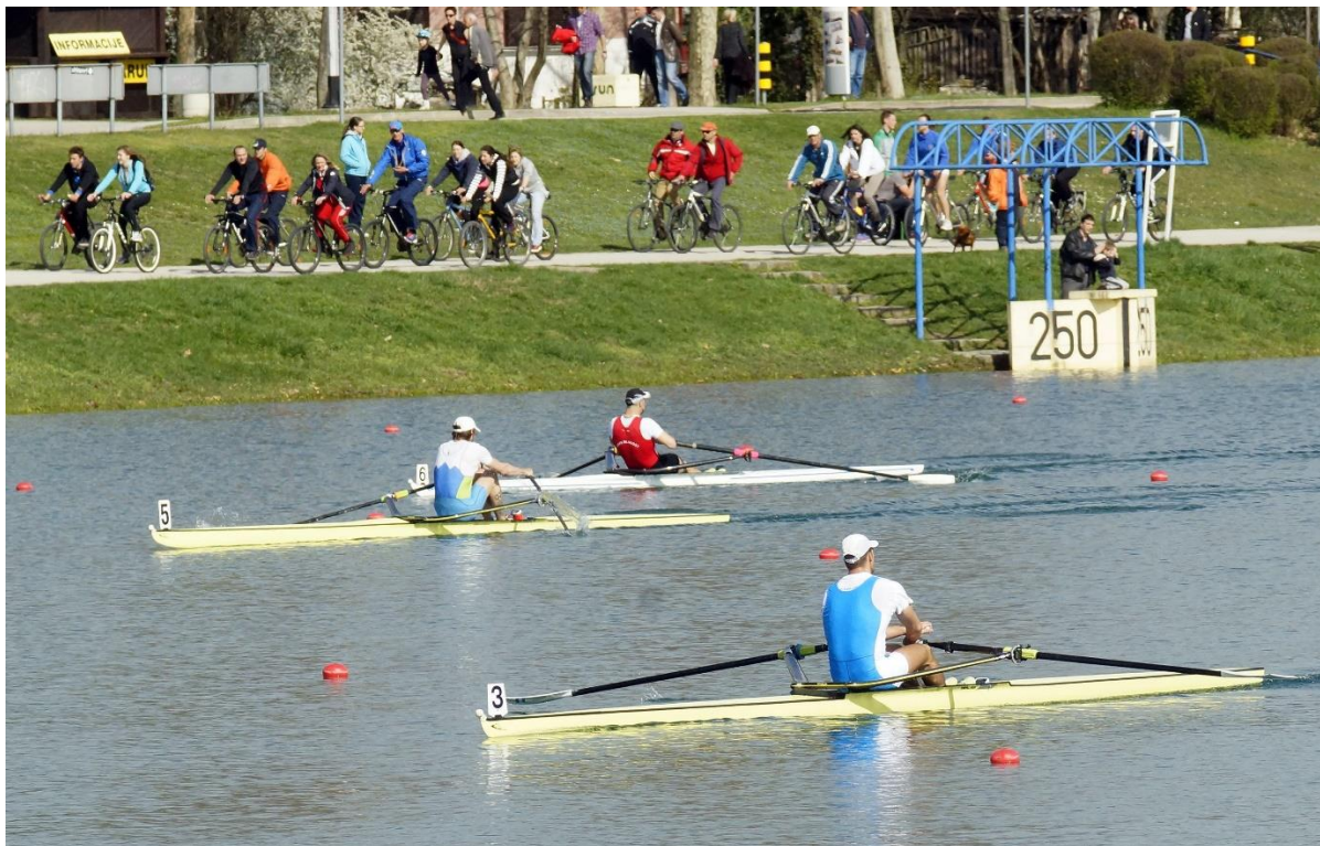
Slika 8. Natjecanje u veslačkoj regati Croatia Open