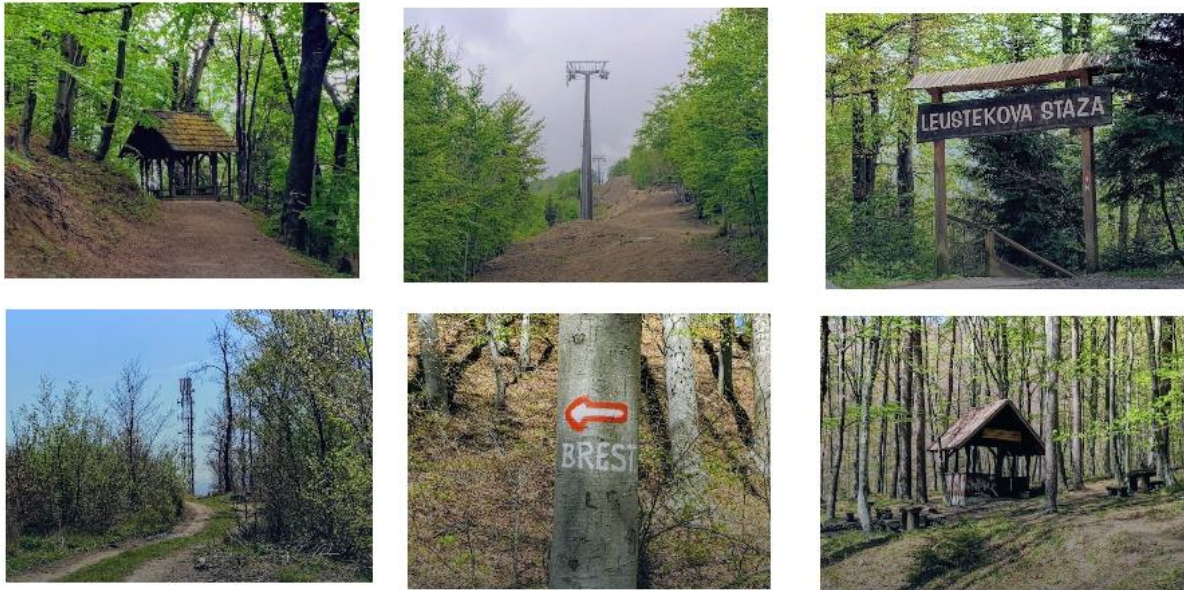
Slika 12. Planinarske staze na Sljemenu