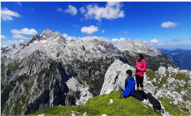
Planinarenje na Julijskim Alpama - Ljubljana