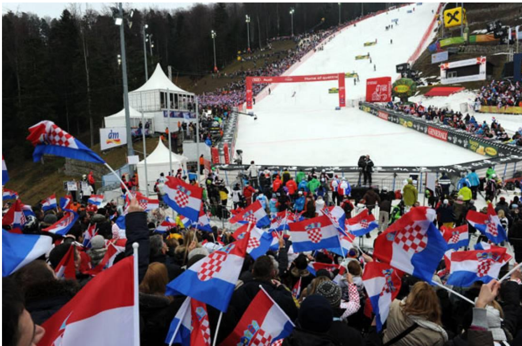
Slika 7. Sportska manifestacija Snow Queen Trophy