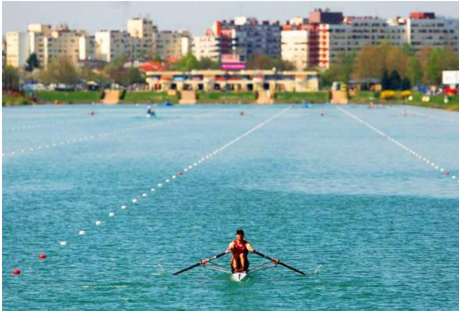
Slika 13. Rekreativno veslanje na Jarunu