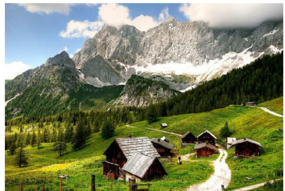
Pješačenje u Gutensteinskim Alpama - Beč