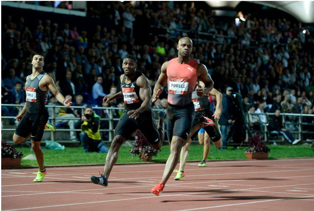
Slika 9. Utrka na 400 metara na Hanžekovićevu memorijalu