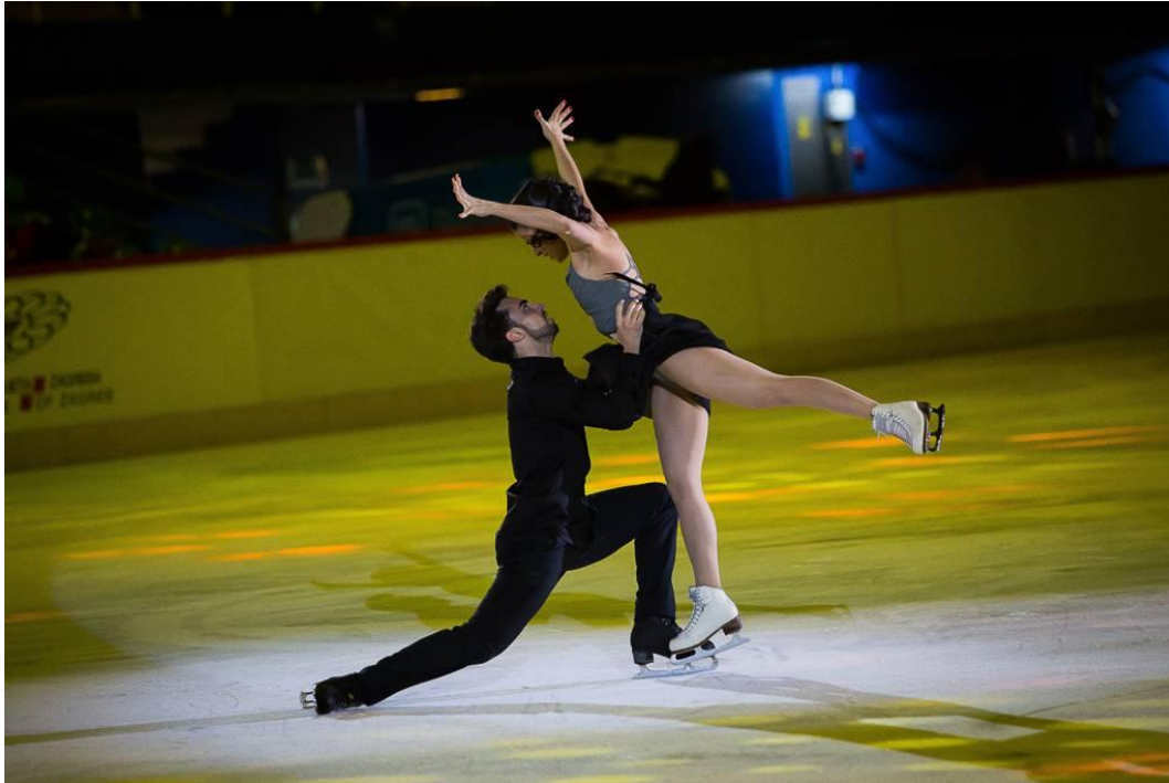
Slika 11. Umjetničko klizanje na manifestaciji Zagrebačka pirueta