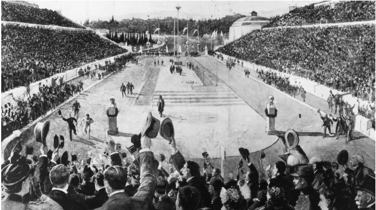
Slika 2. Prvi Olimpijski maraton suvremenog doba