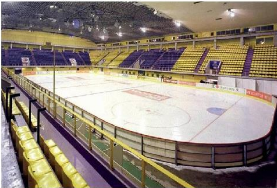
Ledena dvorana Doma sportova