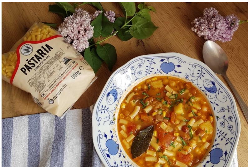
Slika 9. Tradicionalna istarska maneštra od slanutka i fažola