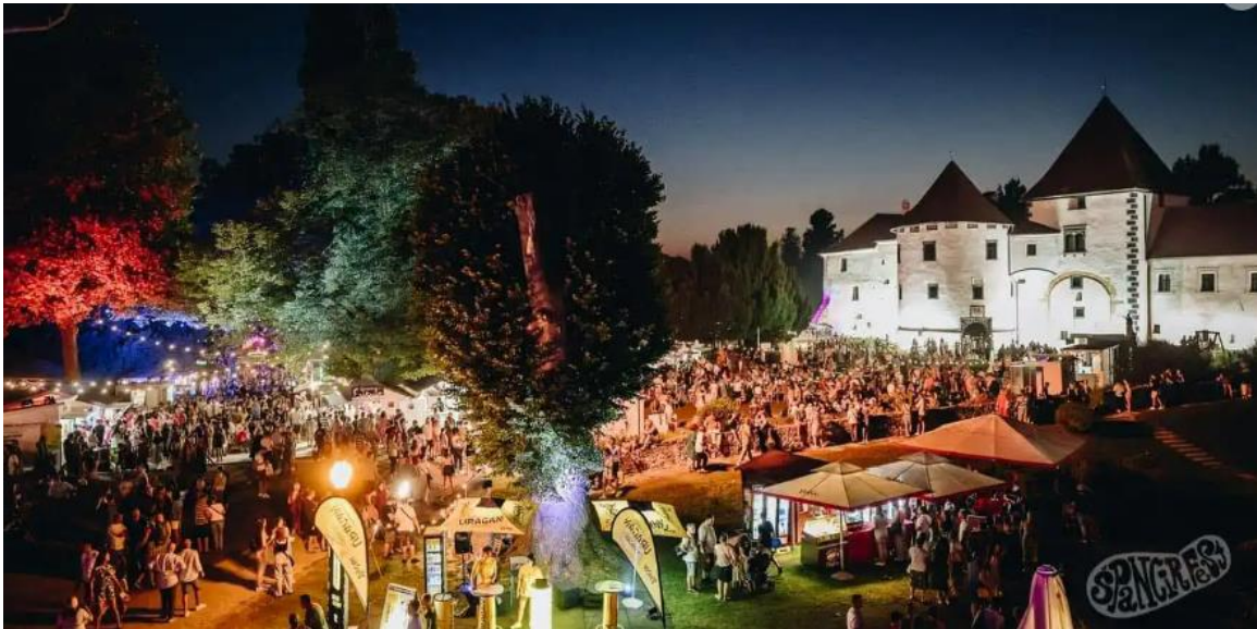
Slika 2. Špencirfest u Varaždinu

Izvor: Hrvatska pošta izradila prigodni poštanski žig povodom 25. obljetnice Špencirfesta - Špencirfest (spencirfest.com) , preuzeto 24.04.2024.