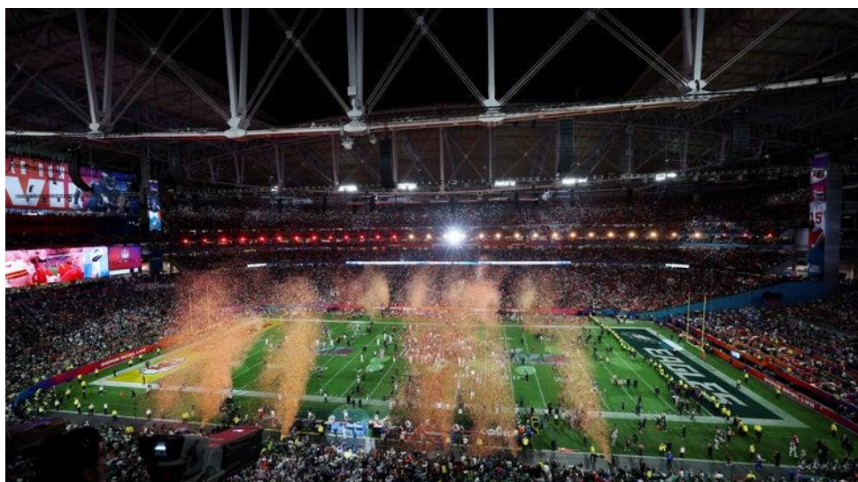
Slika 4. Super Bowl 2023. Glendale Arizona