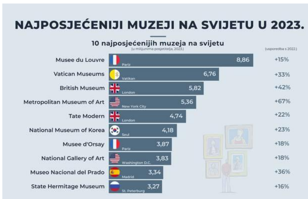
Slika 3. Top 10 najposjećenijih međunarodnih muzeja u 2023.