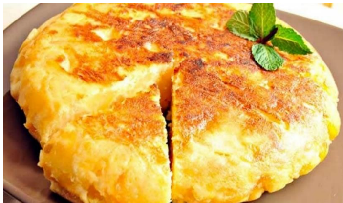
Slika 10. Specijalitet „frico“ specifičan za Friuli-Venezia Giulia

Izvor: Vetrano, A. (2020): Cucina tipica: ricetta tradizionale e varianti del frico, dostupno na https://www.triesteprima.it/social/ricetta-frico.html , pristupljeno 03.05.2024.