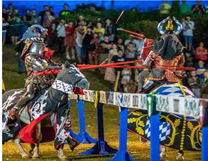
Slika 6. Srednjovjekovni festival, Svetvinčenat