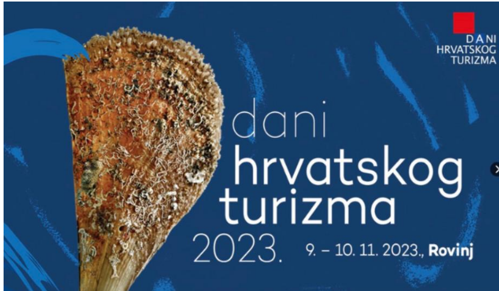
Slika 7. Dani hrvatskog turizma 2023.