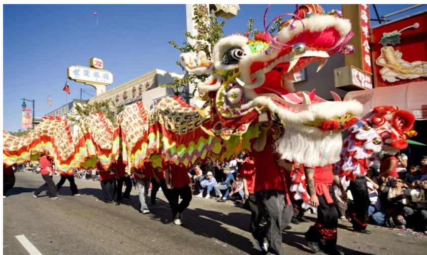
Slika 5. Proslava kineske Nove godine u Los Angelesu

Izvor: Chinese New Year | Summary, History, Traditions, & Facts | Britannica , Pristupljeno: 07.05.2024.