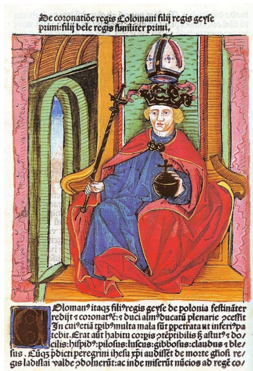
Slika 2. Koloman Arpadović, ugarski kralj 1095.-1116., hrvatski kralj 1102.- 1116., https://hr.wikipedia.org/wiki/Koloman (7. travnja 2024.)