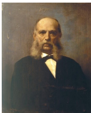
Slika 8. Ivan Mažuranić (1814.-1890.), hrvatski ban, https://enciklopedija.hr/clanak/mazuranic-ivan (19. lipnja 2024.)