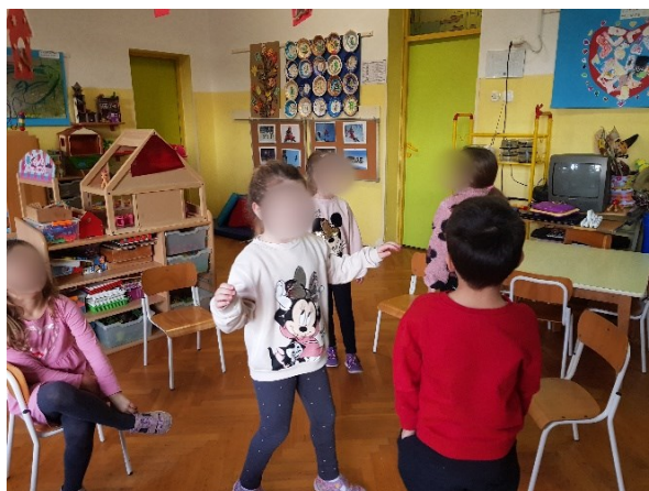
Slika 13. Izražavanje tuge i ljutnje