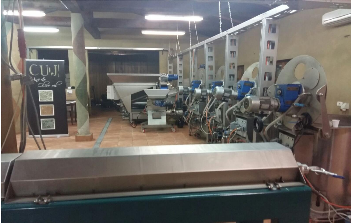
Slika 3. Pogon uljare Cuj

Za sada se njima ne obračunavaju dodatni troškovi, no ukoliko broj zainteresiranih bude opadao, bit će primorani naplaćivati dodatni trošak ili čak prekinuti ekološku proizvodnju. 41