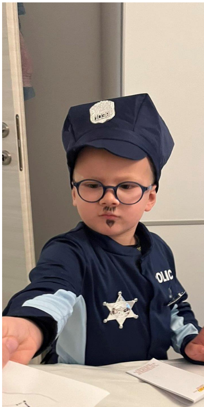
Slika 5. „Policajac“