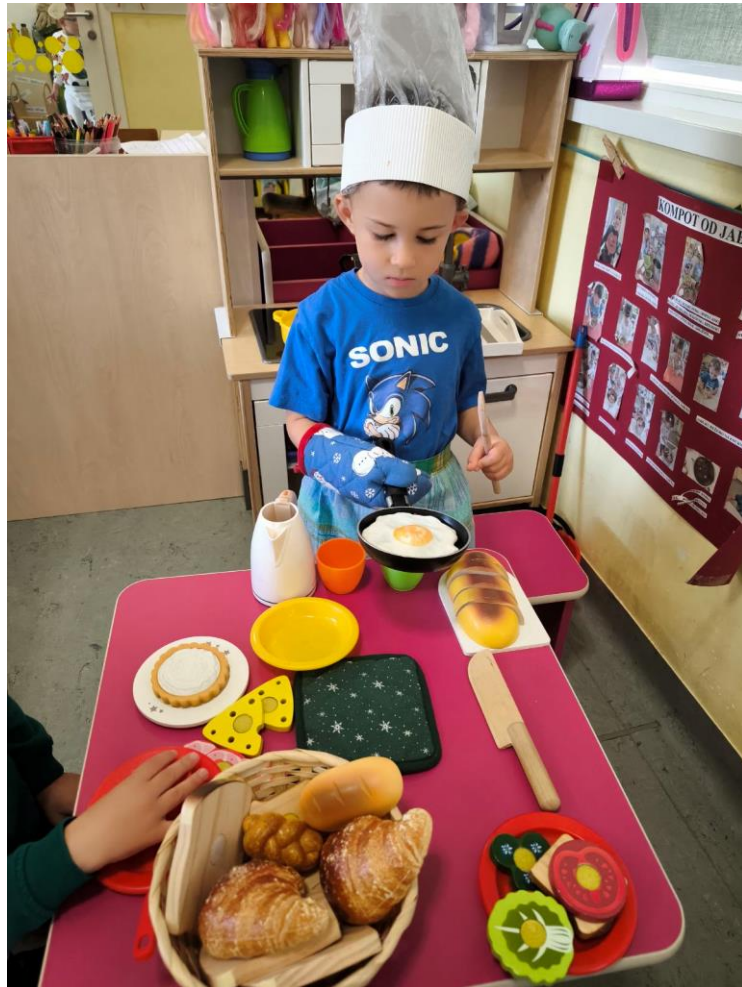
Slika 8. „Kuhar kao moj tata“

Neki dječaci su se pojavili u ulozi čistačica, noseći pregače i kante za smeće. Njihova nova uloga nije bila samo igra, već prilika da shvate važnost čišćenja i održavanja urednosti. S lopaticama i metlama u rukama, pokazali su svoju spremnost za sudjelovanje u kućanskim poslovima.