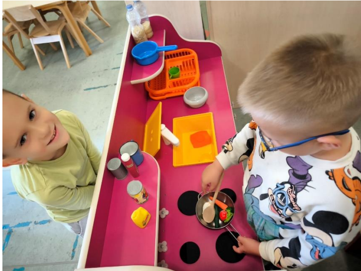
Slika 3. „Kuhar i konobar“