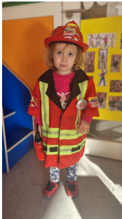
Slika 7. „Vatrogasac“