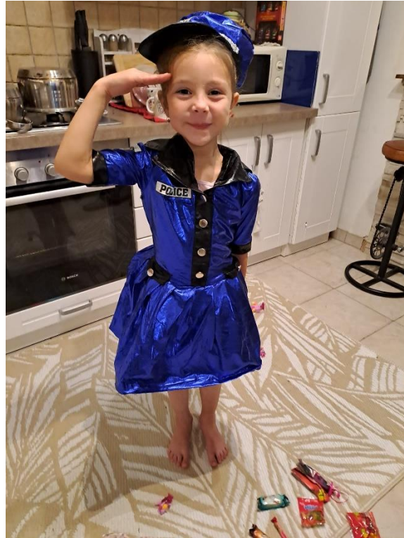
Slika 6. „Policajka“