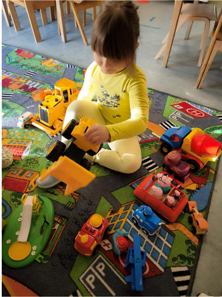
Slika 4. „Zamjena centara“