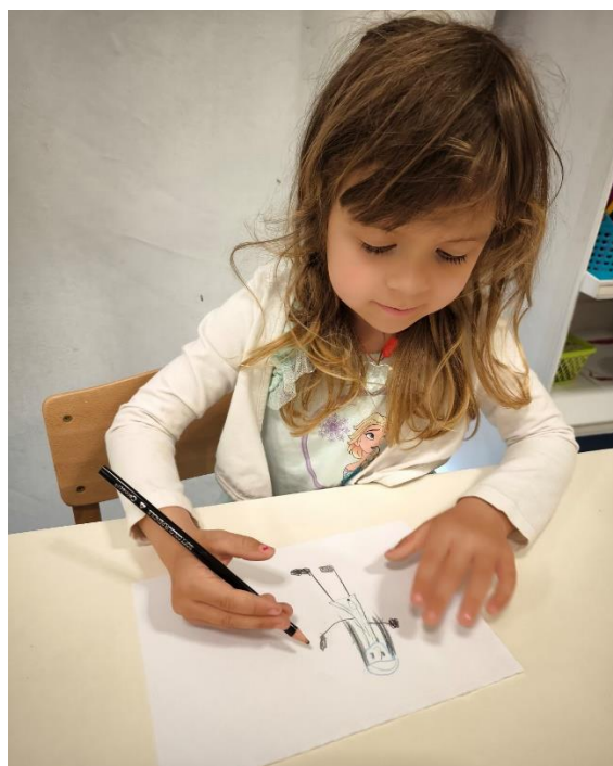
Slika 1. "Čovjek i žena"

U likovnom centru, djeca su pokazala svoju kreativnost crtajući zanimanja. Boje su se miješale na papirima dok su djeca stvarala svoje vizije budućih zanimanja. Neki su crtali vatrogasce s velikim crijevima, dok su drugi crtali astronaute s raketama.