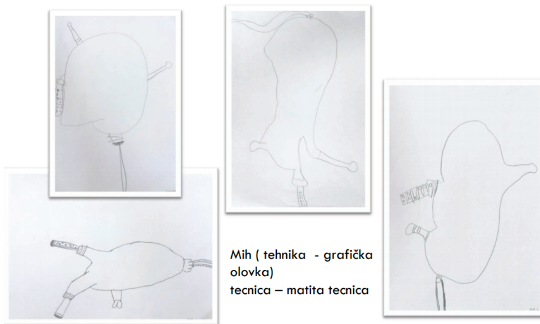
Slika 11. Mih

Djeca (slika 11) crtala su mih grafičkom olovkom tako što su gledala u njega.