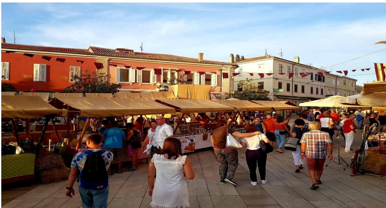
Slika 2. Sajam Giostre