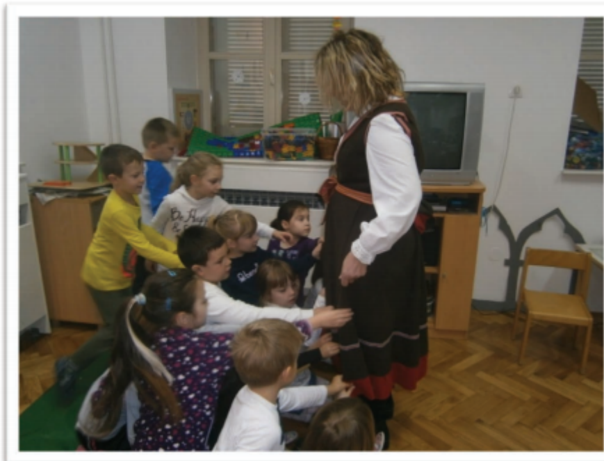
Slika7. Demonstracija narodne nošnje

Istarska narodna nošnja jednostavna je i praktična, pogodna za nošenje čak i danas te djeluje prema motu „manje je više“. Žene su uvijek pokrivale glavu maramom (čak. fačolom ili facolom ) pri čemu je boja marame imala određeno značenje. Bijele marame nosile su se prilikom svečanosti, crne su nosile udovice, crvene su označavale slobodne djevojke, a plave i zelene udane žene. Preko košulje (čak. stomanje ) od konopljinoga platna, žene su nosile vunene haljine (čak. brhane ), vuneni pojas ( pas ), pamučnu pregaču (čak. traversu ), kratki pleteni kaput (čak. maju ), a u svečanim prilikama sukneni kaputić (čak. kamižolin ili kamižolu ), zatim pleteni ogrtač (čak. šijal ) i pletene čarape (čak. bičve ) te hlače (čak. holjeve ).