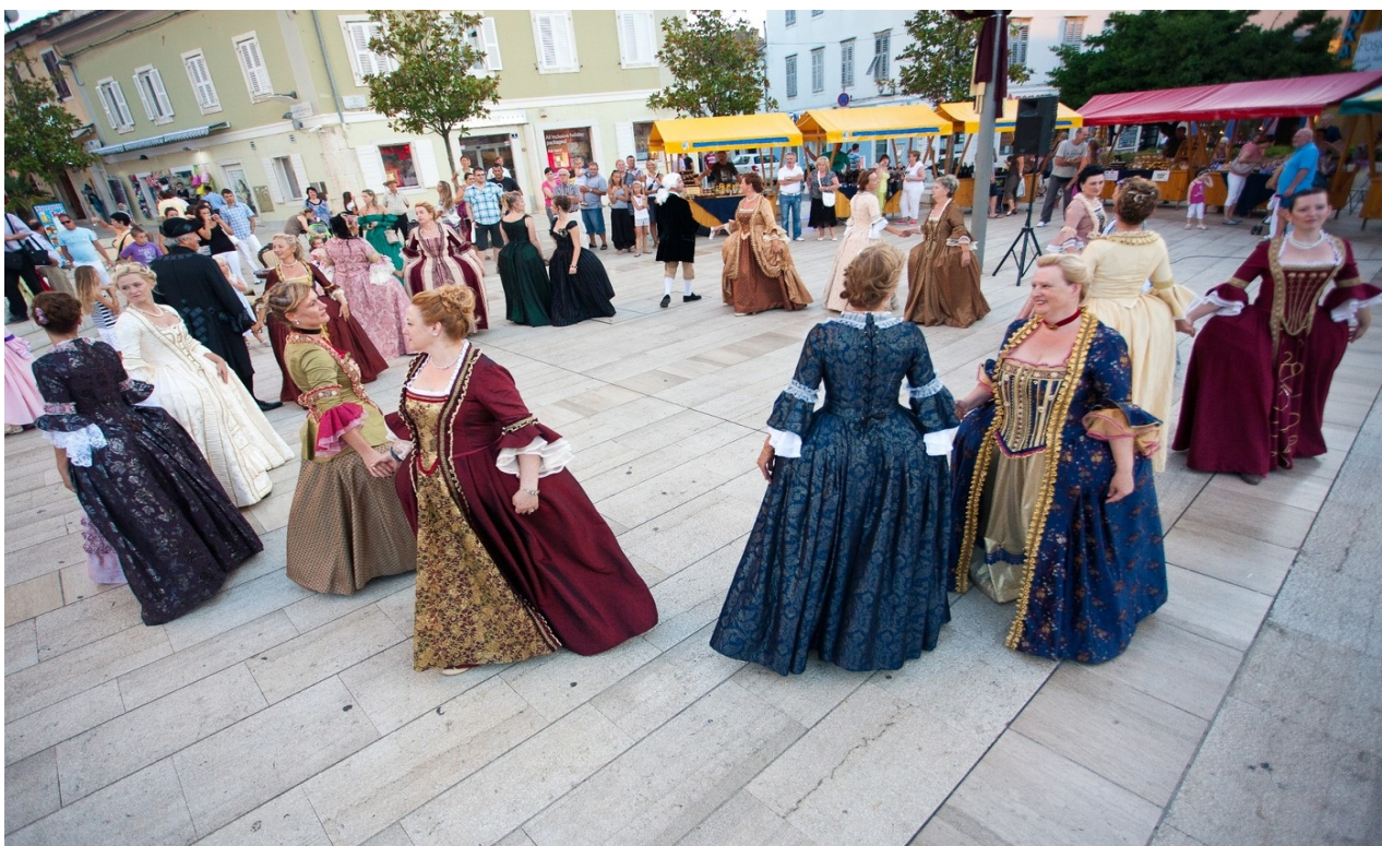
Slika 3. Giostra