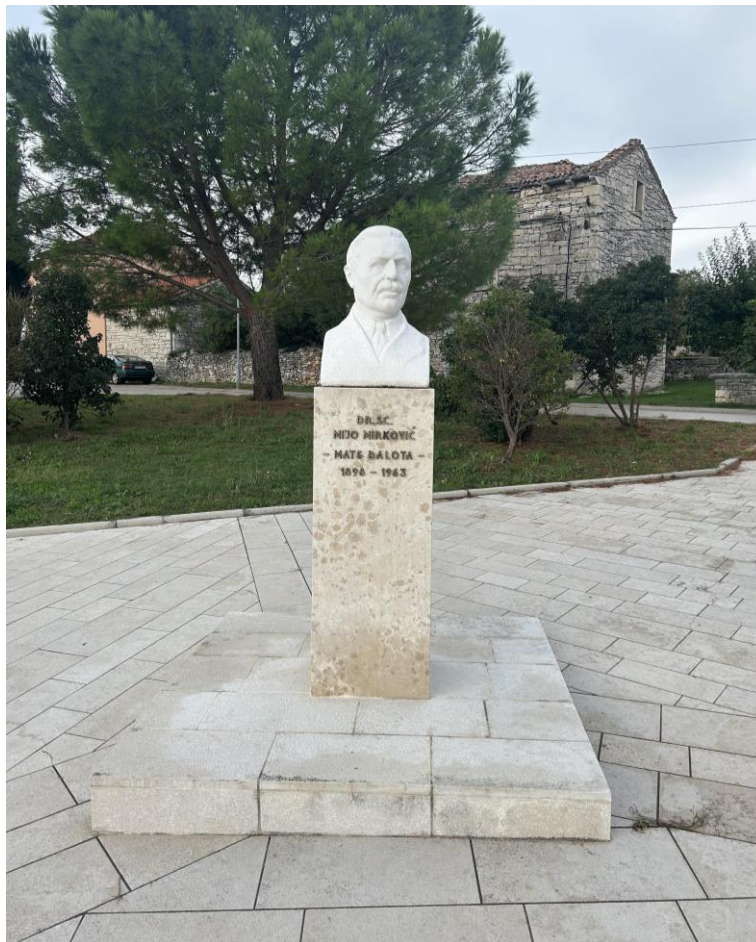
Slika 13. Spomenik posvećen Miju Mirkoviću; vlastita fotografija, 2023.

Rakalj se smatra mitskim mjestom istarskog poluotoka jer se tu rodio Mijo Mirković (Mate Balota) i jer je on stvarao koristeći se jezikom i ambijentalnim osobinama svojeg zavičaja. U centru naselja podignut je i spomenik posvećen Mati Baloti te se njegova rodna kuća prenamijenila u muzej.