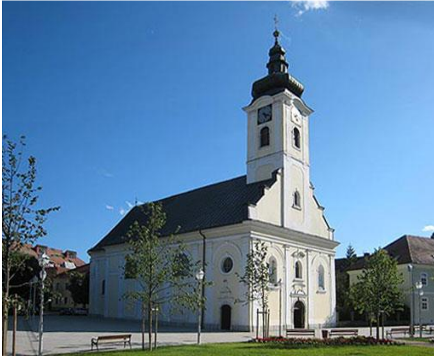
Slika 6. Crkva sv. Križa