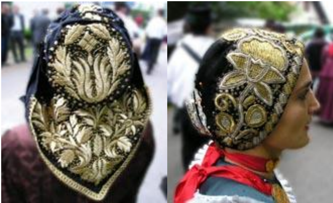
Slika 6. Zlatovez

Zlatovez se često koristi za ukrašavanje tradicionalnih nošnji, posebice za svečane prigode poput vjenčanja ili folklornih nastupa, ali se može primijeniti i na razne druge tekstilne proizvode kao što su stolnjaci, jastučnice ili zavjese. Ova tehnika također igra važnu ulogu u očuvanju lokalnog identiteta i kulturne baštine, čineći je važnim dijelom kulturnog nasljeđa Hrvatske. 36