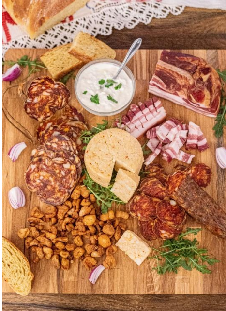
Slika 8. Gastronomija Slavonije

U slavonskoj tradiciji posebno mjesto zauzimaju razni kolači i slastice poput štrudli, buhtli, paprenjaka, orahnjače i makovnjače. Ovi slatkiši često se pripremaju u obiteljskim domovima tijekom blagdana i posebnih prigoda, čuvajući tako tradicionalne recepte i tehnike pečenja.