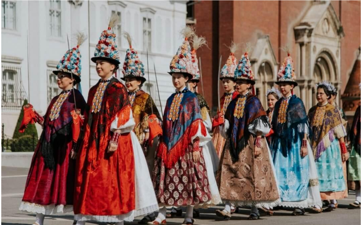
Slika 3. Đakovački vezovi