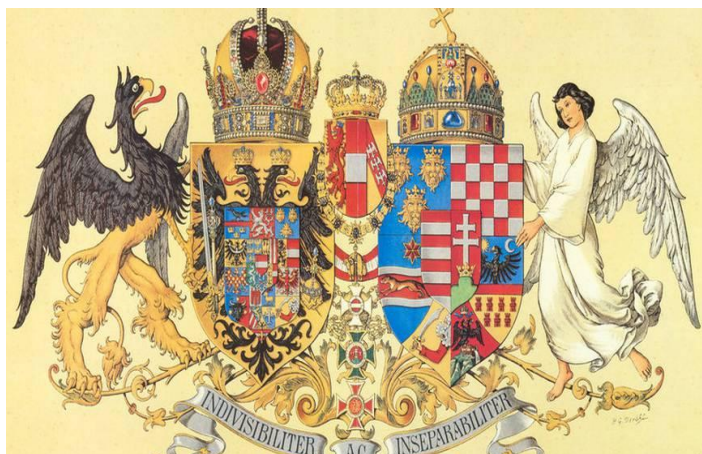
Slika 1. Grb Austro – Ugarske Monarhije