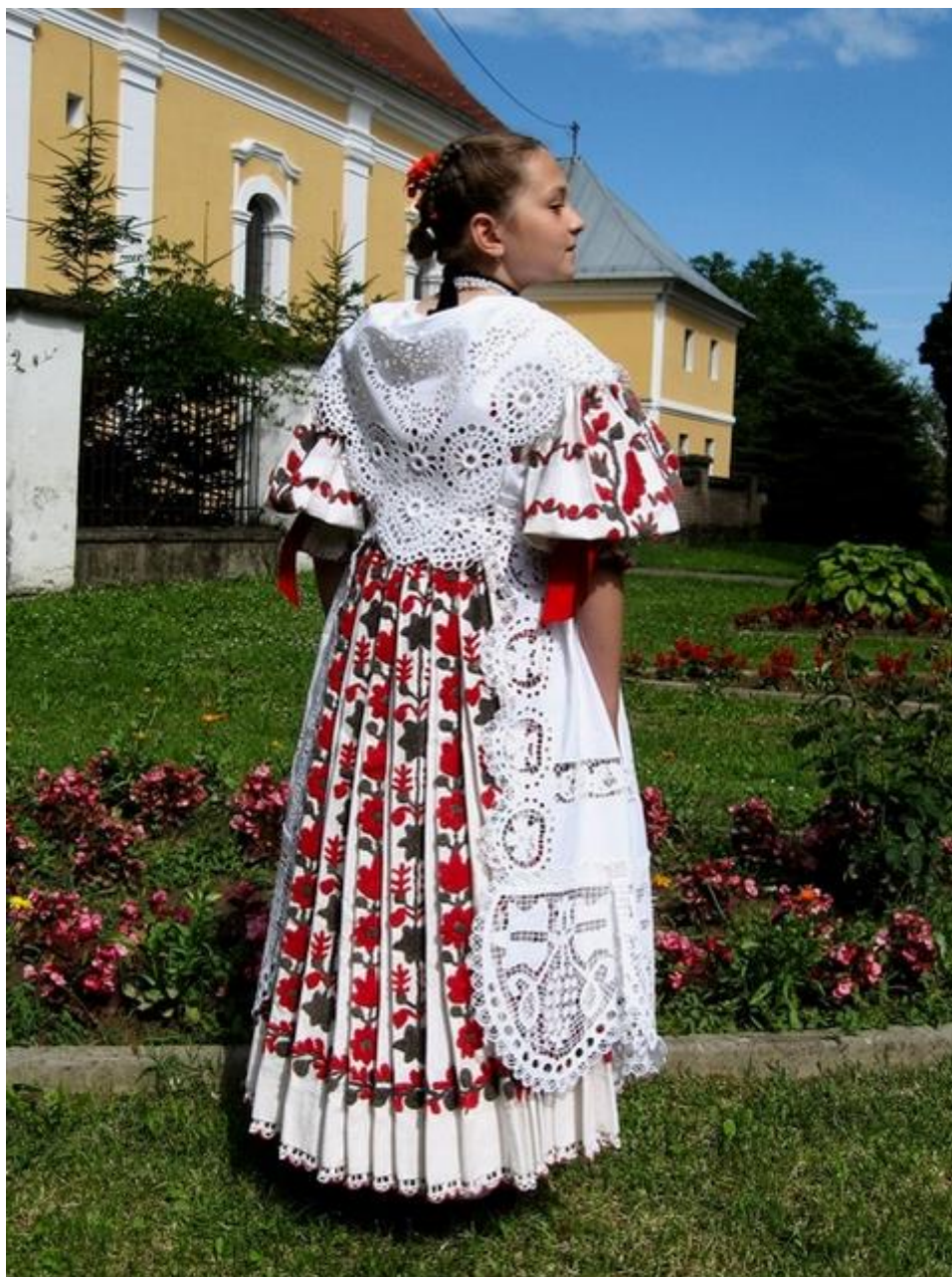
Slika 5. Ženska narodna nošnja