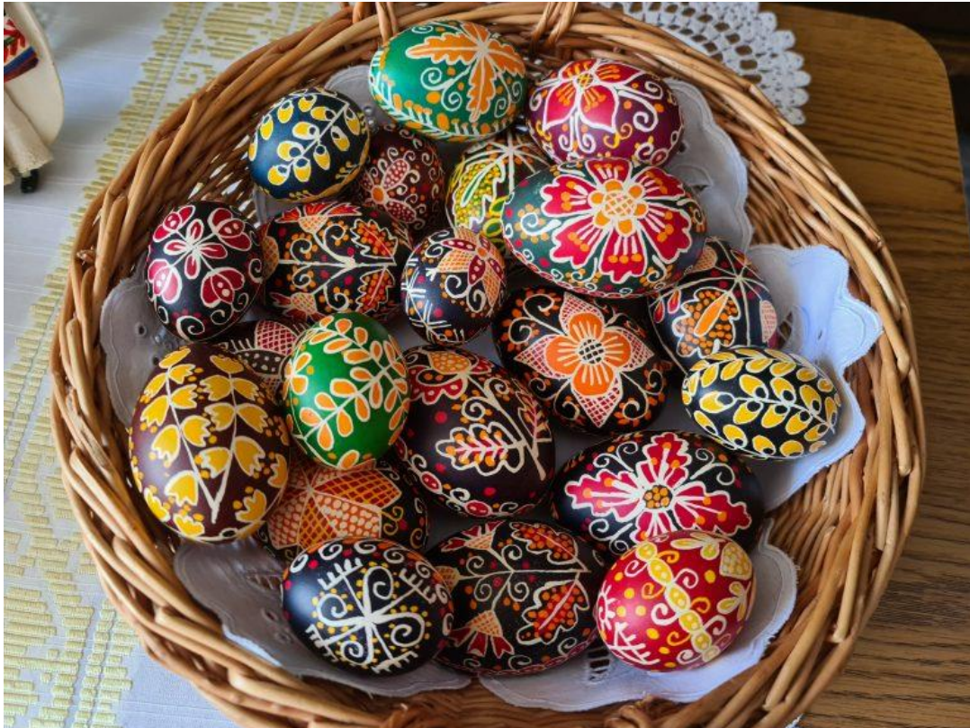
Slika 2. Uskrсне pisanice

Pisanice se i dalje daruju kao simbol prijateljstva i dobrih želja, a često se koriste i kao dekoracija za uskrсне stolove i domove. Lov na uskrсна jaja, popularna igra među djecom, postala je dio slavonskih običaja, gdje djeca traže skrivene pisanice po kući ili dvorištu.