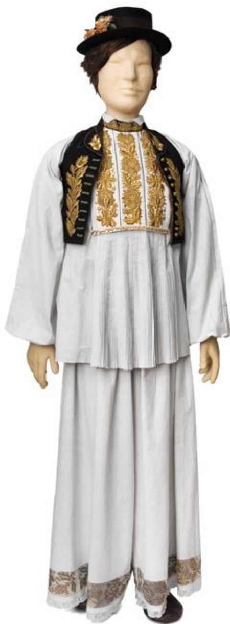
Slika 4. Muška narodna nošnja