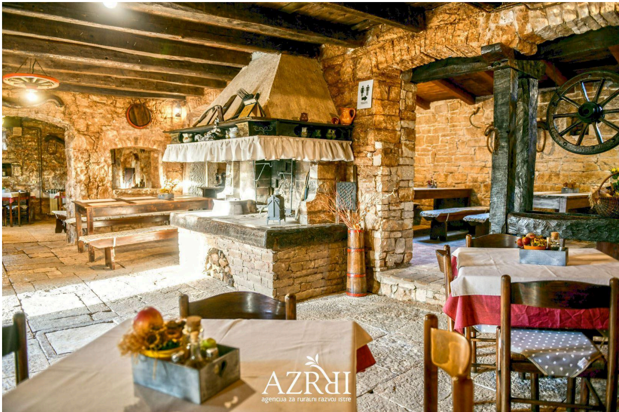
Slika 17. Izgled interijera Agroturizma Pod čeripnjon