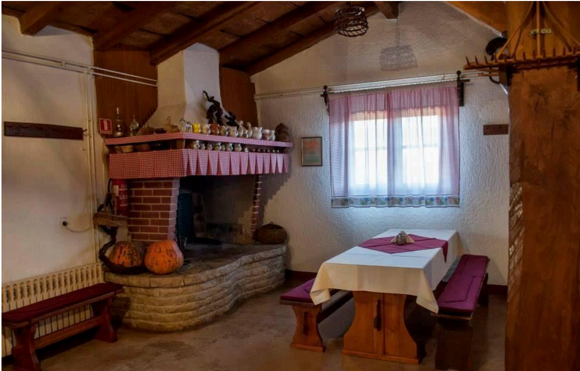
Slika 16. Izgled interijera Agroturizma Dušani