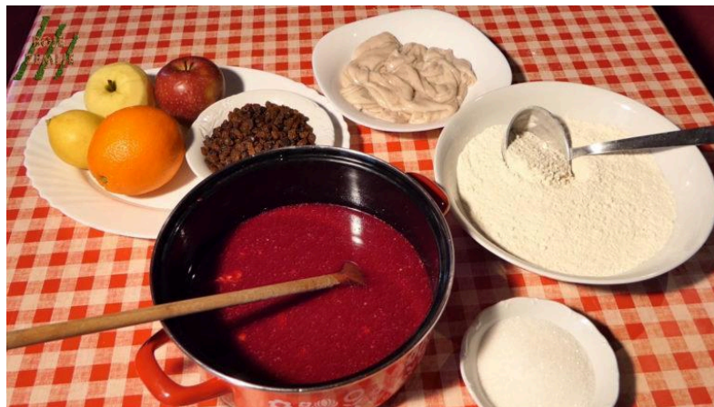
Slika 7. Sastojci potrebni za pripremu krvavica

šugu, s palentom ili pasuticama . Od priloga se najčešće javlja broskva, također spravljena na razne načine: u padeli , s pasuticama , krumpirima i slično. Kiseli kupus poslužuje se s junećim rebrima i pancetom, kobasicama ili svinjskim kostima. Zima je vrijeme kolinja, stoga se u tom periodu pripremaju jela od svinjskoga mesa. Najpoznatiji je, svakako, već spomenuti istarski pršut, čija priprema iziskuje mnogo posvećenosti i znanja kako bi kvaliteta proizvoda bila na visokoj razini. Tijekom kolinja pripremaju se jela poput blatnih fuži i crne palente , a specifična su po tome što je jedan od sastojaka svinjska krv. Primjerice, jelo blatni fuži sastoji se od svinjskog mesa, masti, lovora, ružmarina, luka, soli, papra, crnog vina, vode i krvi, koje se izmiješaju i dodaju pečenom mesu, što se kasnije dodaje fužima . 27 Od svinjske se krvi također pripremaju krvavice ili mulice , a sastojci potrebni za njihovu pripremu prikazani su na slici 7.