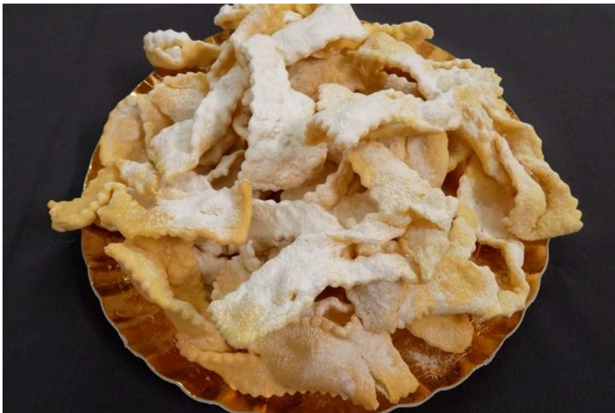
Slika 8. Kroštule

dodavale grožđice. Za sjevernu Istru karakteristične su i landice , jelo koje se priprema uz pomoć kruha, koji se umače u smjesu jaja i mlijeka te se potom prži u ulju. Ovo jelo ima različite nazive diljem Istre, pa je tako poznato i pod nazivima motanice i kušini . Dakako, neizostavno je spomenuti kroštule , jednu od karakterističnih istarskih poslastica, prikazanu na slici 8. Ime su dobile po tome što su vrlo hrskave i prilikom konzumacije hrskaju pod zubima. 30 One se učestalo pripremaju u vrijeme pusta, odnosno na pusni utorak.