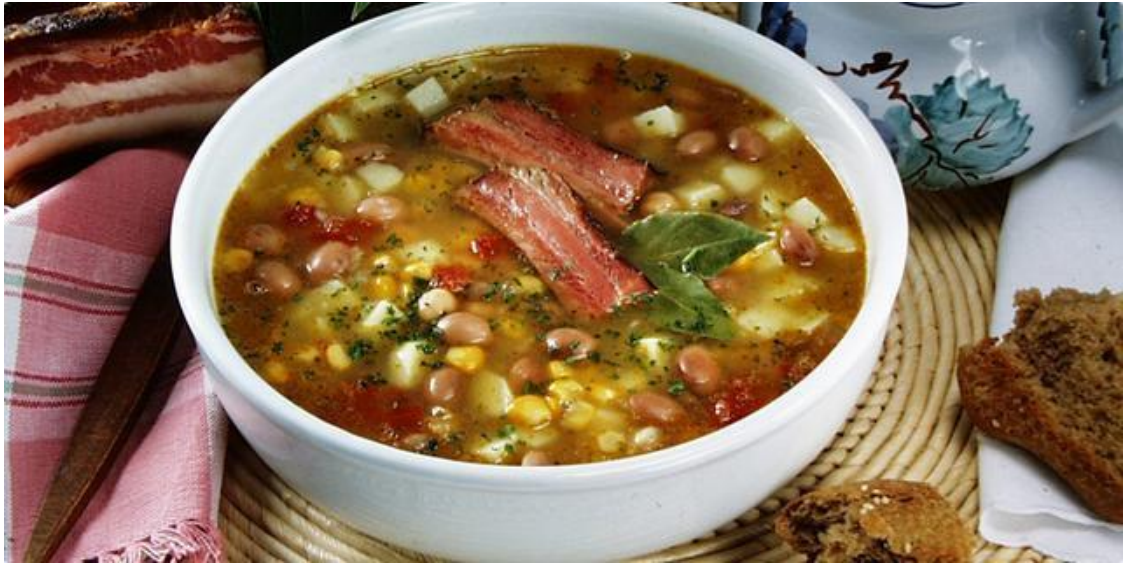
Slika 1. Manestra s bobici