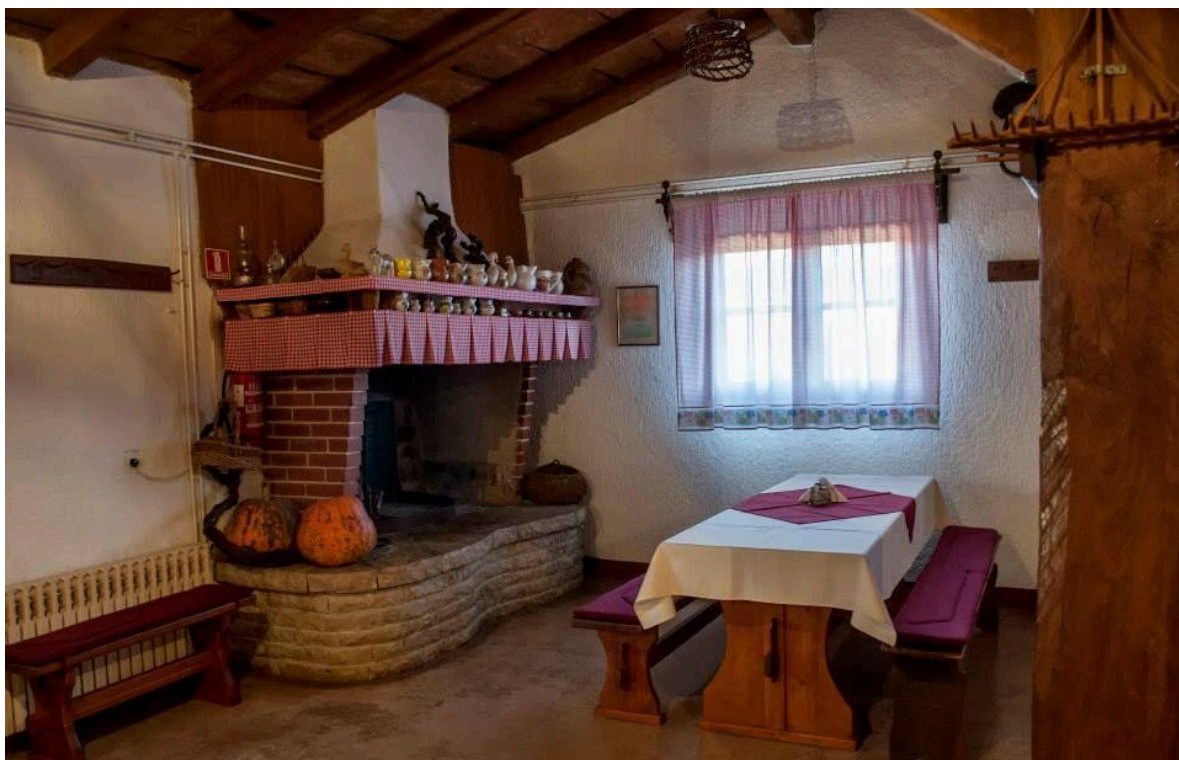
Slika 16. Izgled interijera Agroturizma Dušani