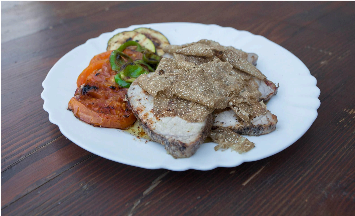
Slika 15. Tradicijsko jelo u ponudi Agroturizma Tikel