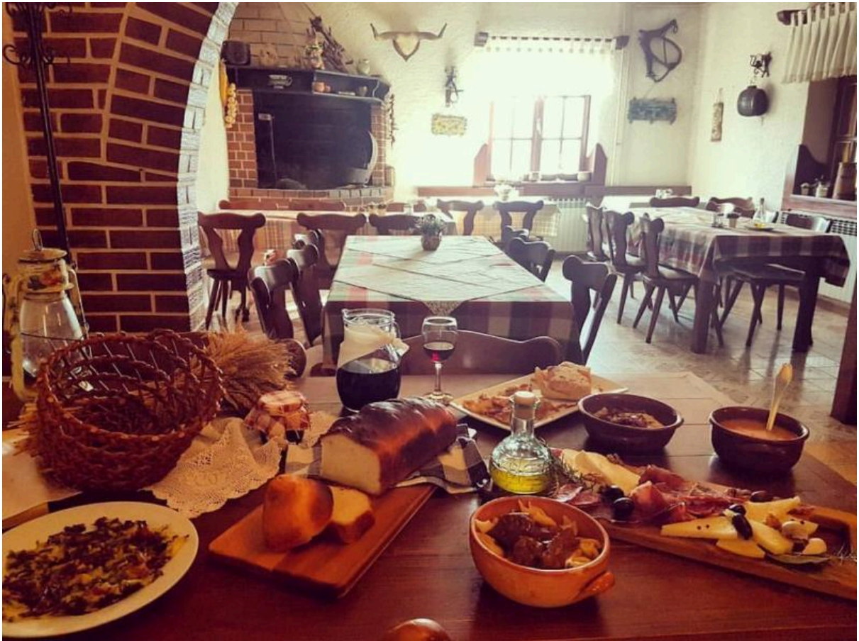
Slika 12. Izgled interijera Boljunske konobe

slici 12. Boljunska konoba može se smatrati dobrim primjerom njegovanja tradicije, što pridonosi njezinoj valorizaciji. Turisti, ali i svi posjetitelji, imaju priliku upoznati tradicijsku istarsku hranu pripremljenu na autohton način, što zasigurno pridonosi pozitivnom imidžu na turističkom tržištu.