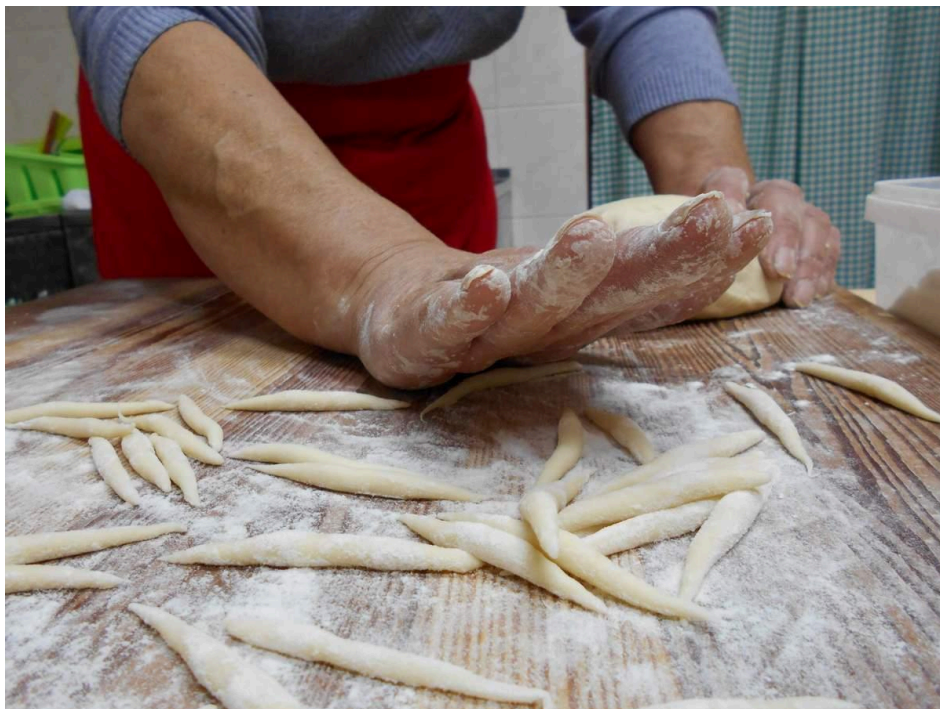
Slika 2. Izrada pljukanaca

pomiješalo s kukuruznim. Osim kruha, istarska gastronomija uključuje razna jela od tjestenine. Jedno od njih su njoki ili žličari , koji se pripremaju od posoljenog tijesta s krumpirom i žlicom se stavljaju u vodu, na što upućuje njihov naziv. Posutice su još jedna vrsta tjestenine, koja se priprema u Istri, a tijesto se reže na kvadratiće, te se ponekad nazivaju i krpice . Karakteristično jelo su i fuži , tjestenina koja se priprema tako da se tijesto izreže u oblik romba i potom se omota oko drvenog štapića ili nečeg sličnog. Osim fuža pripremaju se i lasanje , tjestenina u obliku tankih, dugačkih trakica. Neizostavno je spomenuti pljukance , prikazane na slici 2., koji se pripremaju na način da se tijesto valja među dlanovima.