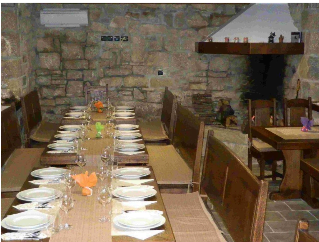
Slika 14. Izgled interijera Agroturizma Stara štala

Agroturizam Stara štala nalazi se u mjestu Sandalji nedaleko Cerovlja. Ovo je ujedno obiteljsko poljoprivredno gospodarstvo koje se već generacijama bavi uzgojem i prodajom povrća i uzgojem životinja. God. 2012. otvoren je i restoran u kojem se služe tradicijska istarska jela, pripremljena prema obiteljskoj tradiciji. Neka od jela u ponudi su pršut, sir, suhe kobasice kao predjela, ombolo , kiseli kupus, kobasice, krumpir kao glavna jela te fritule i orahnjača kao deserti. Osim tradicijskih jela, sam objekt uređen je vrlo rustikalno, kao i interijer u kojem se nalazi ognjište, a svi zidovi su kameni, što je vidljivo na slici 14.