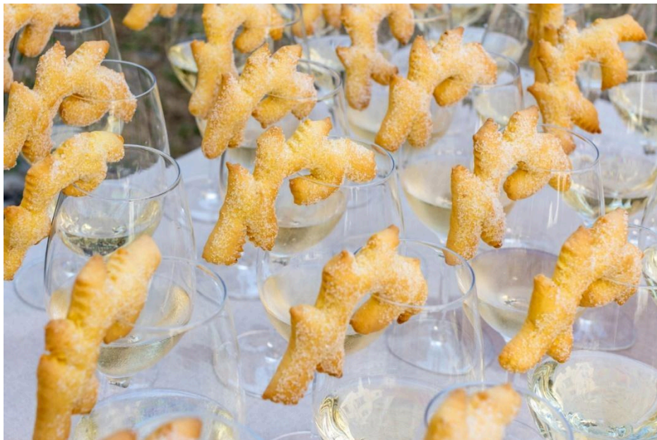
Slika 9. Pazinski cukerančići

zaštićenog nematerijalnog kulturnog dobra upisom na Listu zaštićenih kulturnih dobara 2017., pazinski je cukerančić. Njegova priprema prenosila se s koljena na koljeno i očuvala sve do danas. Tradicijski recept uključuje jasno definirane sastojke, koji odražavaju specifičnost ove slastice. Cukerančići se pripremaju uz pomoć amonijaka, koji se koristi za dizanje tijesta, a nakon pečenja umaču se u istarsku malvaziju i posipaju šećerom. Osim posebnosti sastojaka, oni se oblikuju u specifičan, razgranati oblik, koji je moguće uočiti na slici 9. Cukerančići su se najčešće pripremali za svadbene svečanosti, a ujedno odražavaju identitet stanovnika toga područja. Njihova je priprema danas znatno raširenija, ali se svakako nastoje očuvati lokalne specifičnosti, uz sprječavanje komercijalizacije ovog kulturnog dobra. 31