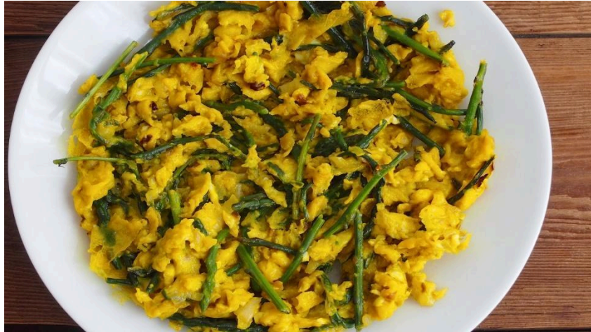
Slika 4. Fritaja sa šparogama

od sipa, fritaje s morskim pužićima, kuhane rakovice s tjesteninom, pljukanaca sa šparugama, kozicama i škampima, salate od sipa i slanah srdela. 24 Proljeće je poznato po berbi šparoga, koje se vrlo dobro uklapaju u razna jela, od fritaja i juha, do šuga , tjestenine i salate.