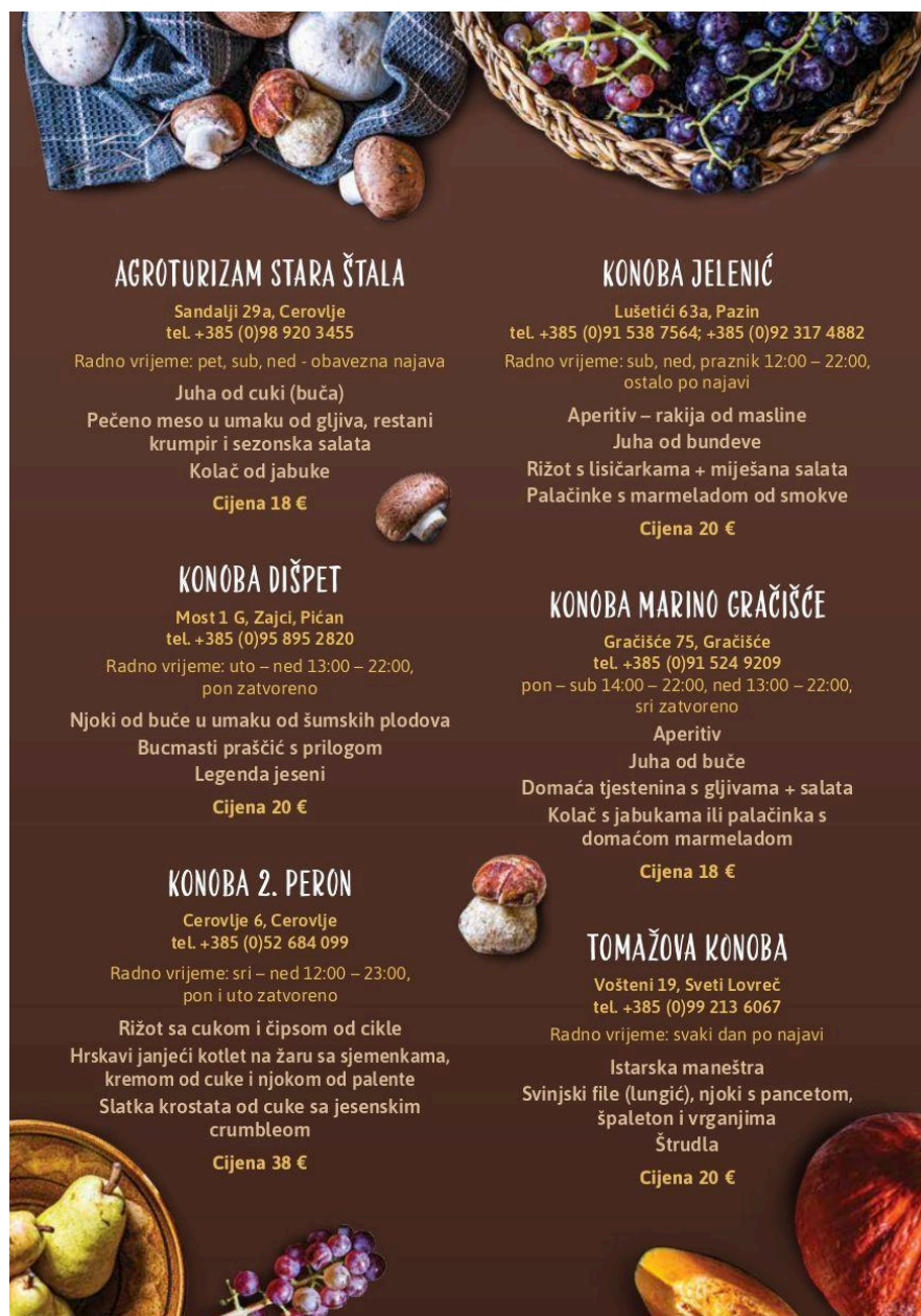
Slika 13. Ponuda jela u sklopu manifestacije Jesen na pijatu u središnjoj Istri