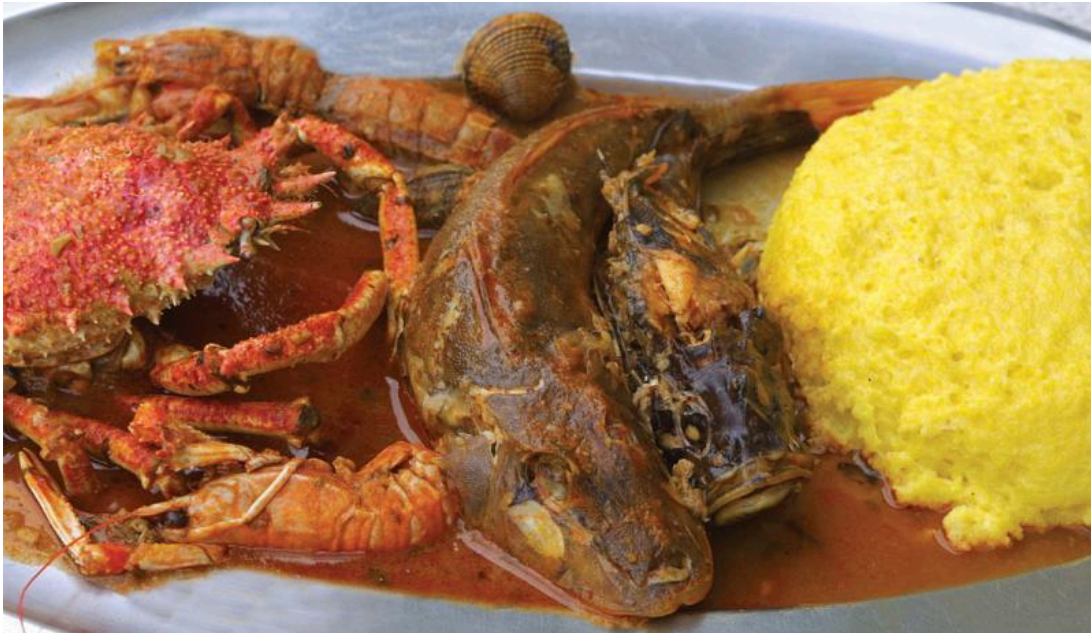
Slika 3. Tradicijski istarski brodet