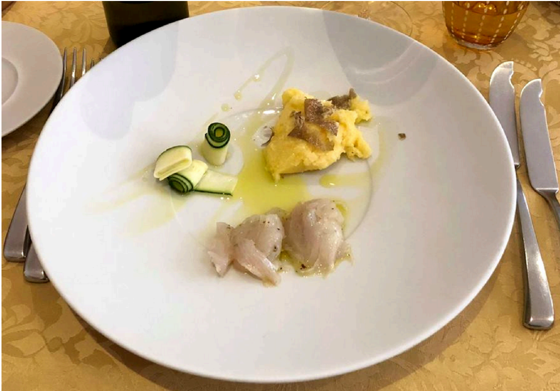
Slika 11. Sirova riba s palentom i tartufom