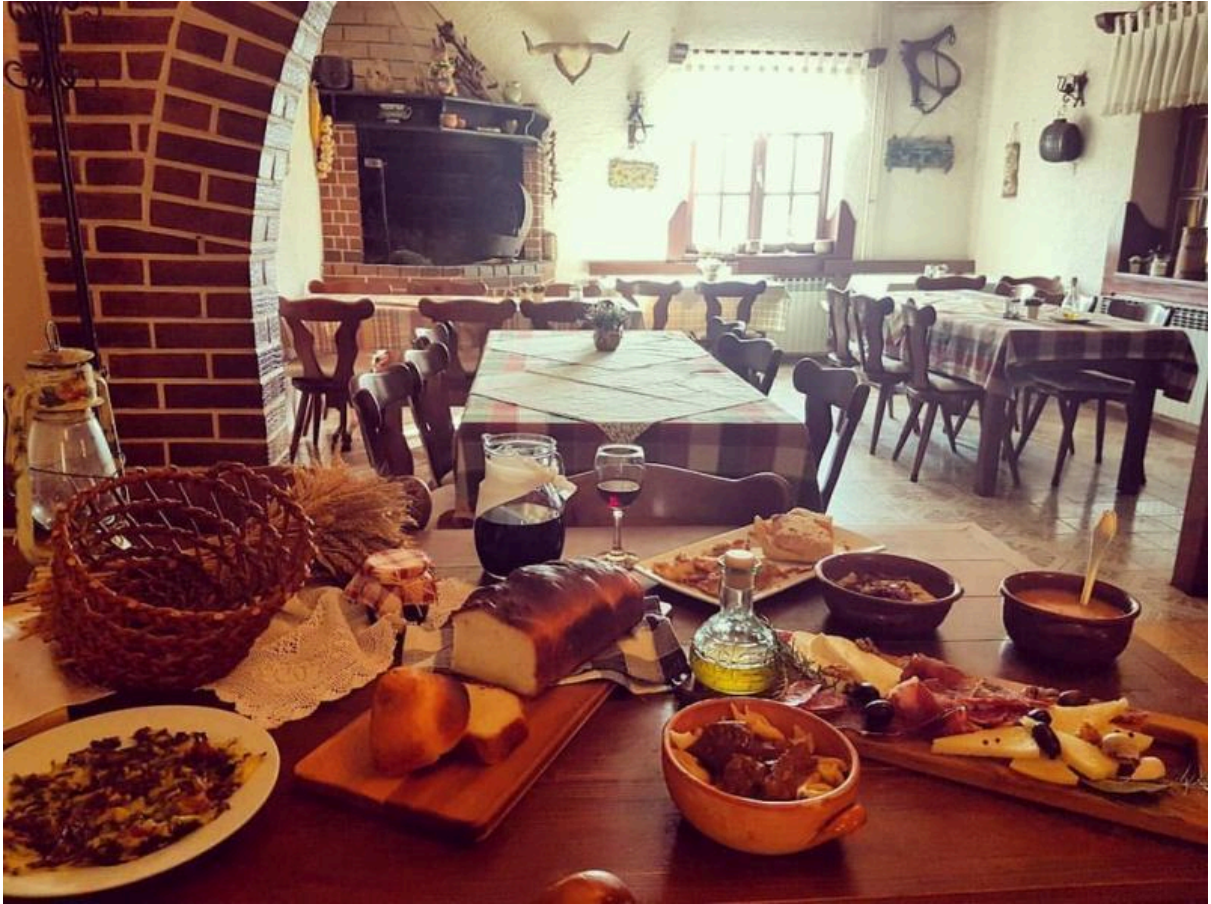
Slika 12. Izgled interijera Boljunske konobe

slici 12. Boljunska konoba može se smatrati dobrim primjerom njegovanja tradicije, što pridonosi njezinoj valorizaciji. Turisti, ali i svi posjetitelji, imaju priliku upoznati tradicijsku istarsku hranu pripremljenu na autohton način, što zasigurno pridonosi pozitivnom imidžu na turističkom tržištu.