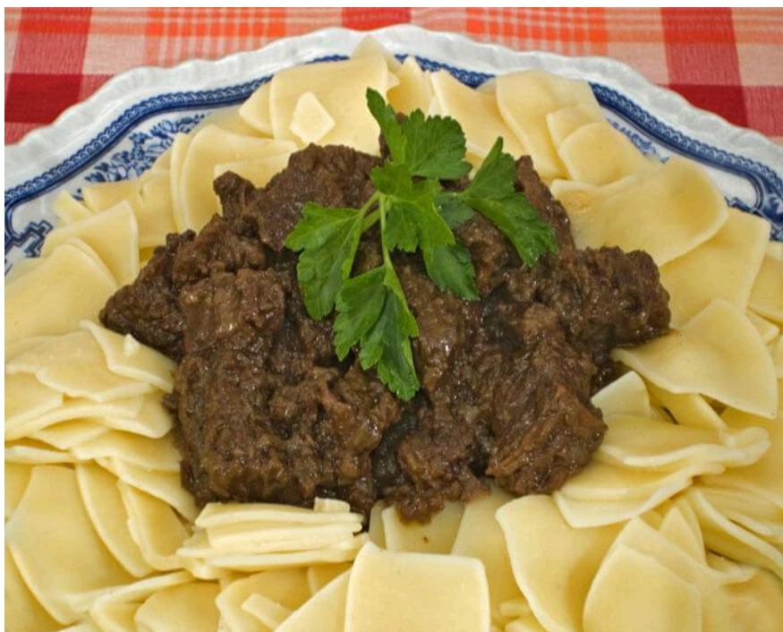
Slika 6. Pasutice sa šugom od boškarina