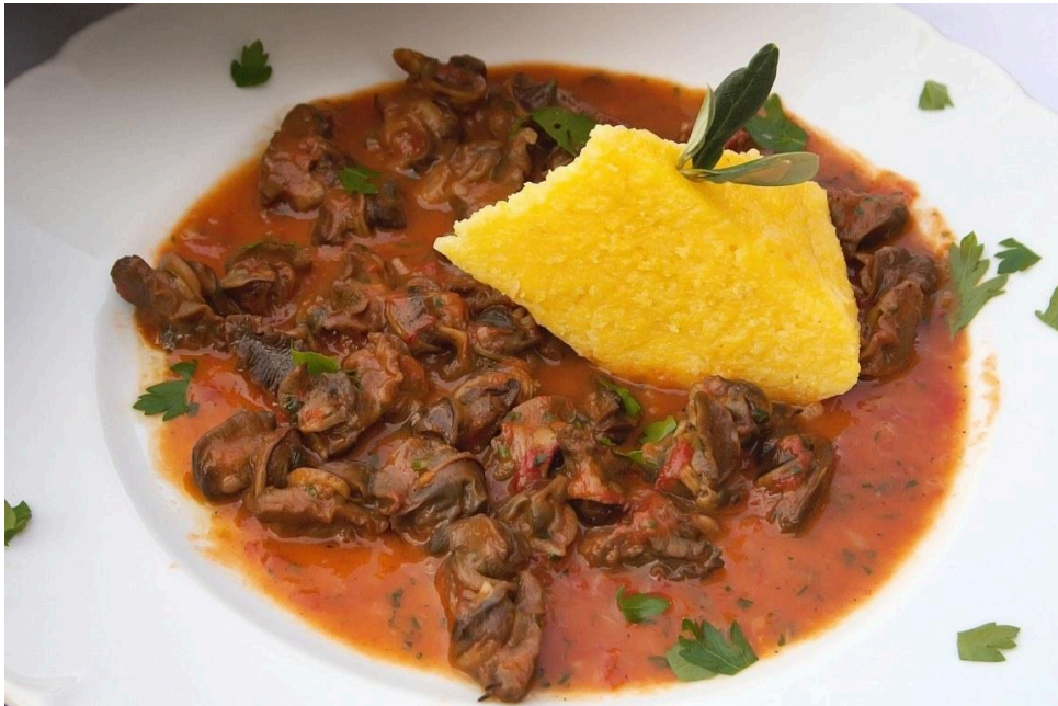
Slika 5. Puževi ( ćoki ) s palentom

Galižani oni pripremaju s palentom te ih nazivaju ćoki , a izgled ovog jela prikazan je na slici 5. 25