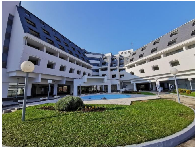
Slika 11 Specijalna bolnica za medicinsku rehabilitaciju Varaždinske Toplice

Osoblje Specijalne bolnice za rehabilitaciju sastoji se od medicinskih specijalista, neurologa, fizioterapeuta, medicinskih sestara, specijalista fizikalne medicine i rehabilitacije, logopeda, psihologa te raznog nemedicinskog osoblja. Za lječilišne potrebe, poput hidroterapije, koristi se sumporna hipertermalna voda koja se upotrebljava za punjenje termalnih bazena. U rekreacijskim bazenima, termalna voda se miješa s vodovodnom vodom kako bi se rashladila. 24