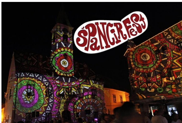
Slika 17 Špancirfest