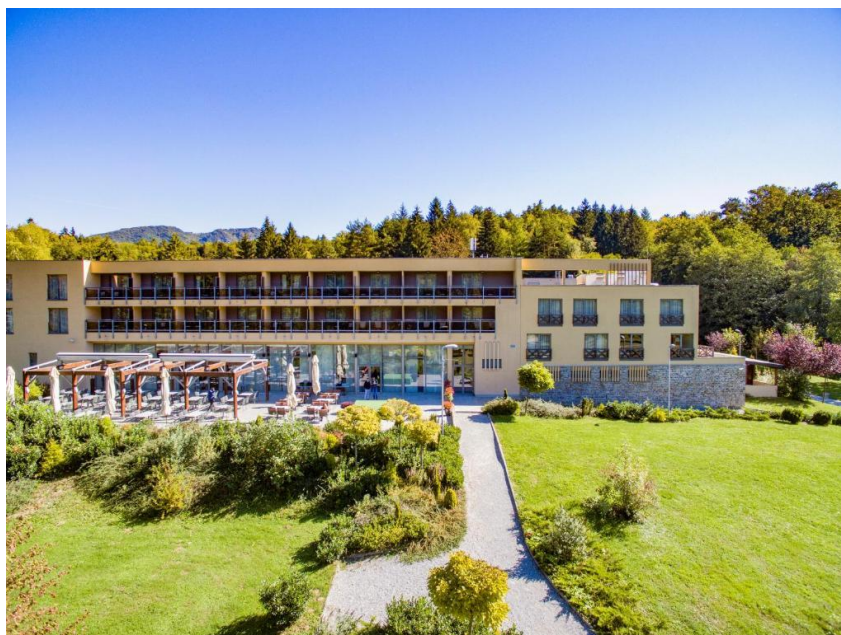
Slika 6 Hotel Trakošćan