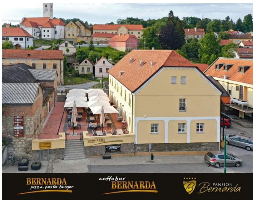
Slika 7 Pansion Bernarda Nova