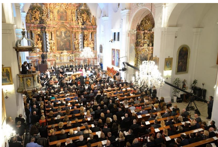
Slika 13 Varaždinska katedrala

Osim Starog Grada treba istaknuti i Varaždinsku katedralu, jednu od najvažnijih ranobaroknih sakralnih građevina u sjevernoj Hrvatskoj izgrađena je između 1642. i 1646. godine od strane isusovca. Ovaj red, koji je značajno doprinio katoličkoj obnovi u 16. i 17. stoljeću, nastanio se u Varaždinu 1632. godine i otvorio gimnaziju 1636. godine ( sl. 13).