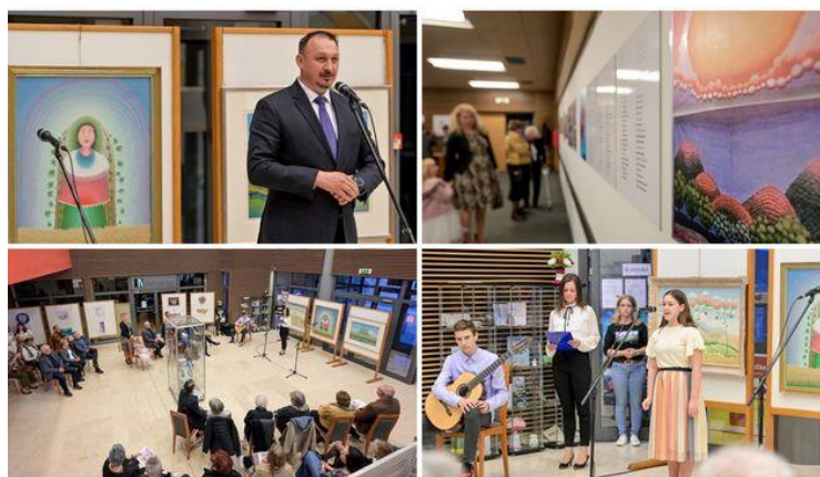
Slika 18 Rabuzinovi dani u Novom Marofu

Još jedna od manifestacija u Varaždinskoj županiji su Rabuzinovi dani u Novom Marofu, to je kulturna manifestacija posvećena liku i djelu Ivana Rabuzina, jednog od najpoznatijih hrvatskih slikara koji je rođen u ovom gradu. Ova manifestacija slavi umjetnički doprinos Rabuzina i promiče kulturno stvaralaštvo kroz niz događanja koja okupljaju umjetnike, ljubitelje umjetnosti i javnost (sl. 18).