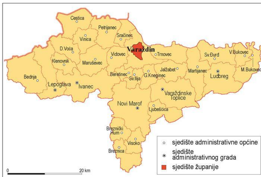
Slika 3 Položaj Varaždinske županije

Ivanec, Lepoglava, Ludbreg, Novi Marof i Varaždinske Toplice. 11 Ivanec je najveći grad Županije prema površini stanovnika koja iznosi 111,75 km 2 , te broju naselja (29), dok je najveća općina Bednja (78,01km 2 ), a najmanja Beretincec (12,40 km 2 ). 12