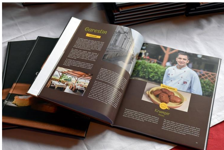
Slika 20 Knjiga "Okusi varaždinskog kraja"