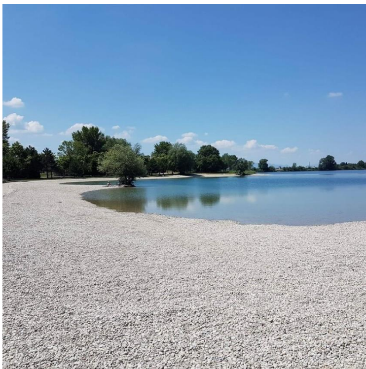
Slika 10 AquaCity Varaždin