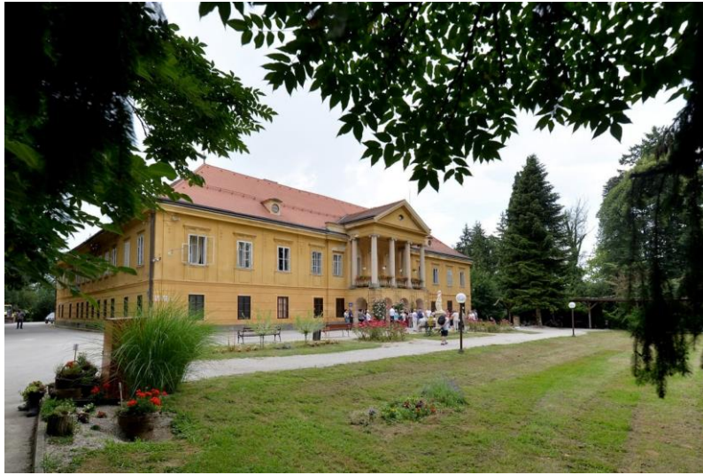
Slika 16 Dvorac Erdödy

obitelji Erdödy, jedne od najutjecajnijih plemićkih obitelji u Hrvatskoj. Obitelj Erdödy koristila je dvorac kao ljetnikovac, ali i kao mjesto za upravljanje svojim posjedima (sl. 16).