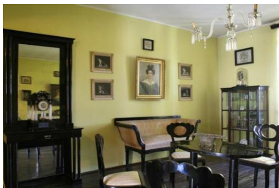
Slika 12 Stari Grad Varaždin