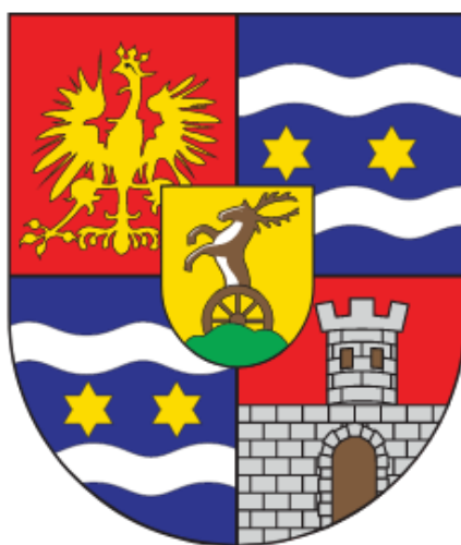
Slika 1 Grb Varaždinske županije