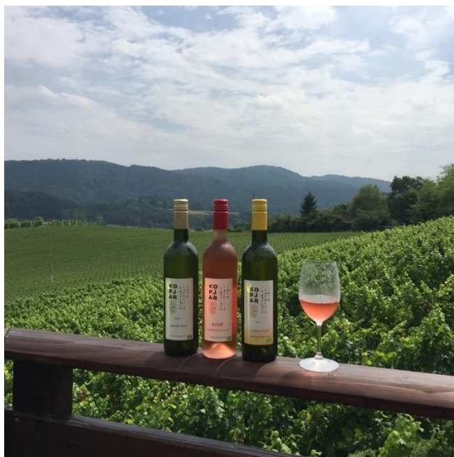
Slika 19 Vinarija Kopjar