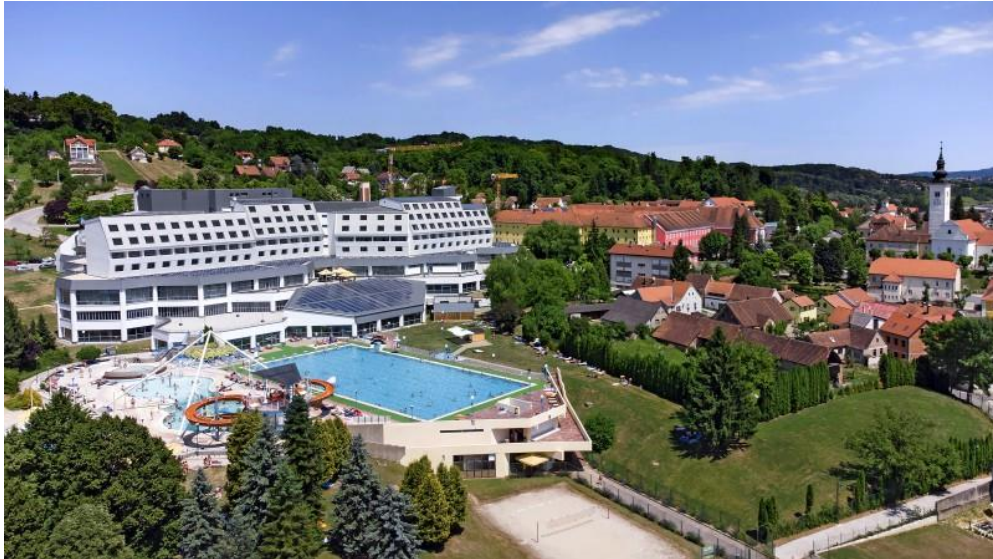
Slika 9 Sportsko - rekreacijski bazeni Minerva