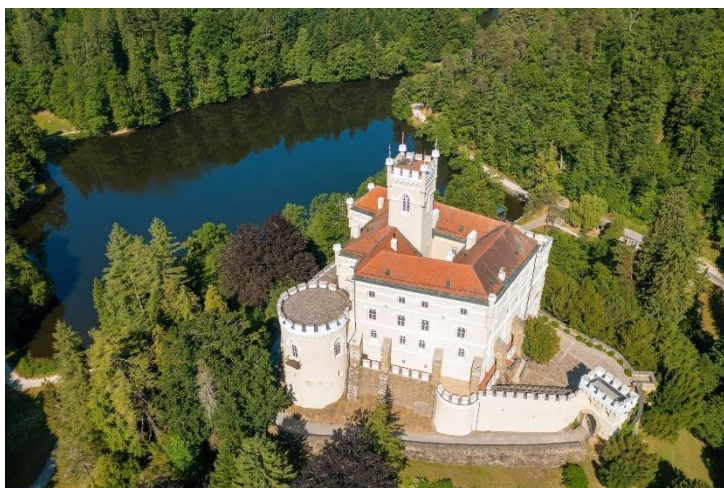
Slika 14 Dvorac Trakošćan