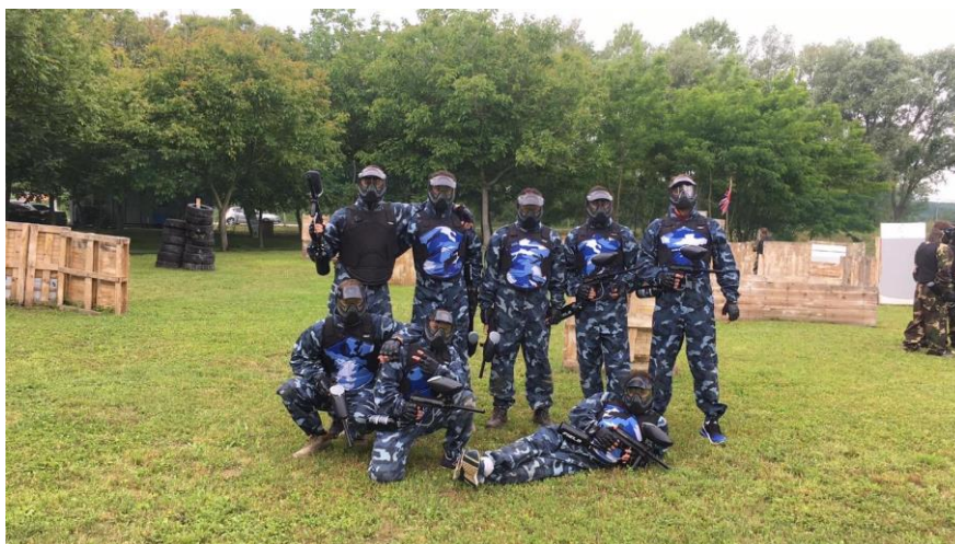
Slika 8 Adrenalinski park "Vručina"