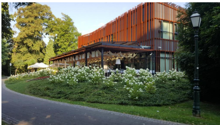
Slika 4 Park Boutique Hotel Varaždin