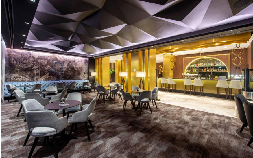
Slika 5 Hotel Turist