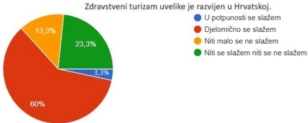
Graf 2 Zdravstveni turizam u Hrvatskoj

Nakon uvodnog dijela ankete i sociodemografskih pitanja, ispitanici se usmjeravaju na prvi dio ankete, vezan za potencijal razvoja zdravstvenog turizma u Hrvatskoj.