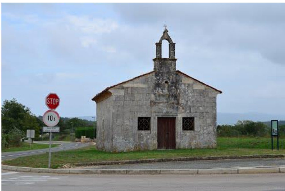
Slika 6. Crkva Majke Božje od Oranice

„Danas je uglavljena na zelenom ljevkastom otoku, na raskršću prometnica iz smjera Žminja i Vodnjana. Pravokutnog je tlocrta. Strukturu zidova čine krupni klesanci uslojeni u redove nejednakih visina. Pročelje raščlanjuju trostruko profilirani portal ravnog nadvratnika i po jedan kvadratični prozorski otvor, bez istaknutog kamenog okvira, uz obje strane portala. Na sjevernom pročelju bočni ulaz pregrađen je u prozor. Također, važno je napomenuti, da isklesani natpis na ploči, na zapadnom pročelju svjedoči o obnovi iz 1863. godine.“ 14