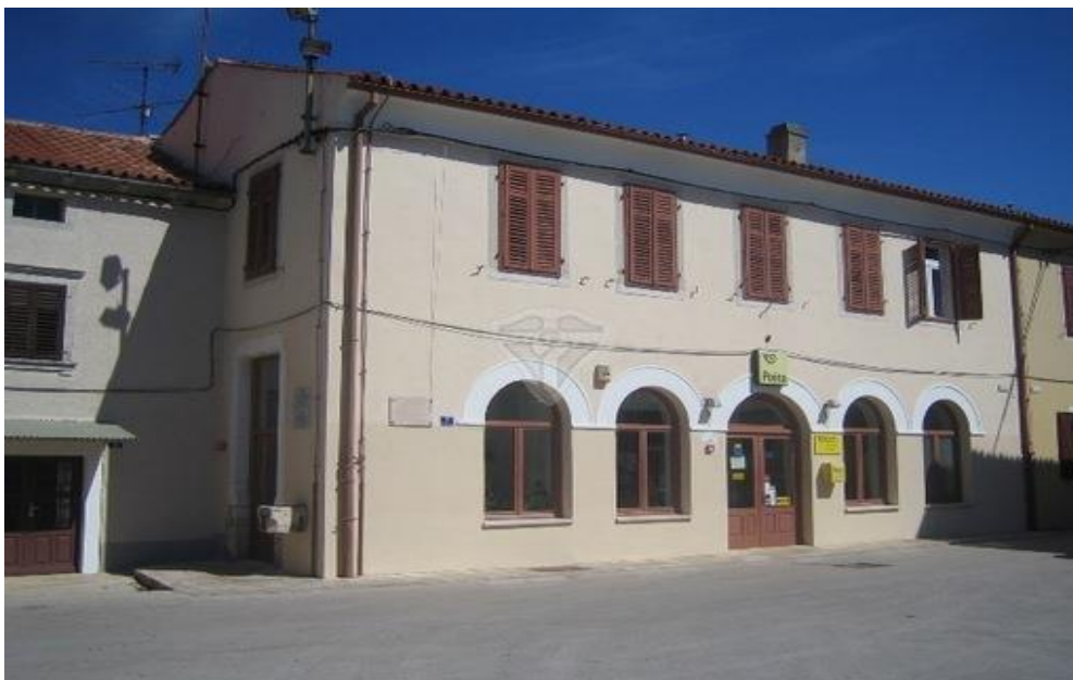
Slika 1. Barbanska loža