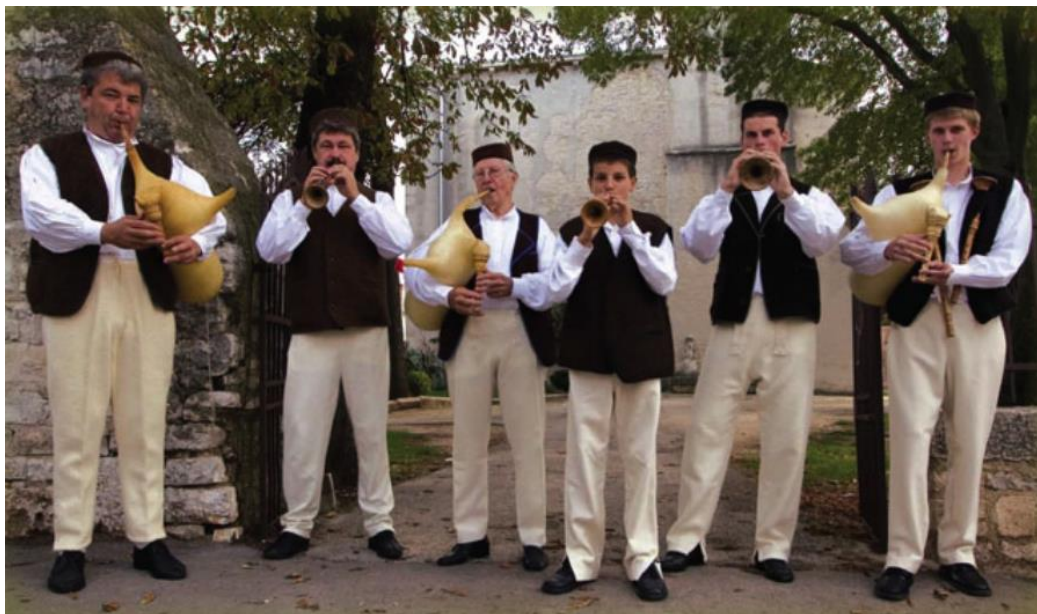
Slika 8. Muška narodna nošnja Barbanštine

mjesecima nosile ispletene od vune bijele boje, a ljeti su se nosile izrađene od pamučnog konca. Kamižola je vrsta prsluka bez rukava, okruglog vratnog izreza koja dužinom seže do koljena. Također valja još spomenuti kako su muškarci nekada nosili na lijevom uhu zlatni ranćin (naušnicu) kružnog oblika.