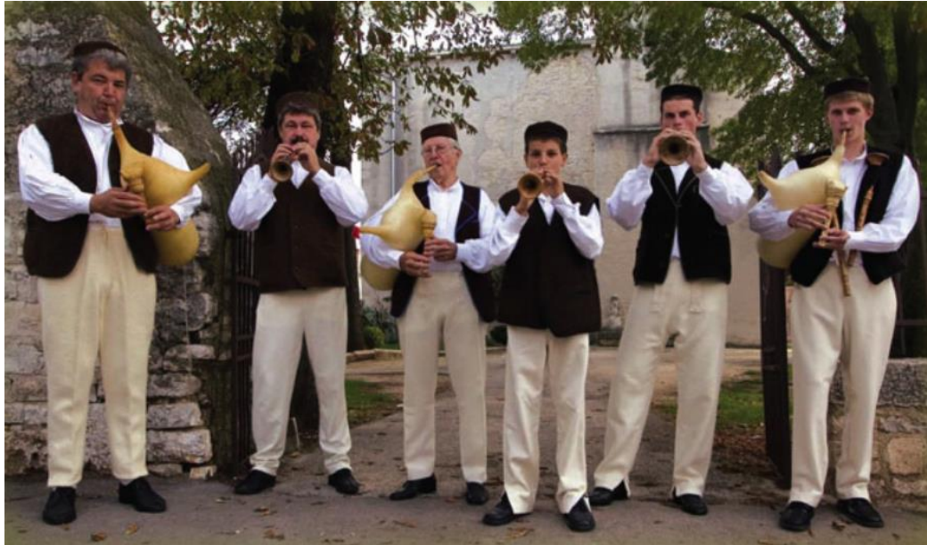
Slika 8. Muška narodna nošnja Barbanštine

mjesecima nosile ispletene od vune bijele boje, a ljeti su se nosile izrađene od pamučnog konca. Kamižola je vrsta prsluka bez rukava, okruglog vratnog izreza koja dužinom seže do koljena. Također valja još spomenuti kako su muškarci nekada nosili na lijevom uhu zlatni ranćin (naušnicu) kružnog oblika.