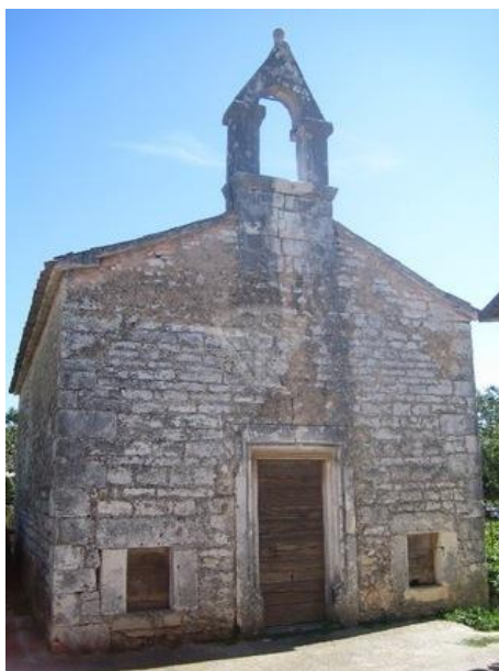
Slika 5. Crkva Sv. Jakova u Barbanu

„Tri su hodočasnika, otac, majka i sin, pošli iz Toulousa na put u Compostelu, odsjeli u jednoj gostionici u San Domingu de la Calzada, gdje je gostioničareva kći uzalud nastojala zavesti mladog i lijepog hodočasnika. Poput Potifarove žene koja se gledala osvetiti Josipu, gostioničareva kći mu je u torbu podmetnula jedan zlatni pehar i optužila ga za krađu. Kralj osudi mladića na smrt vješanjem, a roditelji nastavljaju hodočašće. Na povratku, svrativši do obješenog sina, vidjeli su da je on još živ, jer ga je pridržavao Sv. Jakov i onemogućio da se stegne uže oko vrata. Obavijestili su o tome kralja-suca koji to nije vjerovao, nego je rekao da mladić može biti živ upravo kao i pečeni pijetao i kokoš koji su se upravo nalazili na njegovu stolu. Uto je pijetao zakukurikao i poletio, te se i kralj uvjerio u istinitost tog čuda. Mladić je skinut s vješala i vraćen roditeljima, a djevojka i njen otac su kažnjeni.“ 13 Ova je legenda prikazana na zidnim slikama u crkvi sv. Jakova u devet scena.