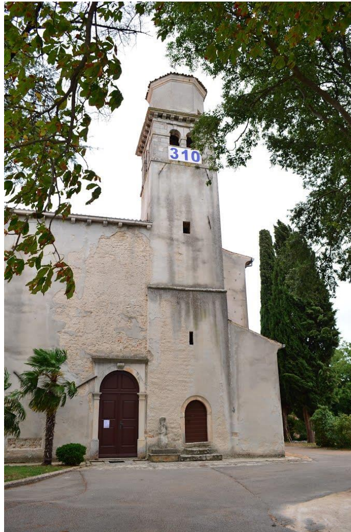
Slika 2. Crkva sv. Nikole u Barbanu