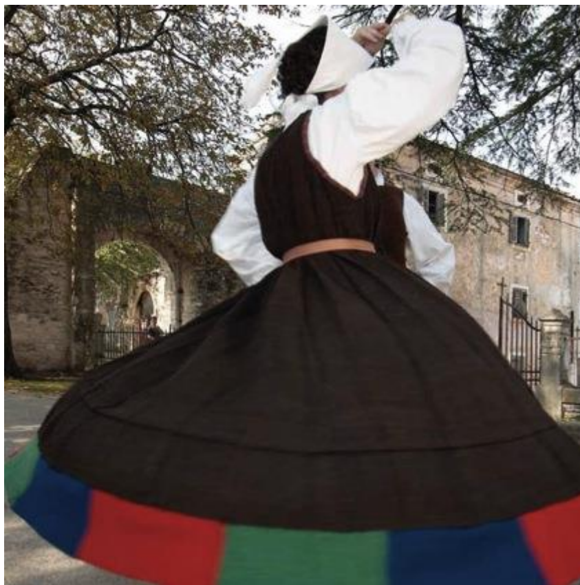
Slika 7. Narodna nošnja Barbanštine